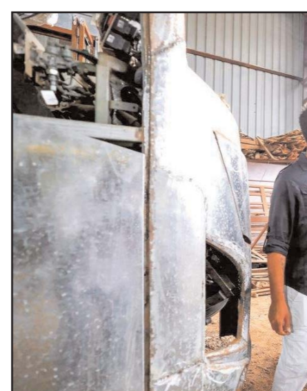
लोकसभा में विपक्ष के नेता और कांग्रेस सांसद राहुल गांधी, राजस्थान में एमएसएमई, रेगुलेटरी चुनौतियों और रोजगार से जुड़े मुद्दों पर छोटी बस और ट्रक बांडी बनाने वालों के एक प्रतिनिधिमंडल से बातचीत करते हुए।

है। स्थानीय अधिकारियों का कहना है कि अचानक मौसम में बदलाव और तेज हवाओं के कारण आपातकालीन लैंडिंग की गई है। हालांकि, इसकी जांच शुरू कर दी गई है। घटना रायसन के पास चंडीगढ़-मंडी राजमार्ग पर उस समय हुई, जब कोई वाहन नहीं गुजर रहा था, वरना बड़ा हादसा हो सकता था। हालांकि, घटना के बाद कुछ समय के लिए यातायात बाधित हुआ। लोगों ने सवाल उठाया है कि मानसून में पैराग्लाइडिंग की अनुमति क्यों दी जा रही है?