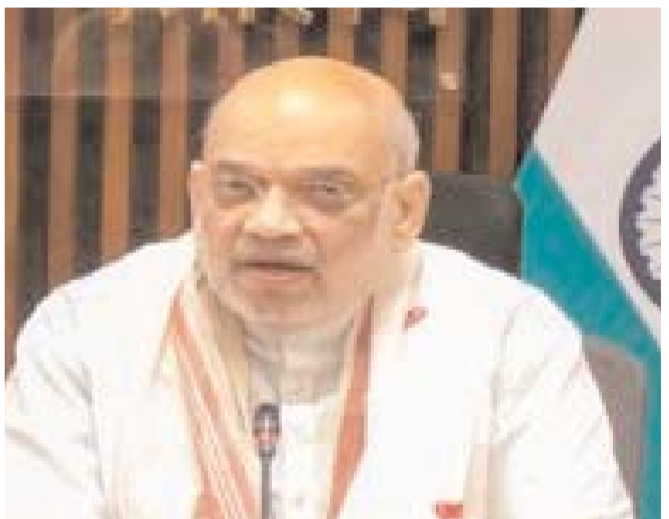
पांच साल में समस्याओं को पहचान कर उसके निदान को दिशा में कदम बढ़ाए हैं। हमने यह सुनिश्चित किया है कि हमारे कामों से प्रदेश के विकास को नई गति मिले। जब कभी सहकारिता आंदोलन का इतिहास लिखा जाएगा, तो उसे स्वर्णिम अक्षरों से लिखा जाएगा। आज हमने कई परियोजनाएं शुरू की हैं, जो पहले पाइपलाइन में थीं। एनडीए की परंपरा रही है कि जब कभी हमें शासन मिला, तो हमने इस देश के दबे कुचले लोगों को बल देने का काम किया। जब अटल जी प्रधानमंत्री बनें, तो उन्होंने जनजातीय मंत्रालय की शुरुआत की। इसी तरह जब नरेंद्र मोदी प्रधानमंत्री बनें तो उन्होंने जलशक्ति मंत्रालय की शुरुआत की। इसी तरह मत्स्य मंत्रालय और पशुपालन और डेयरी मंत्रालय की शुरुआत की।