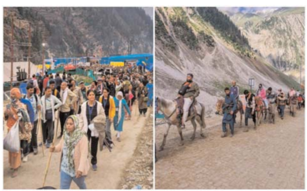
है कि सरकार और सुरक्षा बल यात्रा के दौरान श्रद्धालुओं की सुरक्षा और सुविधा के लिए पूरी प्रतिबद्धता के साथ काम कर रहे हैं।

पहलगाम (आरएनएस)। जम्मू-कश्मीर के उपराज्यपाल मनोज सिन्हा ने अमरनाथ यात्रा की व्यवस्थाओं का जायजा लेने के लिए नूनवान और चंदनवाड़ी का दौरा किया। इस दौरान उन्होंने श्रद्धालुओं से बातचीत की। वहीं, पहलगाम के नूनवान बेस कैंप से श्रद्धालुओं का चौथा जत्था रवाना किया गया। पहलगाम से अमरनाथ यात्रा पर रवाना हो रही एक महिला श्रद्धालु ने कहा, मैं दूसरी बार आई हूँ और काफी उत्साहित हूँ। बाबा का आशीर्वाद हम सभी पर है। हमारी सेना बहुत अच्छा काम कर रही है। इसमें कोई शक नहीं है। सेना हर स्तर पर सहयोग कर रही है। मैं बस यही चाहती हूँ कि लोग भी सेना का पूरा सहयोग करें, क्योंकि यह बहुत जरूरी है। पहलगाम से रवाना होने वाली एक अन्य महिला श्रद्धालु ने बताया, मैं दिल्ली से आई हूँ। मैंने वहां ऑफलाइन पंजीकरण कराया था। मुझे वहां किसी तरह की परेशानी नहीं हुई। यहां भी एयरपोर्ट पर आसानी से आरएफआईडी मिल गया इस बीच, जम्मू से श्री अमरनाथ यात्रा के लिए तीर्थयात्रियों का पांचवां जत्था श्रीनगर के लिए रवाना किया गया। आईएनएस से बातचीत में एक श्रद्धालु ने कहा कि यहां की सेवा-व्यवस्था बहुत अच्छी है और दोनों महतों का आशीर्वाद सभी श्रद्धालुओं पर है। उन्होंने कहा कि व्यवस्थाएं जिस तरह से संचालित की जा रही हैं, उसे देखते हुए साधुओं की संख्या लगातार बढ़ रही है। श्रद्धालु ने आगे कहा कि प्रशासन और सरकार जिस तरह से काम कर रहे हैं, उससे श्रद्धालुओं को यात्रा के लिए बेहतर माहौल मिला है। उन्होंने कहा कि अनुच्छेद 370 हटने के बाद यहां का शांतिपूर्ण वातावरण यह दर्शाता