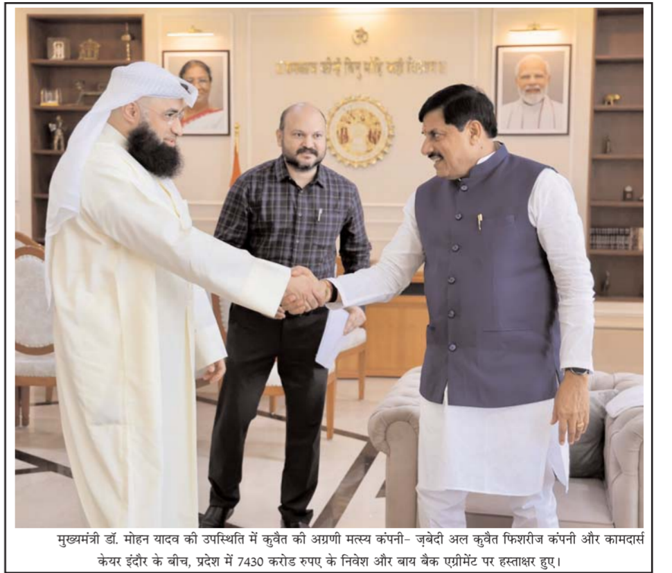
मुख्यमंत्री डॉ. मोहन यादव की उपस्थिति में कुवैत की अग्रणी मत्स्य कंपनी- जुवेदी अल कुवैत फिशरीज कंपनी और कामदास केसर इंदौर के बीच, प्रदेश में 7430 करोड़ रुपये के निवेश और बाय बैक एग्रीमेंट पर हस्ताक्षर हुए।

भोपाल (आरएनएस)। मध्यप्रदेश पूर्व क्षेत्र विद्युत वितरण कंपनी लिमिटेड ने लाइन एवं सबस्टेशन से जुड़े कार्यों में पारदर्शिता और गुणवत्ता बनाए रखने के लिए नए निर्देश जारी किए हैं। कंपनी ने स्पष्ट किया है कि जिस पैनलबन्ड (Empanelled) ठेकेदार के नाम पर कार्य आदेश (Purchase Order) जारी किया गया है, वही संबंधित कार्य करेगा। किसी भी स्थिति में वह कार्य किसी अन्य ठेकेदार, एजेंसी या व्यक्ति को नहीं सौंपा जा सकेगा। कंपनी के सज्ञान में आया था कि कुछ स्थानों पर कार्य आदेश एक ठेकेदार के नाम पर जारी होने के बावजूद काम किसी अन्य व्यक्ति या ठेकेदार से कराया जा रहा था। इसे कंपनी ने नियमों का गंभीर उल्लंघन माना है।