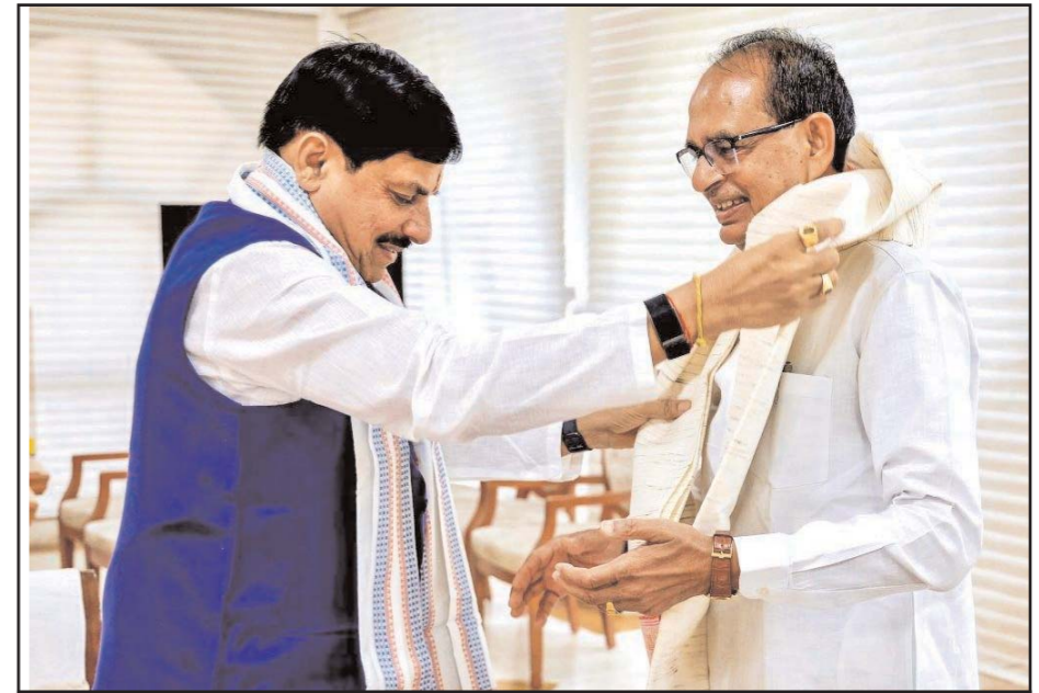
मध्य प्रदेश के मुख्यमंत्री मोहन यादव ने भोपाल में मुख्यमंत्री आवास पर केंद्रीय कृषि एवं किसान कल्याण और ग्रामीण विकास मंत्री शिवराज सिंह चौहान से मुलाकात की।