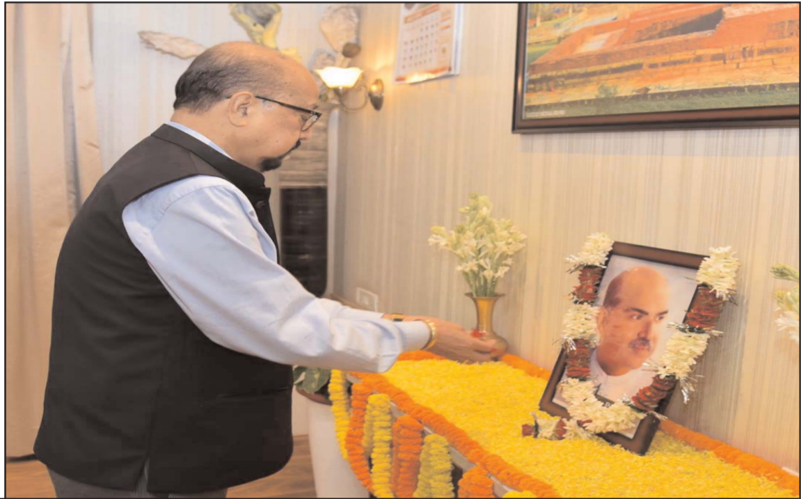
रायपुर। प्रखर राष्ट्रवादी नेता एवं महान शिक्षाविद् डॉ. श्यामा प्रसाद मुखर्जी की जयंती पर आज लोक भवन में राज्यपाल श्री रमेन डेका ने उनके चित्र पर पुष्पांजलि अर्पित कर भावभीनी श्रद्धांजलि दी।

है। पिछले 36 घंटे से हो लगातार मूसलाधार बारिश ने पूरे प्रदेश में बाढ़ जैसे हालात पैदा कर रफ्तार से हवाओं ने ने कहर मचाया है। कहीं सड़कें बह गईं, कहीं लोग बाढ़ के पानी में फंस गए, जिन्हें रेस्क्यू कर सुरक्षित निकाला जा रहा है। जिलों में नदियां खतरे के निशान के करीब बह रही है। कई एनीकट से ऊपर से पानी बह रहा है। दर्जनों गांवों का जिला मुख्यालयों से संपर्क टूट चुका है। मौसम विभाग ने साफ कर दिया है कि 8 जुलाई से पहले राहत मिलने के आसार कम हैं। लगातार 36 घंटे से हो रही बारिश ने निर्माण कार्यों के गुणवत्ता की भी पोल खोल दी है। प्रदेश के अलग-अलग हिस्सों में सड़कें टूट गई हैं, पुल-पुलियां क्षतिग्रस्त हो गई हैं। राजनांदगांव के रेलवे ओवर ब्रिज की सड़क बीचो-बीच फट गई, वहीं जिला अस्पताल में पानी मरीजों के बेड तक पहुंच गया। मौसम विभाग ने निकले इलाके में रहने वाले लोगों को सतर्क रहने, अनावश्यक यात्रा से बचने और मौसम विभाग की एडवाइजरी का पालन करने की अपील की है मौसम विभाग ने अगले 48 घंटों के लिए मध्य और उत्तरी छत्तीसगढ़ में भारी बारिश और वज्रपात की चेतावनी जारी की है। प्रशासन ने नागरिकों को सतर्क रहने और खराब मौसम में नदी-नालों के पास जाने से बचने की सलाह दी है। विभाग का अनुमान है कि 8 जुलाई के बाद बारिश की तीव्रता में कुछ कमी आ सकती है, जिससे स्थिति सामान्य होने की उम्मीद है।