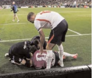
मेक्सिको सिटी (ए.)। फीफा वर्ल्ड कप

2026 के राउंड ऑफ 16 में मेक्सिको पर 3-2 की रोमांचक जीत के बाद इंग्लैंड को बड़ा झटका लगा है। टीम के अनुभवी मिडफील्डर जॉर्डन हेंडरसन जीत का जश्न मनाते के दौरान चोटिल हो गए हैं। इंग्लैंड के हेड कोच थॉमस ट्यूशेल ने बताया कि हेंडरसन की कलाई में गंभीर चोट लगी है और उन्हें अस्पताल में भर्ती कराया गया है। हेंडरसन इस मुकाबले में मैदान पर नहीं उतरे थे, लेकिन मैच खत्म होने के बाद टीम के साथ जीत का जश्न मना रहे थे। इसी दौरान वह विज्ञापन बोर्ड से नीचे गिर गए और उनकी कलाई में काफी गंभीर चोट लगी है। डॉक्टरों ने बताया है कि उन्हें अस्पताल ले जाया गया है। यह हमारे लिए दुखद खबर है, क्योंकि जीत की