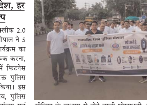
मीडिया के माध्यम से होने वाली धोखाधड़ी, डिजिटल अरेस्ट और फर्जी निवेश योजनाओं से बचने के उपाय बताए। साथ ही साइबर अपराध का शिकार होने पर तत्काल साइबर हेल्पलाइन 1930 पर सूचना देने और राष्ट्रीय साइबर अपराध पोर्टल पर शिकायत दर्ज कराने की जानकारी भी