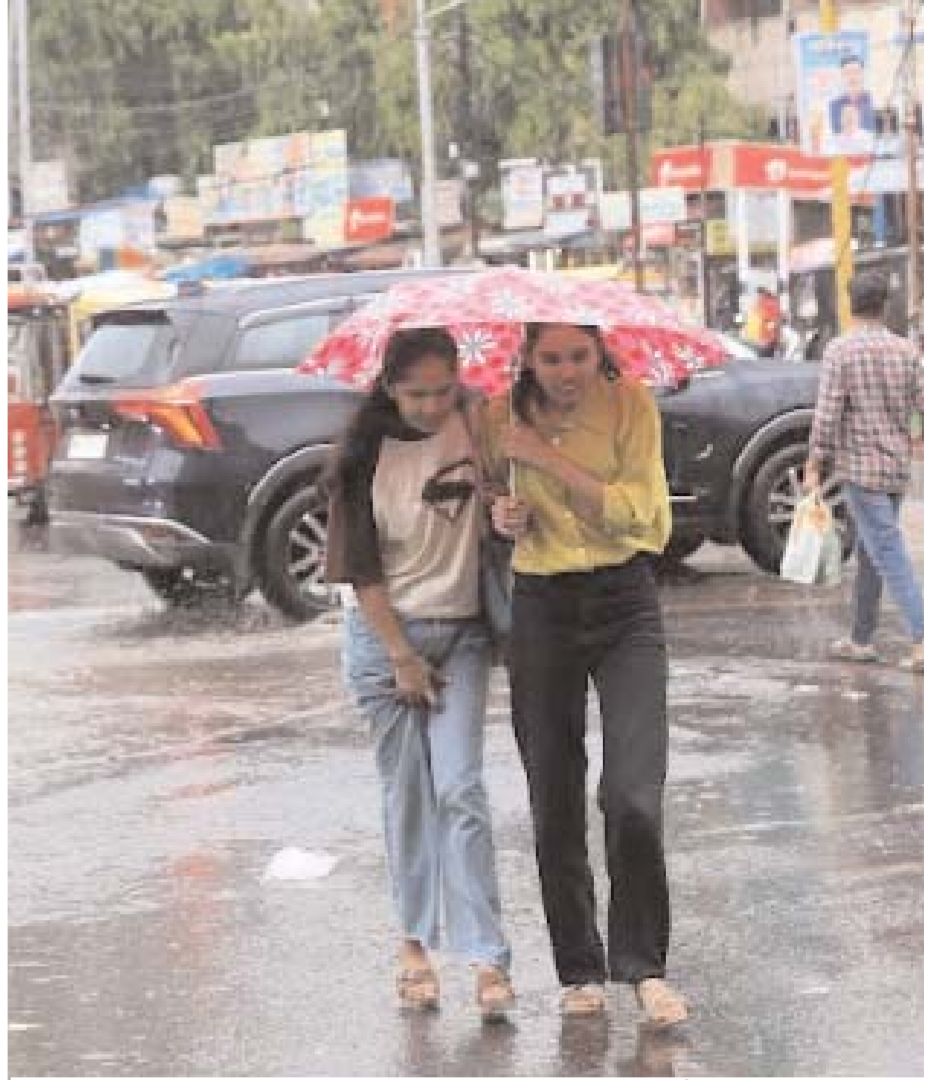
राजधानी भोपाल बारिश के दौरान छाते में जाती हुई लड़कियाँ।

मध्यप्रदेश का अन्नदाता अपने अनुभव, परिश्रम और आधुनिक तकनीकों के समन्वय से हर चुनौती का सफलतापूर्वक सामना करने में सक्षम है। मुख्यमंत्री डॉ. यादव ने किसानों को आश्वासन दिया कि प्रदेश सरकार हर परिस्थिति में उनके साथ खड़ी है। किसानों को आवश्यक तकनीकी मार्गदर्शन, कृषि आदान उपलब्ध कराने तथा परिस्थितियों के अनुरूप हर संभव सहयोग सुनिश्चित करने के लिए सभी विभागों को निर्देश दिए गए हैं। सरकार का प्रयास है कि किसी भी किसान को कठिनाई का सामना न करना पड़े। कृषि उत्पादन प्रभावित न हो और किसानों के हित भी हर तरह से सुरक्षित रहें। मुख्यमंत्री ने कहा है कि कृषि और अन्नदाता प्रदेश के साथ देश के अर्थव्यवस्था की रीढ़ है। किसानों की आय बढ़ाने और आधुनिक जरूरतों के अनुसार उन्हें सभी सुविधाएँ उपलब्ध कराना हमारा कर्तव्य है। इसी आशय से प्रदेश में वर्ष 2026 कृषक कल्याण वर्ष के रूप में मनाया जा रहा है।