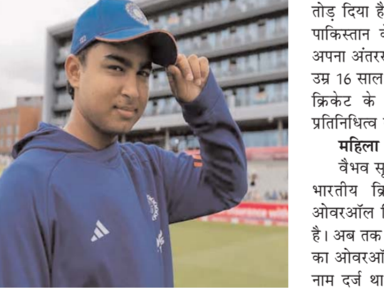
उम्र में अपना इंटरनेशनल डेब्यू किया है। इसके साथ ही उन्होंने क्रिकेट के भगवान कहे जाने वाले 'मास्टर ब्लास्टर' सचिन तेंदुलकर का 37 साल पुराना रिकॉर्ड