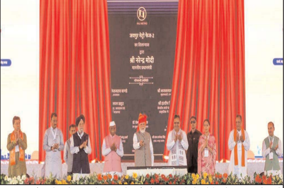
राजस्थान के बालोतरा में एक सार्वजनिक कार्यक्रम के दौरान प्रधानमंत्री नरेंद्र मोदी कई विकास परियोजनाओं का उद्घाटन करते हुए। इस मौके पर केंद्रीय पेट्रोलियम और प्राकृतिक गैस मंत्री हरदीप सिंह पुरी, राजस्थान के राज्यपाल हरिभाऊ बागडे, राज्य के मुख्यमंत्री भजनलाल शर्मा, राजस्थान के उपमुख्यमंत्री प्रेम चंद बेरवा और दिया कुमारी, राजस्थान भारतीय जनता पार्टी के अध्यक्ष मदन राठौड़ और अन्य लोग भी मौजूद हैं।