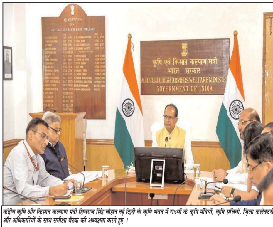
केंद्रीय कृषि और किसान कल्याण मंत्री शिवराज सिंह चौहान नई दिल्ली के कृषि भवन में 14 जून को कृषि मंत्रियों, कृषि सचिवों, जिला कलेक्टरों और अधिकारियों के साथ समीक्षा बैठक की अध्यक्षता करते हुए।