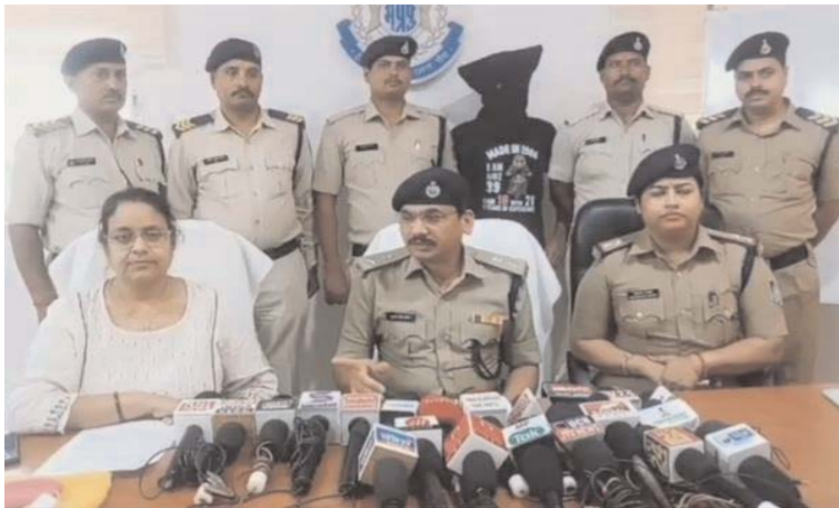
तकनीकी साक्ष्यों और सतर्क पुलिसिंग से आरोपी गिरफ्तार लगभग 10 लाख रूपए से अधिक की सम्पूर्ण संपत्ति बरामद

जबलपुर (आरएनएस)। मध्यप्रदेश पुलिस की संवेदनशील, तकनीक आधारित एवं त्वरित कार्रवाई का एक उत्कृष्ट उदाहरण सामने आया है। जीआरपी थाना जबलपुर ने