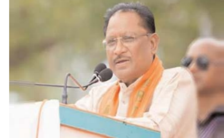
फसल विविधीकरण, जल संरक्षण और किसान समृद्धि के मॉडल के रूप में उभर रहा है राजनांदगांव : मुख्यमंत्री साय