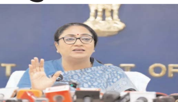
-42 स्थानों पर मिलेंगी 21 योजनाओं की सुविधाएं

नई दिल्ली, (आरएनएस)। केंद्र और दिल्ली सरकार की जनकल्याणकारी योजनाओं का लाभ अधिक से अधिक लोगों तक पहुंचाने के उद्देश्य से राजधानी दिल्ली में जन कल्याण शिविरों का आयोजन शुरू किया गया। इसी क्रम में संदेश विहार स्थित एमसीडी कम्युनिटी हॉल में मुख्यमंत्री रेखा गुप्ता ने जन कल्याण शिविर का शुभारंभ किया। यह विशेष अभियान 18 से 20 जून तक दिल्ली के 42 विभिन्न स्थानों पर आयोजित किया जा रहा है। मुख्यमंत्री रेखा गुप्ता ने बताया गया कि प्रधानमंत्री नरेंद्र मोदी के नेतृत्व में सेवा, सुशासन और जनकल्याण के 12 वर्ष पूर्ण होने के उपलक्ष्य में इन शिविरों का आयोजन किया जा रहा है। शिविरों में केंद्र एवं दिल्ली सरकार की विभिन्न योजनाओं से संबंधित जानकारी, पंजीकरण और आवश्यक सेवाएं एक ही स्थान पर उपलब्ध कराई जा रही हैं, जिससे लोगों को सरकारी कार्यालयों के चक्कर न लगाने पड़े। कार्यक्रम में उपस्थित दिल्ली की डिप्टी मेयर मोनिका पंत ने कहा कि प्रधानमंत्री मोदी के 12 वर्षों के सफल कार्यकाल की उपलब्धियों और जनहितकारी योजनाओं को जनता तक पहुंचाने के लिए भारतीय जनता पार्टी का प्रत्येक कार्यकर्ता सक्रिय रूप से योगदान दे रहा है। मुख्यमंत्री ने कहा कि सरकार