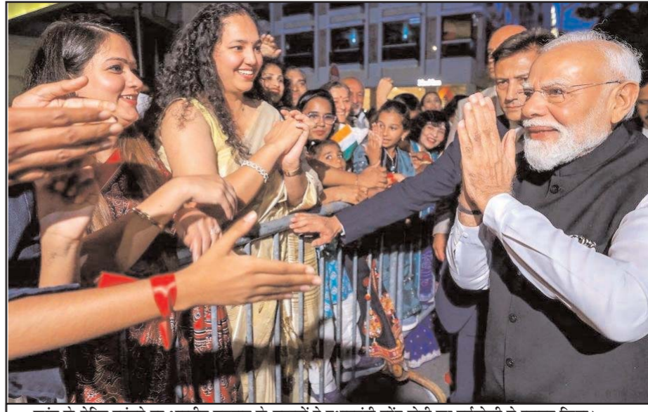
फ्रांस के पेरिस पहुंचने पर भारतीय समुदाय के सदस्यों ने प्रधानमंत्री नरेंद्र मोदी का गर्मजोशी से स्वागत किया।