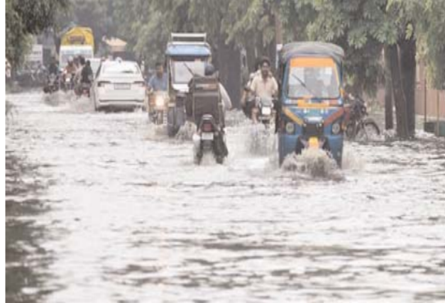
हरियाणा के कई हिस्सों में अगले दो दिनों में गरज के साथ बारिश और तेज हवा चलेगी।