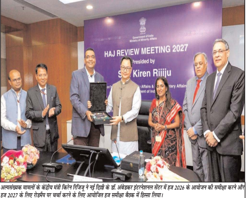
अल्पसंख्यक मामलों के केंद्रीय मंत्री किरोन रिज्जू ने नई दिल्ली के डॉ. अब्दुल इंटरनेशनल सेंटर में हज 2026 के आयोजन की समीक्षा करने और हज 2027 के लिए रोडमैप पर चर्चा करने के लिए आयोजित हज समीक्षा बैठक में हिस्सा लिया।

रोजगार सृजन में तेजी लाने के अलावा रोजगार के औपचारिकीकरण को बढ़ावा देना, रोजगार पात्रता बढ़ाना और विभिन्न क्षेत्रों में सामाजिक सुरक्षा के दायरे का विस्तार करना है। इतना ही नहीं योजना के तहत अब तक देशभर में 15 लाख रोजगार के अवसर सृजित किए जा चुके हैं। पीएम-वीबीआरवाई का उद्देश्य पहली बार नौकरी पाने वाले युवाओं तथा नए रोजगार सृजित करने वाले नियोक्ताओं को वित्तीय प्रोत्साहन देकर औपचारिक रोजगार को बढ़ावा देना है। योजना के तहत पहली बार नौकरी पाने वाले कर्मचारियों को 15,000 रुपये तक की प्रोत्साहन राशि दी जाती है। साथ ही अतिरिक्त रोजगार मुहैया कराने वाले नियोक्ताओं को प्रत्येक अतिरिक्त कर्मचारी के लिए प्रति माह 3,000 रुपये तक का प्रोत्साहन मिलता है। बयान में कहा गया है कि आर्थिक वृद्धि में विनिर्माण क्षेत्र की अहम भूमिका को देखते हुए इस क्षेत्र के नियोक्ताओं को चार वर्ष तक प्रोत्साहन राशि दी जाएगी, जबकि अन्य क्षेत्रों के नियोक्ता दो वर्ष तक इस लाभ का फायदा उठा सकेंगे।