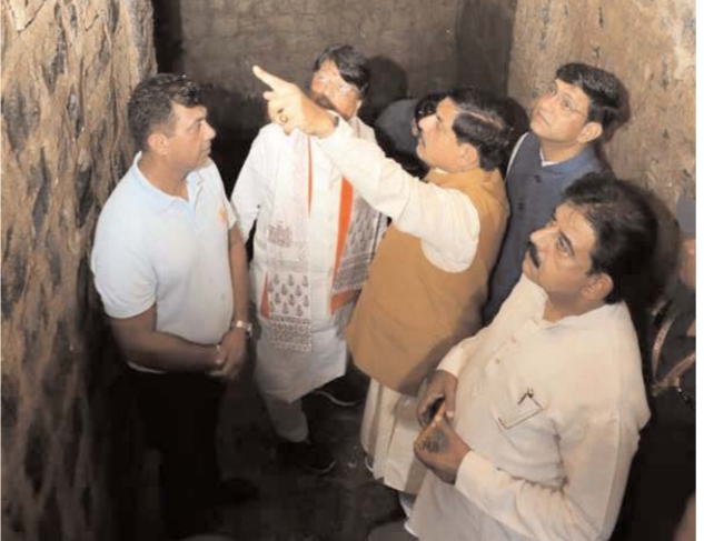
भोपाल (ए.)। मुख्यमंत्री डॉ. मोहन यादव ने कहा है कि हमारी प्राचीन बावड़ियाँ और जल संरचनाएँ हमारी समृद्ध वास्तुकला और उत्कृष्ट जल प्रबंधन की प्रतीक हैं। इन ऐतिहासिक धरोहरों को संजोकर रखना सरकार की प्राथमिकता

मुख्यमंत्री ने प्राचीन श्री वीरगढ़ी हनुमान मंदिर परिसर की बावड़ी का किया अवलोकन