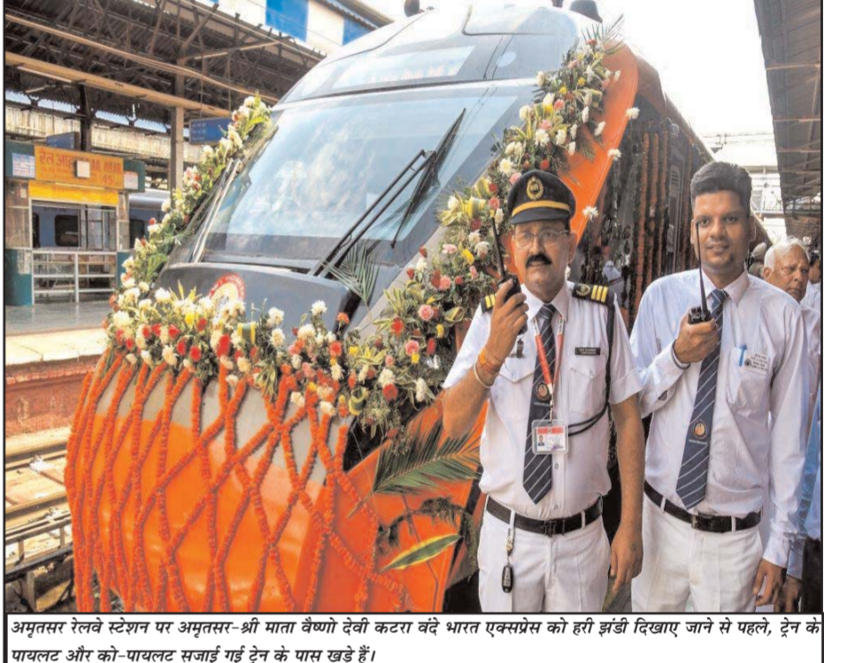
अमृतसर रेलवे स्टेशन पर अमृतसर-श्री माता वैष्णो देवी कटरा वंदे भारत एक्सप्रेस को हरी झंडी दिखाए जाने से पहले, ट्रेन को पायलट और को-पायलट सजाई गई ट्रेन के पास खड़े हैं।

(पांचवां संशोधन) नियम, 2026 लागू करने की घोषणा की है। आधिकारिक राजपत्र में प्रकाशन के साथ ही ये नियम प्रभावी हो गए हैं। संशोधन के तहत ड्रग्स रूल्स, 1945 के शेड्यूल-के से 'सिरप' शब्द को हटा दिया गया है, जिससे सिरप आधारित दवाओं को पहले प्राप्त कुछ विशेष छूट अब नहीं मिलेंगी। अब तक एंटीसेप्टिक, एंटासिड, गर्भनिरोधक उत्पादों सहित कुछ दवाओं को ओवर-द-काउंटर (OTC) बिक्री की अनुमति थी। हालांकि नए नियम लागू होने के बाद सिरप आधारित दवाओं को इस श्रेणी से बाहर कर दिया गया है। इसके परिणामस्वरूप कफ सिरप और अन्य सिरप फॉर्मूलेशन वाली दवाओं की बिक्री अधिक कड़े नियामकीय नियंत्रण के तहत होगी। स्वास्थ्य मंत्रालय के अधिकारियों का कहना है कि इस बदलाव के बाद मरीजों को ऐसी दवाएं खरीदने के लिए डॉक्टर का वैध पर्चा प्रस्तुत करना होगा। सरकार का मानना है कि इससे दवाओं के गलत इस्तेमाल और संभावित दुष्प्रभावों पर अंकुश लगाने में मदद मिलेगी।