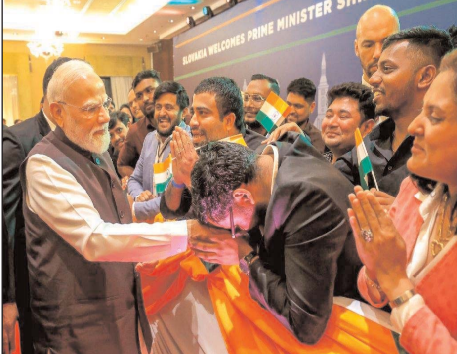
स्लोवाकिया के ब्रातिस्लावा पहुंचने पर भारतीय समुदाय के सदस्यों ने प्रधानमंत्री नरेंद्र मोदी का गर्मजोशी से स्वागत किया।

यहां ग्रैंड होटल रिबर पार्क पहुंचने पर, प्रधानमंत्री नरेंद्र मोदी का लुबिनका एन्सेम्बल ने गर्मजोशी से स्वागत किया। स्लोवाक संस्कृति के अनुसार, मेहमानों और खास लोगों का स्वागत रोटी और नमक की एक छोटी डिश से किया जाता है। रोटी खुशहाली को दिखाती है, जबकि नमक कोमत, दोस्ती और सुरक्षा का प्रतीक है। स्लोवाकिया के मायजावा इलाके के प्रसिद्ध बच्चों के लोक समूह ने भी प्रधानमंत्री मोदी के स्वागत में पारंपरिक स्लोवाक नृत्य किया।