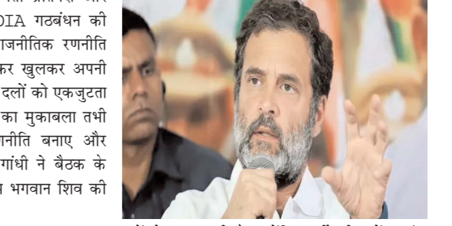
दलों से अलग रही है, क्योंकि पार्टी को जड़ें स्वतंत्रता आंदोलन और लोकतांत्रिक संघर्षों से जुड़ी हैं। सहयोगी दलों को दी चेतावनी राहुल गांधी ने बैठक में कहा कि विपक्षी दलों को मौजूदा राजनीतिक परिस्थितियों को नए नजरिए से देखने की जरूरत है। उन्होंने कहा कि कई क्षेत्रीय दल अब भी पुरानी राजनीतिक रणनीतियों पर भरोसा कर रहे हैं, जबकि देश की राजनीतिक परिस्थितियां काफी बदल चुकी हैं। उनके अनुसार, पहले जिन तरीकों से चुनावी सफलता मिलती थी, अब वही तरीके उतने प्रभावी नहीं रह गए हैं। इसलिए विपक्षी दलों को नई चुनौतियों के अनुरूप अपनी रणनीति में बदलाव करना होगा।