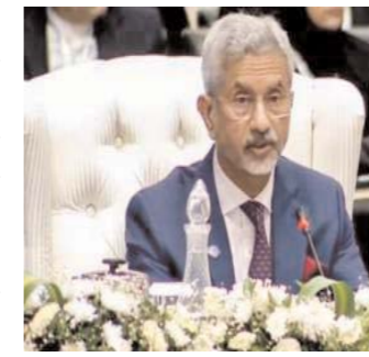
वैकल्पिक स्रोत के रूप में रूस की तरफ बढ़ने के लिए मजबूर किया। यह फैसला किसी राजनीतिक संदेश के लिए नहीं, बल्कि अपनी परेले जरूरतों को पूरा करने के लिए लिया गया था। अपने संबोधन में डॉ. जयशंकर ने अमेरिका की दोहरी नीति पर भी तीखा कटाक्ष किया। उन्होंने खुलासा किया कि वर्ष 2022 में खुद अमेरिका ने भारत को रूसी तेल खरीदने के लिए पर्दे के पीछे से प्रोत्साहित किया था, ताकि वैश्विक ऊर्जा बाजार में तेल की भारी फिक्कल न हो और अंतरराष्ट्रीय स्तर पर तेल की कीमतें नियंत्रण में रहें। उन्होंने कहा कि यह एक अजीब खेल है जहां एक समय तेल खरीदने का दबाव बनाया जाता है और दूसरे समय उसी नीति को लेकर सवाल खड़े किए जाते हैं। अंतरराष्ट्रीय राजनीति केवल सिद्धांतों या नैतिकता से नहीं, बल्कि व्यावहारिक हितों से चलती है और दुनिया के सभी देश इस सच को अच्छी तरह समझते हैं।

नई दिल्ली/हेलसिंकी, (आरएनएस)। विदेश मंत्री डॉ. एस. जयशंकर ने फिनलैंड में आयोजित प्रतिष्ठित 'कुल्लारंता वार्ता' (Kullaranta Talks) में रूस से कच्चे तेल की खरीद को लेकर पश्चिमी देशों और मीडिया द्वारा की जाने वाली आलोचनाओं का एक बार फिर बेहद बेबाक और कड़ा जवाब दिया है। उभरती शक्तियाँ और नई भू-राजनीतिक प्रतिस्पर्धा विषय पर आयोजित चर्चा के दौरान उन्होंने स्पष्ट किया कि भारत अपनी ऊर्जा सुरक्षा और 140 करोड़ नागरिकों के आर्थिक हितों को सर्वोपरि रखकर ही फैसले लेता है। जयशंकर ने दोहरे शब्दों में कहा कि रूस-यूक्रेन युद्ध के दौरान यूरोप और अमेरिका की नीतियों में खुद कई विरोधाभास रहे हैं, इसलिए भारत को नैतिकता का पाठ पढ़ाने की कोशिश कतई उचित नहीं है। तब के दौरान जब एक पत्रकार ने भारत पर रूस के प्रति नरम रुख अपनाने और रूसी तेल खरीदने का सीधा आरोप लगाया, तो विदेश मंत्री ने उसे वैश्विक बाजार के