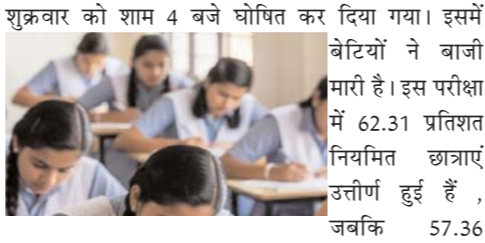
प्रतिशत छात्र उत्तीर्ण हुए हैं। विद्यार्थी परीक्षा परिणाम मंडल की वेबसाइट mpbse.mponline.gov.in पर जाकर देख सकते हैं। हायर सेकंडरी की द्वितीय परीक्षा में प्रदेश से 1 लाख 42 हजार 468 नियमित विद्यार्थियों ने फॉर्म भरा था। इसमें से 1 लाख 42 हजार 467 विद्यार्थी परीक्षा में शामिल हुए थे। शुक्रवार 12 जून को घोषित हुए परीक्षा परिणाम में 84 हजार 871 विद्यार्थी उत्तीर्ण हुए। 33 हजार 334 स्वाध्यायी विद्यार्थियों ने भरा था फॉर्म हायर सेकंडरी की द्वितीय परीक्षा में 33 हजार 334

भोपाल (आरएनएस)। माध्यमिक शिक्षा मंडल, मध्यप्रदेश की हायर सेकंडरी द्वितीय परीक्षा वर्ष-2026 का नियमित एवं स्वाध्यायी विद्यार्थियों का परीक्षा परिणाम शुक्रवार को शाम 4 बजे घोषित कर दिया गया। इसमें बेटियों ने बाजी मारी है। इस परीक्षा में 62.31 प्रतिशत नियमित छात्राएं उत्तीर्ण हुई हैं, जबकि 57.36 प्रतिशत छात्र उत्तीर्ण हुए हैं। विद्यार्थी परीक्षा परिणाम मंडल की वेबसाइट mpbse.mponline.gov.in पर जाकर देख सकते हैं। हायर सेकंडरी की द्वितीय परीक्षा में प्रदेश से 1 लाख 42 हजार 468 नियमित विद्यार्थियों ने फॉर्म भरा था। इसमें से 1 लाख 42 हजार 467 विद्यार्थी परीक्षा में शामिल हुए थे। शुक्रवार 12 जून को घोषित हुए परीक्षा परिणाम में 84 हजार 871 विद्यार्थी उत्तीर्ण हुए। 33 हजार 334 स्वाध्यायी विद्यार्थियों ने भरा था फॉर्म हायर सेकंडरी की द्वितीय परीक्षा में 33 हजार 334