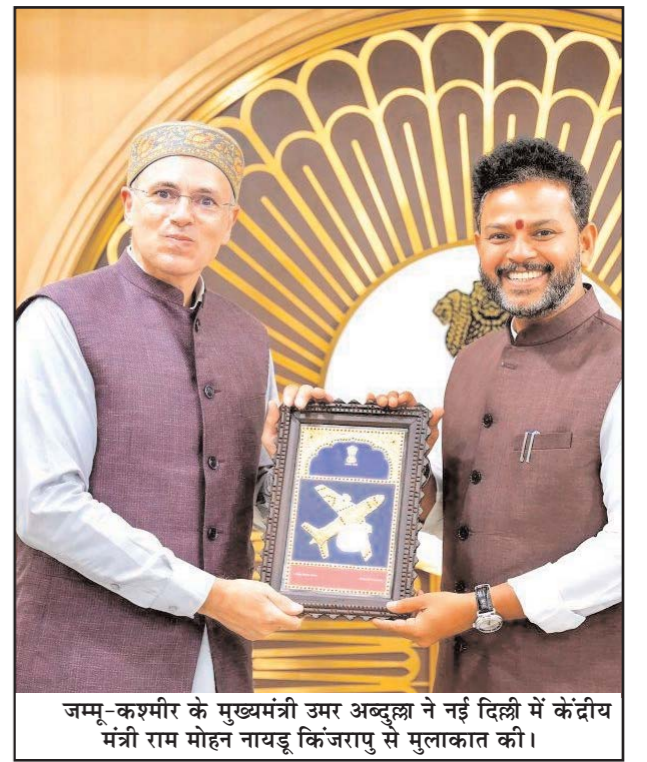
जम्मू-कश्मीर के मुख्यमंत्री उमर अब्दुल्ला ने नई दिल्ली में केंद्रीय मंत्री राम मोहन नायडू किंजरापु से मुलाकात की।

नई दिल्ली, (आरएनएस)। ओमान की खाड़ी में एक जहाज पर हुए हमले में 3 भारतीय नाविकों की मौत हो गई है। इसके बाद बंदरगाह, जहाजरानी और जलमार्ग मंत्रालय ने कहा कि खाड़ी में भारतीय नाविकों की सुरक्षा के लिए सरकार उच्चतम अलर्ट पर है। मंत्रालय ने कहा कि भारतीय नाविकों को सहायता सुनिश्चित करने के लिए सरकार होर्मुज जलडमरूमध्य और आसपास की गतिविधियों पर नजर रख रही है और मित्र देशों के समुद्री प्रशासनों और जहाजरानी कंपनियों के साथ समन्वय में है। सरकार ने कहा कि सभी संबंधित एजेंसियों को उच्च सतर्कता पर रहने और भारतीय नाविकों या भारतीय समुद्री हितों से जुड़ी किसी भी आकस्मिक स्थिति का जवाब देने के लिए तत्पर रहने के लिए कहा गया है।