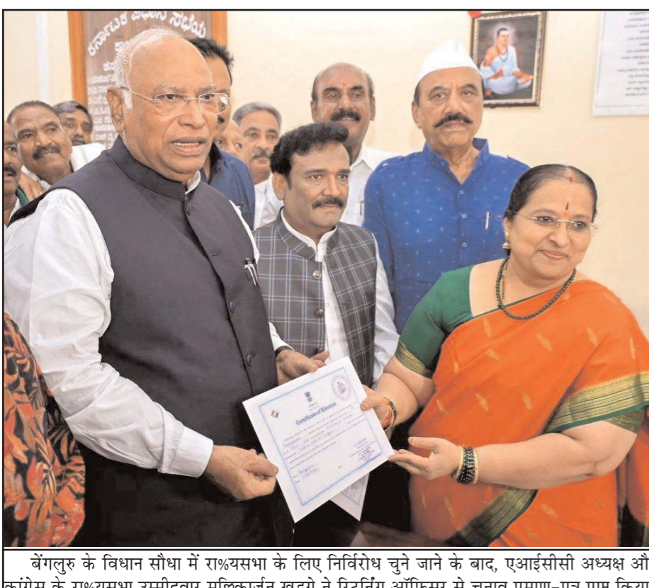
बेंगलुरु के विधान सौधा में रा%यसभा के लिए निर्विरोध चुने जाने के बाद, एआईसीसी अध्यक्ष और कांग्रेस के रा%यसभा उम्मीदवार मल्लिकार्जुन खड्गे ने रिटर्निंग ऑफिसर से चुनाव प्रमाण-पत्र प्राप्त किया।

वैकल्पिक स्रोत के रूप में रूस की तरफ बढ़ने के लिए मजबूर किया। यह फैसला किसी राजनीतिक संदेश के लिए नहीं, बल्कि अपनी परेले जरूरतों को पूरा करने के लिए लिया गया था। अपने संबोधन में डॉ. जयशंकर ने अमेरिका की दोहरी नीति पर भी तीखा कटाक्ष किया। उन्होंने खुलासा किया कि वर्ष 2022 में खुद अमेरिका ने भारत को रूसी तेल खरीदने के लिए पर्दे के पीछे से प्रोत्साहित किया था, ताकि वैश्विक ऊर्जा बाजार में तेल की भारी फिक्कल न हो और अंतरराष्ट्रीय स्तर पर तेल की कीमतें नियंत्रण में रहें। उन्होंने कहा कि यह एक अजीब खेल है जहां एक समय तेल खरीदने का दबाव बनाया जाता है और दूसरे समय उसी नीति को लेकर सवाल खड़े किए जाते हैं। अंतरराष्ट्रीय राजनीति केवल सिद्धांतों या नैतिकता से नहीं, बल्कि व्यावहारिक हितों से चलती है और दुनिया के सभी देश इस सच को अच्छी तरह समझते हैं।