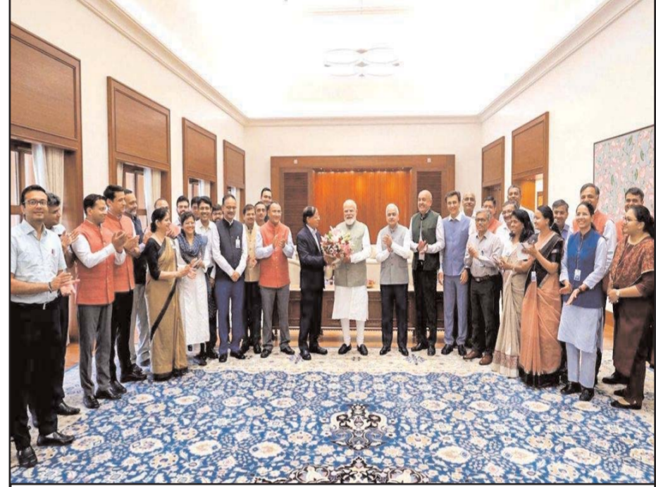
नई दिल्ली में प्रधानमंत्री कार्यालय के अधिकारियों ने प्रधानमंत्री नरेंद्र मोदी को लगातार कार्यकाल में भारत को सबसे लंबे समय तक सेवा करने वाले निर्वाचित प्रधानमंत्री बनने पर बधाई दी।

अमेरिका में किसी भी छोटे-बड़े धार्मिक अनुष्ठान के लिए पंडितों को बहुत अच्छी फीस दी जाती है। अगर कोई भक्त अपने घर में सत्यनारायण भगवान की कथा और पूजा करवाता है, तो इसके लिए आमतौर पर 300 से 350 डॉलर तक का शुल्क लिया जाता है। इसके अलावा कई बार मंदिरों में पूजा करवाने पर 100 से 150 डॉलर का अतिरिक्त मंदिर शुल्क भी देना पड़ता है। वहां रहने वाले भारतीय जब नई कार खरीदते हैं, नया घर लेते हैं या कोई नया व्यवसाय शुरू करते हैं, तो शुभ शुरुआत के लिए पूजा जरूर करवाते हैं। शादी-विवाह, मुंडन और गृह प्रवेश जैसे बड़े आयोजनों में तो पंडितों की फीस सैकड़ों डॉलर के पार चली जाती है। पूजा सामग्री की व्यवस्था भी अतिरिक्त शुल्क देकर पंडितों से कराई जा सकती है। नवरात्र, सावन, जन्माष्टमी, गणेश चतुर्थी, रामनवमी और दीपावली जैसे प्रमुख हिंदू त्योहारों के दौरान अमेरिका में पंडितों की मांग कई गुना बढ़ जाती है।