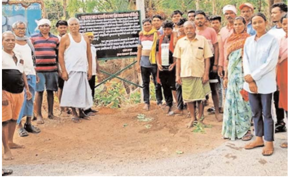
कांकेर (ए)। जिले के भानुप्रतापपुर क्षेत्र अंतर्गत ग्राम ईरागांव में धर्मांतरण गतिविधियों को लेकर आज मंगलवार को एक सूचना बोर्ड