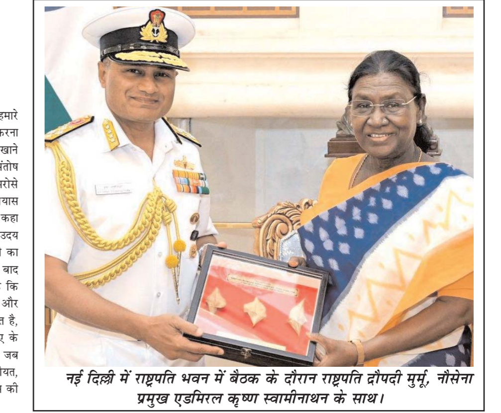
नई दिल्ली में राष्ट्रपति भवन में बैठक के दौरान राष्ट्रपति द्रौपदी मुर्मू, नौसेना प्रमुख एडमिरल कृष्ण स्वामीनाथन के साथ।

में जब एनडीए विजयी हुआ, तब मैंने कहा था कि इससे हमारे देश की जनता में नई उम्मीद जगी है। इस उम्मीद की रक्षा करना हम सभी की बड़ी जिम्मेदारी बन गई। कांग्रेस से धोखा खाने के बाद जनता ने हम पर भरोसा जताया। मुझे गर्व और संतोष है कि एनडीए परिवार के सदस्य के रूप में हमने राष्ट्र के भरोसे को मजबूत करने और उसे कायम रखने के लिए निरंतर प्रयास किए हैं। 2014 में जब एनडीए की जीत हुई थी, तब मैंने कहा था कि आज देश के सामान्य मानवी में एक आशा का उदय हुआ है। इस आशा का, इस उम्मीद का संरक्षण हम सभी का दायित्व था। देश के लोगों ने कांग्रेस के विश्वासघात के बाद अपना भरोसा हमें सौंपा था। आज मुझे संतोष है, गर्व है कि एनडीए परिवार के तौर पर हमने देश के विश्वास को हमेशा और मजबूत किया है। उन्होंने कहा कि विकास तो दूर की बात है, देश को कांग्रेस ने एक के बाद एक हजारों करोड़ों रुपए के घोटालों में घसीट दिया। देश का भाग्य फिर तब बदला जब 2014 में एनडीए की सरकार बनी। देश ने देखा कि जब नीयत, नीति और निर्णय तीनों एक साथ काम करते हैं तो विकास की गति कैसी होती है।