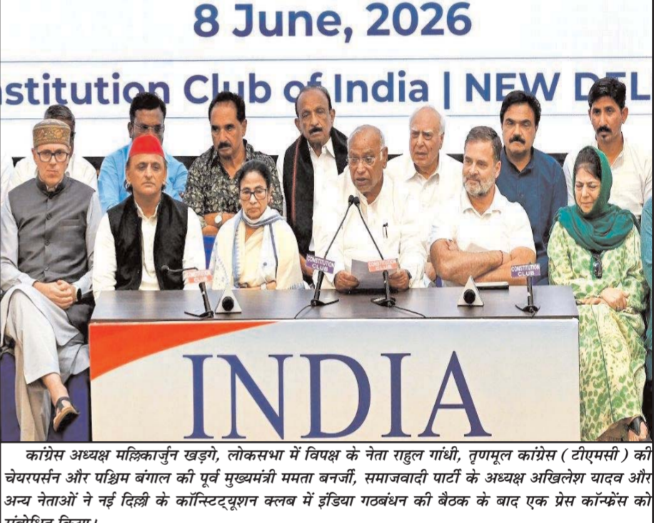
कांग्रेस अध्यक्ष मल्लिकार्जुन खड़गे, लोकसभा में विपक्ष के नेता राहुल गांधी, तुण्णुल कांग्रेस (टीएमपी) की चेयरपर्सन और पश्चिम बंगाल की पूर्व मुख्यमंत्री ममता बनर्जी, समाजवादी पार्टी के अध्यक्ष अखिलेश यादव और अन्य नेताओं ने नई दिल्ली के कॉन्स्टिट्यूशन क्लब में इंडिया गठबंधन की बैठक के बाद एक प्रेस कॉन्फ्रेंस में संबोधित किया।

रक्षा राज्य मंत्री संजय सेठ ने नितिन नवीन के झारखंड दौरे पर प्रतिक्रिया दी। उन्होंने कहा कि प्रदेश की जनता में उत्साह है। दुनिया की सबसे बड़ी पार्टी के राष्ट्रीय अध्यक्ष का आना बड़े ही गर्व की बात होती है। नितिन नवीन से पार्टी कार्यकर्ताओं को मार्गदर्शन मिला है। विकसित भारत 2047 पर हम काम कर रहे हैं। नितिन नवीन का यहां दो दिन का प्रवास था, निश्चित तौर पर पार्टी कार्यकर्ताओं का मनोबल ऊंचा हुआ है। पूर्व केंद्रीय मंत्री अर्जुन मुंडा कहते हैं, भाजपा के राष्ट्रीय अध्यक्ष नितिन नवीन का झारखंड दौरा बहुत उत्साहजनक और प्रेरणादायक रहा है। खासकर युवाओं को इससे काफी प्रेरणा मिली है। मेरा मानना है कि आने वाले समय में युवा झारखंड के भविष्य को बेहतर ढंग से संवारने में असाधारण योगदान देंगे।