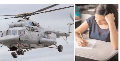
को मिल रहा है।

नई दिल्ली, (आरएनएस)। राष्ट्रीय पात्रता सह-प्रवेश परीक्षा (नीट-यूजी) 2026 की पुनर्परीक्षा के लिए केंद्र सरकार ने बड़ी तैयारी कर ली है। रिपोर्ट के मुताबिक, 21 जून को निर्धारित पुनर्परीक्षा के लिए भारतीय वायुसेना की मदद ली जाएगी। उसके विमान देश भर के 18 स्थानों से परीक्षा पैकेटों का परिवहन करेगी। भारतीय वायुसेना को प्रश्न पत्र के पैकेट ले जाने का काम सौंपा गया है ताकि इसमें किसी भी प्रकार की गड़बड़ी होने से बचा जा सके। राष्ट्रीय टेस्टिंग एजेंसी (एनटीए) ने कहा कि परीक्षा का आयोजन भारत के 551 शहरों में और विदेश के 14 शहरों में आयोजित किया जाएगा। परीक्षा दोपहर 2 बजे से शाम 5:15 बजे तक पेपर और पेन के जरिए होगी। रविवार को एजेंसी ने परीक्षा में शामिल होने वाले छात्रों की परीक्षा शहर सूची जारी कर दी। प्रवेश-पत्र 14 जून से जारी होंगे। एजेंसी ने कहा कि उसने उम्मीदवारों को उनके पसंदीदा परीक्षा केंद्र आवंटित करने का प्रयास किया है। नीट-यूजी परीक्षा 3 मई को 22 लाख से अधिक छात्रों के लिए आयोजित हुई थी। इसके बाद पेपर लीक की खबर सामने आने पर एनटीए ने 12 मई को परीक्षा रद्द कर दी। मामले की जांच केंद्रीय जांच ब्यूरो (सीबीआई) को सौंपी गई, जिसने देश भर के अलग-अलग शहरों से कई लोगों को गिरफ्तार किया है। इसमें कोचिंग संचालक और प्रोफेसर भी शामिल हैं। इसमें कोचिंग संचालक और प्रोफेसर भी शामिल हैं। पेपर लीक को लेकर पूरे देश में विरोध-प्रदर्शन देखने