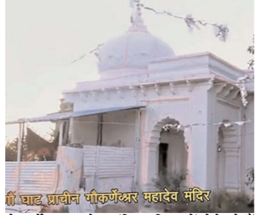
गोकर्णेश्वर महादेव मंदिर परिसर में होते रहे हैं