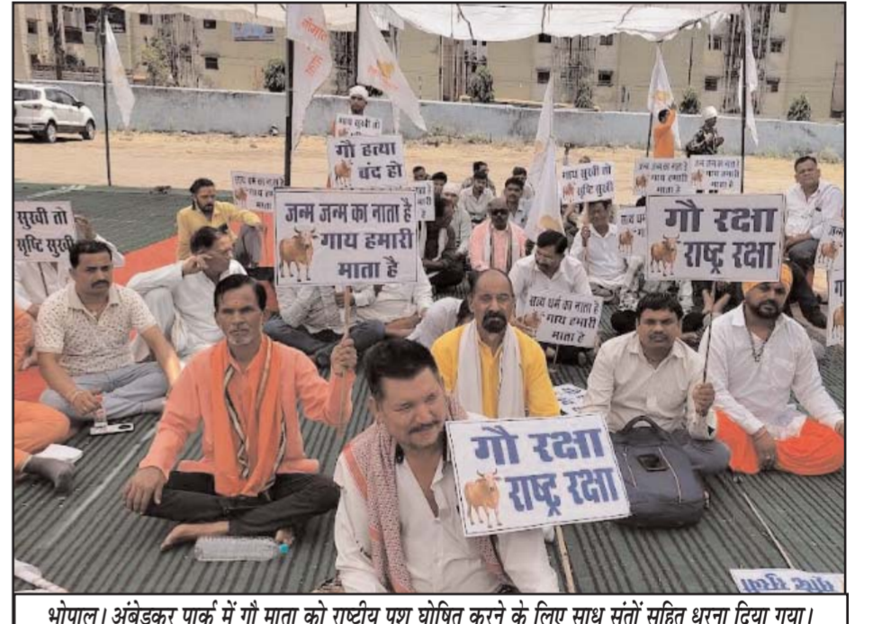
भोपाल। अंबेडकर पार्क में गौ माता को राष्ट्रीय पशु घोषित करने के लिए सधु संतो सहित धरना दिया गया।