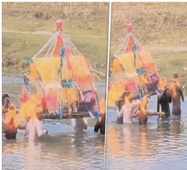
कटिहार (आरएनएस)। बिहार में बढ़े-बढ़े विकास और सुशासन के दावों की पोल खोलती हुई एक ऐसी शर्मनाक और विचलित कर देने वाली तस्वीर सामने आई है, जिसे देखकर किसी का भी कलेजा कांप उठे। जिले के फलका प्रखंड अंतर्गत मोरसंडा गांव में एक शख्स की मौत के बाद