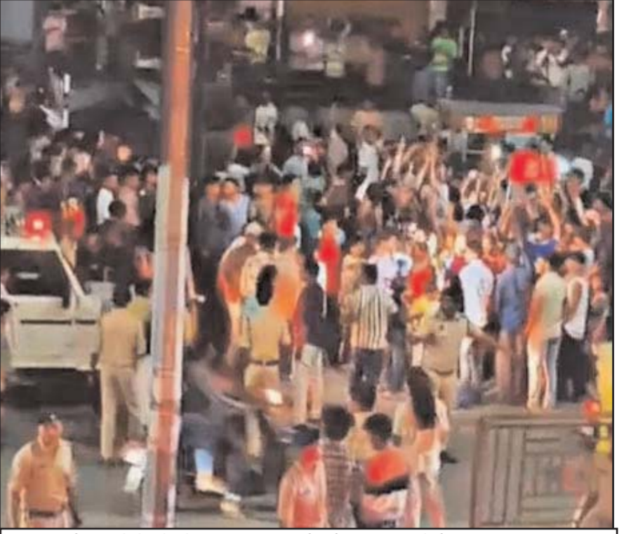
रायपुर में आरसीबी की जीत का जश्न, पटाखों और आतिशबाजी से गूज उठा शहर।