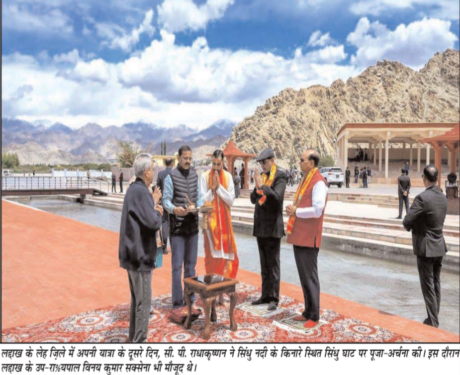
लहाख के लेह जिले में अपनी यात्रा के दूसरे दिन, सी. पी. राधाकृष्णन ने सिंधु नदी के किनारे स्थित सिंधु घाट पर पूजा-अर्चना की। इस दौरान लहाख के उप-राज्यपाल विनय कुमार सक्सेना भी मौजूद थे।

मुख्यमंत्री श्रीमती रेखा गुप्ता ने इस भारी जनभागीदारी पर संतोष व्यक्त करते हुए कहा कि जन कल्याण शिविरों पर संतोष व्यक्त करते हुए कहा कि जन कल्याण शिविरों