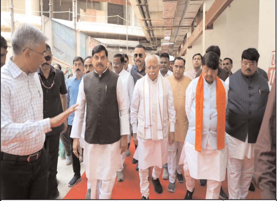
मुख्यमंत्री डॉ. मोहन यादव एवं केंद्रीय आवासन एवं शहरी कार्य मंत्री मनोहर लाल ने उज्जैन के निर्माणाधीन पीएम एकटा मॉल का निरीक्षण किया।