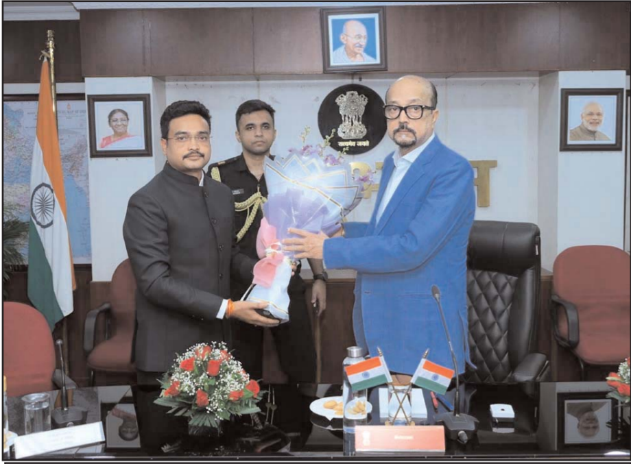
पर्यावरण संरक्षण और जलवायु परिवर्तन जैसी वैश्विक चुनौतियों से निपटने में वन अधिकारियों की महत्वपूर्ण भूमिका-राज्यपाल रमन डेका।