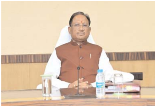
फेन कॉल से सीखेंगे गणित, मुख्यमंत्री ने छात्रा से पूछा- क्या सीखा? जवाब मिला- अब 20 तक पढ़ाई याद है