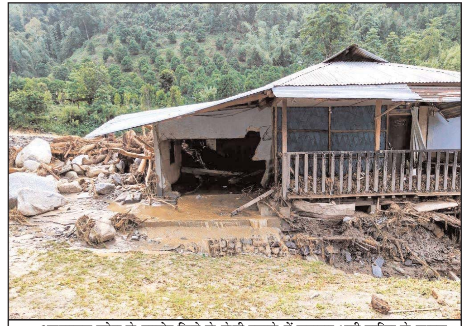
अरुणाचल प्रदेश के पान्योर जिले के केयी इलाके में लगातार भारी बारिश के कारण अचानक आई बाढ़ से एक घर क्षतिग्रस्त हो गया।

नई दिल्ली (आरएनएस)। भारतीय राष्ट्रीय कांग्रेस ने गुरुवार को राष्ट्रव्यापी छात्रों की गुंज नामक अभियान का शुभारंभ किया। यह 40 दिनों का अभियान देश के 28 प्रमुख शहरों में छात्रों, अभ्यर्थियों, कोचिंग हब, कॉलेज कैंपस, पुस्तकालयों और युवा समूहों के बीच चलाया जाएगा। यह अभियान उन छात्रों और नौकरी अभ्यर्थियों की आवाज है, जिनकी मेहनत पेपर लीक, परीक्षा रद्द होने, रिजल्ट में देरी, भर्ती अटकने और एनटीए की नाकामी के कारण बर्बाद हो रही है। छात्र निष्पक्ष परीक्षा की मांग कर रहे हैं। इस मौके पर दिल्ली में कांग्रेस सांसद एवं लोकसभा में उपनेता गौरव गोगोई ने कांस्टीट्यूशन क्लब में प्रेस वार्ता की।