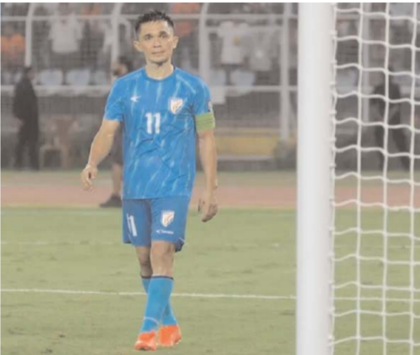
को मिलेगा छेत्री ने कहा, मुझे नहीं लगता कि पीढ़ियों के बीच कोई मुकाबला है। मेसी और रोनाल्डो ने अपनी अलग पहचान बनाई है, जबकि एम्बापे, हॉलैंड और दूसरे अपनी अलग कहानी बनाएंगे। बस आप उन्हें

ने साल 2021 (टोक्यो ओलंपिक 2020) में 41 साल का सूखा खत्म करते हुए ओलंपिक पदक जीता। मनप्रीत का जन्म 26 जून, 1992 को पंजाब के जालंधर के पास मौजूद मीठापुर गांव में हुआ। मनप्रीत के बड़े भाई हॉकी खिलाड़ी थे, तो शुरुआत से ही उनका मन इस खेल में रम गया। हालांकि, मनप्रीत की मां नहीं चाहती थीं कि वह इस खेल में अपनी पहचान बनाए। मनप्रीत की मां हॉकी को एक खतरनाक खेल मानती थीं। हालांकि, अपने जिद, लगन और कड़ी मेहनत के दम पर मनप्रीत परिवार का विश्वास भी जीतने में सफल रहे। इसके बाद उनका दाखिला जालंधर परिवार ने सुरजीत हॉकी अकादमी में कराया और इसके बाद मनप्रीत ने पीछे मुड़कर नहीं देखा। थरेलू स्तर पर अपने प्रदर्शन से धूम मचाने के बाद मनप्रीत ने टीम इंडिया की जर्सी में भी खूब नाम कमाया। साल 2014 में एशियाई खेलों में भारतीय टीम को स्वर्ण पदक दिलाने में मनप्रीत का अहम रोल रहा। इसके अलावा 2017 में हुए एशिया कप में भी उनका प्रदर्शन दमदार रहा। 2023 और 2024 में हुए एशियन चैंपियंस ट्रॉफी में भी मनप्रीत ने अपने दमदार खेल के बूते भारतीय टीम को शानदार जीत दिलाई।