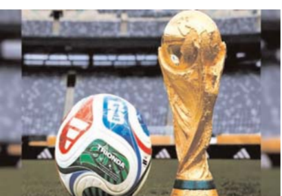
सका। दूसरे हाफ में इंग्लैंड की ओर से एंटनी गॉर्डन, केन और बुकायो साका ने टारगेट पर 3 शॉट लगाए। सब्स्टीट्यूट के तौर पर मैदान पर आए आर्सेनल के साका के शॉट को घाना के गोलकीपर ने बचाव किया। वहीं, निको ओराइली का हेडर गोलपोस्ट से टकराया और रिवाउंड पर केन ने गेंद को बहुत ऊपर मार दिया। दूसरे हाफ में दोनों टीमों ने प्रयास किए,