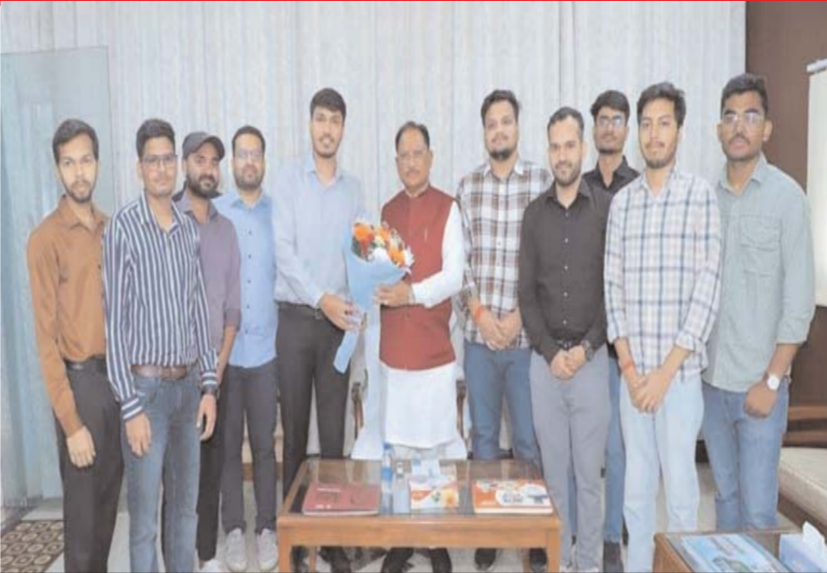
मुख्यमंत्री विष्णुदेव साय ने यूपीएससी प्रारंभिक परीक्षा में सफल ट्राइबल यूथ इंस्टल के विद्यार्थियों से की मुलाकात।

मुख्यमंत्री ने केंद्रीय मंत्री को बताया कि राज्य सरकार प्रदेश में स्वास्थ्य सुविधाओं को मजबूत बनाने के लिए लगातार प्रयास कर रही है। विशेष रूप से दूरस्थ, ग्रामीण और जनजातीय क्षेत्रों तक गुणवत्तापूर्ण स्वास्थ्य सेवाएं पहुंचाने के उद्देश्य से अस्पतालों, मेडिकल कॉलेजों और अन्य चिकित्सा संस्थानों का विस्तार एवं उन्नयन किया जा रहा है। उन्होंने कहा कि सरकार का लक्ष्य है कि प्रदेशवासियों को आधुनिक और बेहतर उपचार सुविधाएं राज्य के भीतर ही उपलब्ध हों। बैठक के दौरान खरीफसीजन को देखते हुए किसानों के लिए खाद और बीज की उपलब्धता पर भी चर्चा हुई। मुख्यमंत्री ने बताया कि राज्य सरकार ने अधिकारियों को निर्देश दिए हैं कि किसानों को समय पर पर्याप्त मात्रा में खाद एवं बीज उपलब्ध कराया जाए और वितरण व्यवस्था पर लगातार निगरानी रखी जाए। उन्होंने स्पष्ट किया कि खाद की कालाबाजारी, जमाखोरी और वितरण में किसी भी प्रकार की लापरवाही को बर्दाश्त नहीं किया जाएगा। साथ ही किसानों को आधुनिक कृषि तकनीकों से जोड़ने और उन्नत खेती के लिए प्रेरित करने हेतु गांव-गांव जागरूकता अभियान चलाए जा रहे हैं।