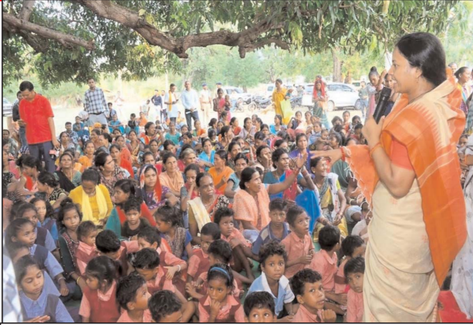
नवविकास की राह पर अग्रसर बस्तर : जगरगुण्डा पहुंचने वाली पहली महिला मंत्री बनी लक्ष्मी राजवाड़े।

वरिष्ठ अधिकारी मौजूद रहे। अधिकारियों ने परियोजना की प्रगति का जायजा लिया और शेष कार्यों की समीक्षा की। पत्रकारों से चर्चा करते हुए महाप्रबंधक तरुण प्रकाश ने बताया कि रावघाट रेल परियोजना का अधिकांश निर्माण कार्य पूरा हो चुका है। केवल कुछ तकनीकी और अधोसंरचनात्मक कार्य शेष हैं, जिन्हें शीघ्र पूरा कर लिया जाएगा। इसके बाद रावघाट तक नियमित रेल संचालन शुरू कर दिया जाएगा, जिससे क्षेत्र के लोगों को बेहतर यातायात सुविधा मिलेगी। उन्होंने यह भी कहा कि रावघाट के बाद जगदलपुर तक रेल लाइन विस्तार की प्रक्रिया भी चरणबद्ध तरीके से आगे बढ़ाई जाएगी। इस परियोजना को लेकर रेल मंत्रालय गंभीरता से कार्य कर रहा है और इसे प्राथमिकता के आधार पर आगे बढ़ाया जा रहा है।