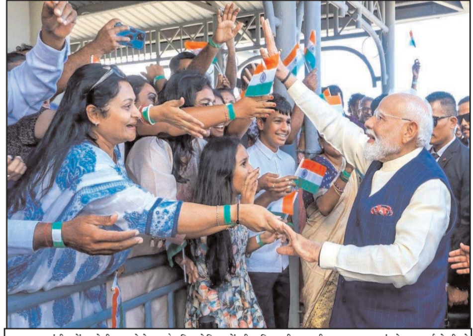
प्रधानमंत्री नरेन्द्र मोदी का सेशेल्स के विकटोरिया में तीन दिन की राजकीय यात्रा पर पहुंचने पर गर्मजोशी से स्वागत किया गया। वे वहां देश के गोल्डन जुबली नेशनल डे समारोह में गेस्ट ऑफ ऑनर के तौर पर शामिल होने पहुंचे हैं।

भाग्यराज ने 25 से अधिक फिल्मों का सफल निर्देशन किया और 75 से ज्यादा फिल्मों में अपनी अदाकारी का जादू बिखेरा।