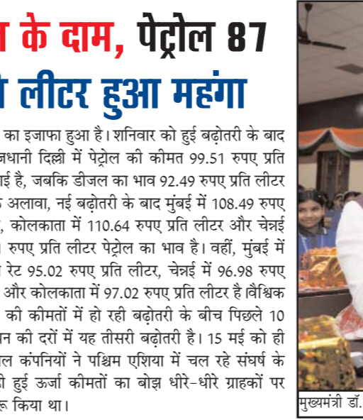
मुख्यमंत्री डॉ. मोहन यादव ने सिंगरौली के उमंग भवन में बालिका सशक्तिकरण अभियान अंतर्गत बालिकाओं से संवाद किया।

प्रति लीटर का इजाफा हुआ है। शनिवार को हुई बढ़ोतरी के बाद राष्ट्रीय राजधानी दिल्ली में पेट्रोल की कीमत 99.51 रुपये प्रति लीटर हो गई है, जबकि डीजल का भाव 92.49 रुपये प्रति लीटर है। दिल्ली के अलावा, नई बढ़ोतरी के बाद मुंबई में 108.49 रुपये प्रति लीटर, कोलकाता में 110.64 रुपये प्रति लीटर और चेन्नई में 105.31 रुपये प्रति लीटर पेट्रोल का भाव है। वहीं, मुंबई में डीजल का रेट 95.02 रुपये प्रति लीटर, चेन्नई में 96.98 रुपये प्रति लीटर और कोलकाता में 97.02 रुपये प्रति लीटर है। वैश्विक कच्चे तेल की कीमतों में हो रही बढ़ोतरी के बीच पिछले 10 दिन में इंधन की दरों में यह तीसरी बढ़ोतरी है। 15 मई को ही सरकारी तेल कंपनियों ने पश्चिम एशिया में चल रहे संघर्ष के कारण बढ़ी हुई ऊर्जा कीमतों का बोझ धीरे-धीरे ग्राहकों पर डालना शुरू किया था।