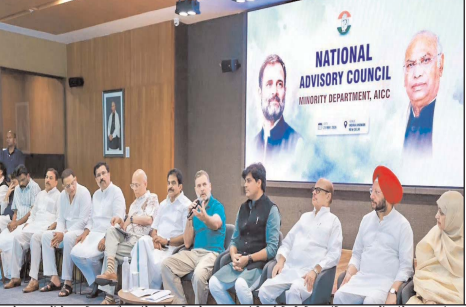
लोकसभा में नेता प्रतिपक्ष और कांग्रेस के वरिष्ठ नेता राहुल गांधी नई दिल्ली स्थित इंदिरा भवन में कांग्रेस अल्पसंख्यक विभाग की राष्ट्रीय सलाहकार परिषद को संबोधित करते हुए। साथ में कांग्रेस महासचिव (संगठन) के.सी. वेणुगोपाल और कांग्रेस अल्पसंख्यक विभाग के राष्ट्रीय अध्यक्ष इमरान प्रतापगढ़ी भी इस अवसर पर उपस्थित हैं।

प्रधानमंत्री मोदी ने कहा कि आज हर भारतीय एक बड़े संकल्प के साथ आगे बढ़ रहा है। ये संकल्प, 2047 तक विकसित भारत के निर्माण का है। इस लक्ष्य की प्रति के लिए आज देश अलग-अलग क्षेत्र में निवेश कर रहा है और इस निवेश से देश के युवाओं के लिए रोजगार के लाखों नए अवसर बन रहे हैं।