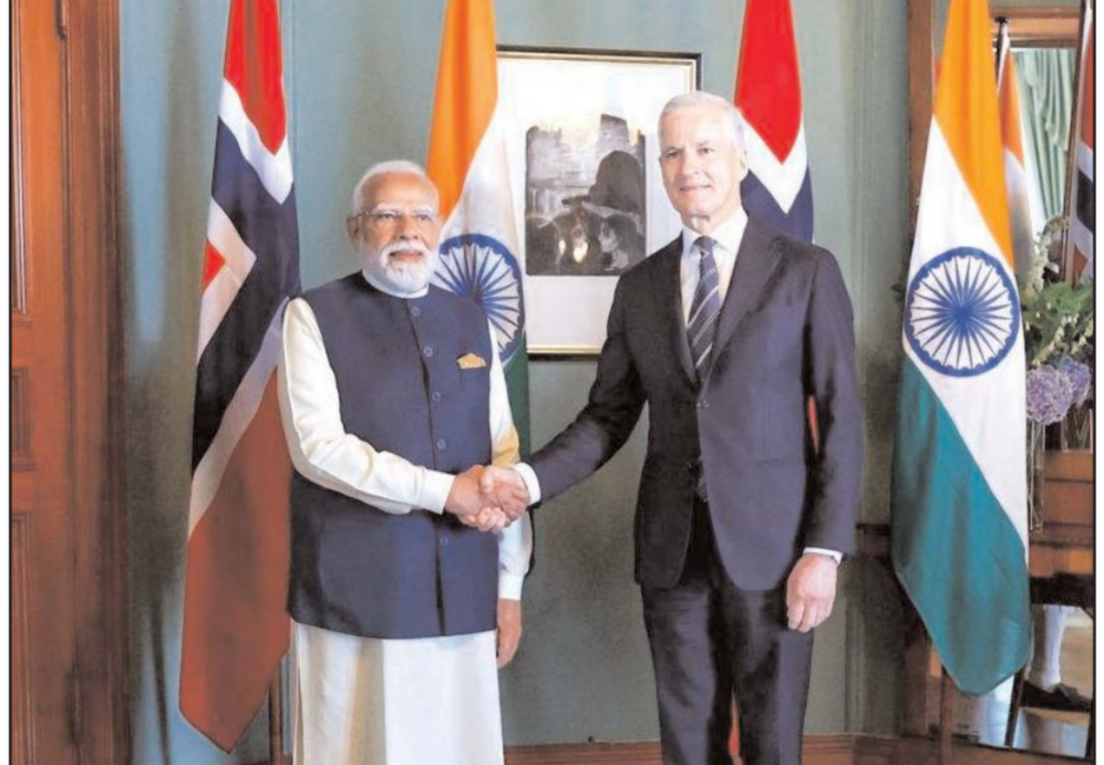
प्रधानमंत्री नरेंद्र मोदी ने नॉर्वे के ओस्तो में नॉर्वे के प्रधानमंत्री जोनास गहर स्त्रे से मुलाकात की।

लखनऊ, (आरएनएस)। उत्तर प्रदेश में योगी आदित्यनाथ मंत्रिमंडल विस्तार और नये आठ मंत्रियों को विभाग आवंटन के बाद बाय आयोजित यूपी कैबिनेट में सोमवार को 12 प्रस्तावों को मंजूरी प्रदान की गई। मुख्यमंत्री योगी आदित्यनाथ के सरकारी आवास पर आयोजित कैबिनेट की बैठक में 12 प्रस्ताव रखे गए थे और सभी को हरी झंडी दे दी गई। योगी आदित्यनाथ कैबिनेट के फैसलों से यह तो तय है कि सरकार चुनावी दौर और विकास दोनों को साधने की तैयारी में है। यूपी कैबिनेट की बैठक में बड़ा प्रस्ताव पिछड़ा वर्ग आयोग के गठन का था, जिसको भी मंजूरी प्रदान की गई। योगी आदित्यनाथ की अध्यक्षता में यूपी कैबिनेट की बैठक में ओबीसी आरक्षण के लिए पिछड़ा वर्ग आयोग बनाने का फैसला लिया गया। इसके साथ लोकतंत्र सेनानियों के लिए कैशलेस इलाज समेत 12 प्रस्तावों को स्वीकृति दी गई है। कैबिनेट ने ओबीसी आरक्षण के लिए समर्पित पिछड़ा वर्ग आयोग बनाने और लखनऊ और आगरा मेट्रो विस्तार के लिए भूमि आवंटन के एमओयू को मंजूरी दी है।