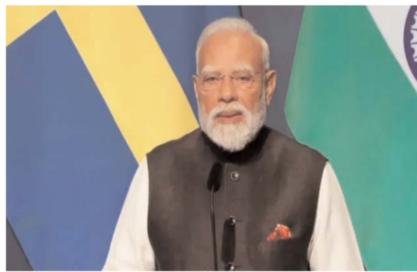
अवसर सृजित करेगी।

प्रधानमंत्री मोदी ने भारत-यूरोपीय संघ संबंधों में हो रही प्रगति का स्वागत किया, जिसमें ऐतिहासिक भारत-ईयू मुक्त व्यापार समझौते (एफटीए) की वार्ताओं का सफल समापन भी शामिल है। उन्होंने इस समझौते को एक परिवर्तनकारी आर्थिक साझेदारी बताया, जो व्यापार, प्रौद्योगिकी, विनिर्माण, सेवाओं तथा सुदृढ़ आपूर्ति श्रृंखलाओं में नए