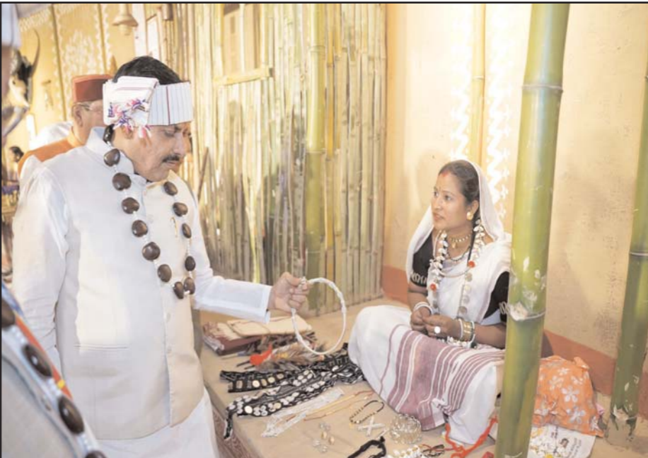
मुख्यमंत्री डॉ. मोहन यादव ने मध्य क्षेत्रीय परिषद बैठक स्थल जगदलपुर में लोक कलाकारों द्वारा आयोजित पारंपरिक लोककशिल्यों की लघु प्रदर्शनी का अवलोकन किया।

भोपाल (आरएनएस)। मुख्यमंत्री डॉ. मोहन यादव ने उत्तरप्रदेश के लखीमपुर खीरी में हुई सड़क दुर्घटना पर दुःख व्यक्त किया है। मुख्यमंत्री डॉ. यादव ने दिवंगत आत्मा को शांति देने और घायलों को शीघ्र स्वास्थ्य लाभ प्रदान करने की प्रार्थना की है। मुख्यमंत्री डॉ. यादव ने शोकाकुल परिवार के प्रति संवेदनाएं व्यक्त की हैं।