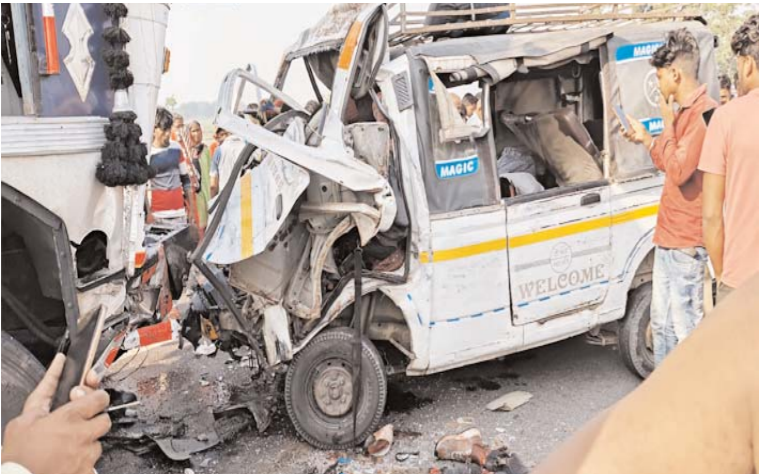
लखीमपुर-खीरी, (ए.) लखीमपुर-खीरी लोगों की मौके पर ही मौत हो गई, जबकि के ईशानगर थाना क्षेत्र के उंचा गांव के पास एक की मौत अस्पताल ले जाते समय हुई। इस सोमवार सुबह एक भीषण सड़क हादसे में 09 हादसे में तीन लोग गंभीर रूप से घायल हुए

हैं, जिन्हें अस्पताल में भर्ती कराया गया है, खेतों में काम कर रहे लोग और ग्रामीण मदद जहां उनकी हालत नाजुक बनी हुई है। लोगों के मुताबिक सोमवार सुबह सवारियों से भरी एक मैजिक गाड़ी लखीमपुर से सिसैया जा रही निकालने की कोशिश शुरू की, लेकिन तब थी। गाड़ी उंचा गांव के पास पहुंची ही थी कि तब आठ लोग दम तोड़ चुके थे। सूचना बहरादूच की ओर से आ रहे तेज रफ्तार ट्रक मिलते ही ईशानगर थाने की पुलिस बल मौके ने जोरदार टक्कर मार दी। टक्कर इतनी पर पहुंचा और राहत-बचाव कार्य शुरू किया। जबरदस्त थी कि मैजिक गाड़ी के परखच्चे पुलिस ट्रक को कब्जे में लेकर आगे की उड़ गए। जानकारी के मुताबिक हादसा होते ही कार्रवाई कर रही है। इस हादसे के बाद मृतकों मौके पर चीख-पुकार मच गई। आस-पास के परिवारों में कोहराम मच गया।