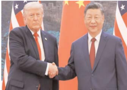
वाशिंगटन, (आरएनएस)। अमेरिकी राष्ट्रपति

डोनाल्ड ट्रंप के मुताबिक अमेरिका और चीन इस बात पर सहमत हो गए हैं कि ईरान के पास परमाणु हथियार नहीं हो सकते और होर्मुज स्ट्रेट को खोला जाना चाहिए। राष्ट्रपति ट्रंप ने चीन के अपने तीन दिन के सरकारी दौरे के दौरान अपने चीनी समकक्ष शी जिनपिंग से मुलाकात की, जहां उन्होंने चल रहे पश्चिम एशिया विवाद और दूसरे क्षेत्रीय मुद्दों पर चर्चा की। चीन से निकलने के बाद एयर फ़ोर्स वन में रिपोर्टों से बात करते हुए, ट्रंप ने कहा कि अमेरिका, होर्मुज स्ट्रेट को कंट्रोल करता है, साथ ही इस बात पर जोर दिया कि इस इलाके में अमेरिका की नौसेना नाकाबंदी की वजह से पिछले ढाई हफ्तों में ईरान को हर दिन