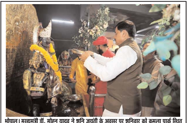
भोपाल। मुख्यमंत्री डॉ. मोहन यादव ने शनि जयंती के अवसर पर शनिवार को कमला पार्वी शिव शक्ति मंदिर में पूजा अर्चना की और मंदिर में आने अनेक रक्षणाधियों से भी भेंट की।

नई दिल्ली (आरएनएस)। भारत के चीफ जस्टिस सूर्यकांत ने शनिवार को अपनी परजीवी वाली टिप्पणी पर कड़े शब्दों में सफाई देते हुए कहा कि उन्हें उन मीडिया रिपोर्टों से दुख हुआ, जिनमें कहा गया था कि उन्होंने युवाओं की आलोचना की है। सीजेआई ने एक बयान में कहा, मुझे यह पढ़कर दुख हुआ कि मीडिया के एक हिस्से ने कल एक बेकार केस की सुनवाई के दौरान कही गई मेरी बातों को कैसे गलत तरीके से पेश किया। सीजेआई सूर्यकांत ने जोर देकर कहा कि उनकी बातें खास तौर पर नकली और बोझाल डिब्बों के जरिए लीगल प्रोफेशन में आने वाले लोगों के लिए थीं और मीडिया के एक हिस्से ने उन्हें गलत तरीके से पेश किया।