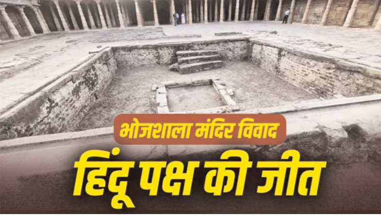
भोजशाला मंदिर विवाद

-अदालत ने हिंदू पक्ष के पूजा के अधिकार को बरकरार रखा -केंद्र सरकार वाग्देवी प्रतिमा को ब्रिटेन से वापस लेकर आए