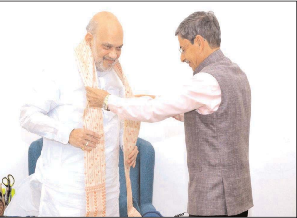
नई दिल्ली में पश्चिम बंगाल के राज्यपाल आर.एन. रवि द्वारा केंद्रीय गृह मंत्री और सहकारिता मंत्री अमित शाह का अभिनंदन किया गया।

अहमदाबाद, (आरएनएस)। देशभर में नीट यूजी परीक्षा के पेपर लीक को लेकर छात्रों का गुस्सा अब सड़कों पर उग्र रूप लेने लगा है। देश के शिक्षा मंत्री धर्मेंद्र प्रधान को इसी भारी आक्रोश के चलते गुजरात की राजधानी अहमदाबाद में बड़े विरोध का सामना करना पड़ा। कांग्रेस के छात्र संगठन हस्तु के कार्यकर्ताओं ने शिक्षा मंत्री के काफिले को बीच सड़क पर रोक लिया और उन्हें काले झंडे दिखाए। इस भारी हंगामे और नारेबाजी के बाद मौके पर मौजूद पुलिस को कड़ा मोर्चा सभालना पड़ा और प्रदर्शन कर रहे कई कार्यकर्ताओं को तुरंत हिरासत में ले लिया गया। IIM से निकलते ही सड़क पर उतरे छात्र यह पूरा बवाल उस वक हुआ जब शिक्षा मंत्री धर्मेंद्र प्रधान अहमदाबाद स्थित भारतीय प्रबंधन संस्थान (IIM) में एक कार्यक्रम में शिरकत करने के बाद अपनी गाड़ी से गांधीनगर की ओर जा रहे थे। इसी दौरान पहले से विरोध की तैयारी में जुटे NSUI के कार्यकर्ताओं ने उनके काफिले को घेर लिया। काले झंडे दिखाते हुए छात्रों ने सीधा आरोप लगाया कि 22 लाख से अधिक परीक्षार्थियों के भविष्य के साथ जो भद्रा मजाक हुआ है, उसके लिए सीधे तौर पर शिक्षा मंत्री और सरकार की लापरवाही जिम्मेदार है। 12 से 5 लाख में बिका था पेपर, टेलीग्राफ पर वायरल थे 410 सवालगीरतलब है कि 3 मई 2026 को आयोजित हुई NEET UG परीक्षा में करीब 22.8 लाख छात्रों ने हिस्सा लिया था, लेकिन पेपर लीक के पुख्ता सबूत मिलने के बाद 12 मई को नेशनल टेस्टिंग एजेंसी (NTA) ने मजबूर होकर पूरी परीक्षा ही रद्द कर दी।