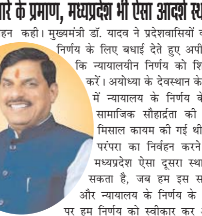
मुख्यमंत्री डॉ. यादव ने न्यायालय के निर्णय का स्वागत करते हुए कहा कि ऐसे स्थान के गौरव को पुनः स्थापित करने के उद्देश्य से भाईचारे का परिचय देते हुए इसे स्थायी समाधान विधिसम्मत तरीके से विदेश से वाग्देवी की प्रतिमा बनाएं। मुख्यमंत्री डॉ. यादव ने भविष्य में ऐसे स्थान को अधिक गौरवमयी बनाने के प्रयास भी किए जाएंगे।

भोपाल (आरएनएस)। मुख्यमंत्री डॉ. मोहन कही। मुख्यमंत्री डॉ. यादव ने प्रदेशवासियों को इस यादव ने धार जिले की भोजशाला के संबंध में बरसों पुराने प्रकरण में न्यायालय द्वारा दिए गए निर्णय पर प्रसन्नता व्यक्त की है। मुख्यमंत्री डॉ. यादव ने कहा कि भोजशाला के संबंध में न्यायालय ने माना है कि यह स्थान भोजशाला का ही था, जहां राजा भोज ने मां वाग्देवी के माध्यम से इस स्थान की महत्ता को स्थापित किया था। मुख्यमंत्री डॉ. यादव ने न्यायालय के निर्णय का स्वागत करते हुए कहा कि ऐसे स्थान के गौरव को पुनः स्थापित करने के उद्देश्य से भाईचारे का परिचय देते हुए इसे स्थायी समाधान विधिसम्मत तरीके से विदेश से वाग्देवी की प्रतिमा बनाएं। मुख्यमंत्री डॉ. यादव ने भविष्य में ऐसे स्थान को अधिक गौरवमयी बनाने के प्रयास भी किए जाएंगे।