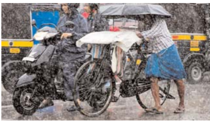
आईएमडी ने बताया कि 2005 से 2025 के बीच पिछले 21 सालों में केरलम में मानसून की तारीख के बारे में आईएमडी के अनुमान सही

नई दिल्ली, (आरएनएस)। भारतीय मौसम विभाग (आईएमडी) ने उमस भरी गर्मी से जूझ रहे केरलम समेत दक्षिण भारत के राज्यों को शुक्रवार को राहत भरी खबर सुनाई है। विभाग ने बताया कि इस साल केरलम में दक्षिणी-पश्चिमी मानसून समय से 6 दिन पहले 26 मई को पहुंच सकता है। आईएमडी के मुताबिक, अनुमानित तिथि 26 मई है, लेकिन यह 4 दिन आगे-पीछे होकर 22 से 30 मई के बीच आ सकता है। केरलम में आमतौर पर मानसून 1 जून को आता है।