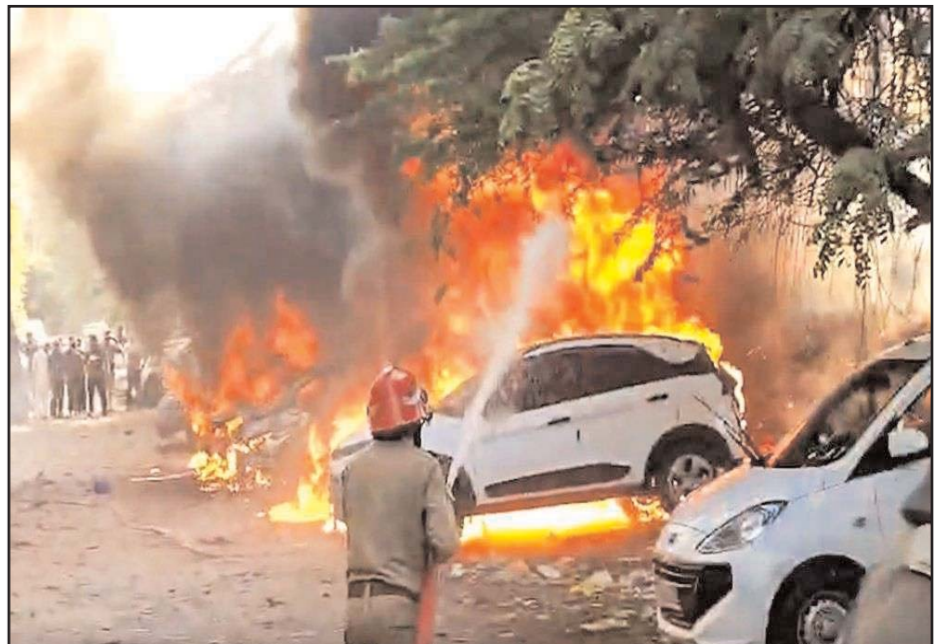
नई दिल्ली के शाहदरा स्थित बिहारी कॉलोनी के एक पार्किंग क्षेत्र में भीषण आग लगने के बाद कई वाहन लपटों की चपेट में आ गए; इस दौरान कई सिलेंडर फटने की भी खबरें हैं।

नई दिल्ली (आरएनएस)। रूस के विदेश मंत्री सर्गेई लावरोव ब्रिक्स सम्मेलन में भाग लेने के भारत में हैं। इसी क्रम में शुक्रवार को उन्होंने मीडिया से बात की। इस दौरान उन्होंने कहा कि ईरान और अमेरिका के बीच बढ़ते तनाव के कम करने में भारत महत्वपूर्ण भूमिका निभा सकता है। उन्होंने कहा कि भारत के पास मजबूत कूटनीतिक अनुभव है और दुनिया में उसकी अच्छी छवि है, इस वजह से वह लंबे समय तक शांति बनाए रखने में मदद कर सकता है। लावरोव ने कहा कि फिलहाल पाकिस्तान अमेरिका और ईरान के बीच बातचीत शुरू कराने में मदद कर रहा है, ताकि तुरंत पैदा हुए संकट को कम किया जा सके।