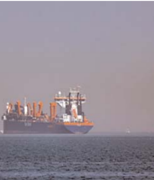
ओमान में सुरक्षित देखे गए। सबसे चौंकाने वाली बात यह रही कि इन जहाजों ने किसी जासूसी फिल्म की तरह अपनी लोकेशन बताने वाले 'ट्रांसपॉंडर' को पूरी तरह बंद कर दिया था। होर्मुज स्ट्रेट जैसे संवेदनशील

नई दिल्ली, (आरएनएस)। लुधियाना ने शुक्रवार को अपने विमानन और बुनियादी ढांचे के सफर में एक महत्वपूर्ण उपलब्धि हासिल की, जब नवीनिर्मित हलतारा हवाई अड्डे पर पहली उड़ान उतरी। यह क्षेत्र की लंबे समय से लंबित मांग थी, जिसका उद्देश्य पंजाब में व्यापार, संपर्क और औद्योगिक विकास को बढ़ावा देना है। केंद्रीय रेल और खाद्य प्रसंस्करण उद्योग मंत्री रवनीत सिंह बिट्टू ने सोशल मीडिया प्लेटफॉर्म एक्स पर एक पोस्ट साझा करते हुए इसे लुधियाना और पंजाब की अर्थव्यवस्था के लिए एक ऐतिहासिक क्षण बताया। मंत्री रवनीत सिंह बिट्टू ने एक्स पर लिखा, लुधियाना ने उड़ान भरी! आज एक ऐतिहासिक उपलब्धि हासिल हुई, जब हमने सांसद विक्रमजीत साहनी और सांसद राजिंदर गुप्ता के साथ हलतारा हवाई अड्डे के लिए पहली उड़ान में सफर किया। उन्होंने आगे कहा, 30 साल पुरानी मांग को पूरा करते हुए इस परियोजना की शुरुआत से हमारे स्थानीय उद्योग और आर्थिक विकास को जरूरतपूर्वक बढ़ावा मिलेगा। पंजाब को दिए गए इस दूरदर्शी उपहार के लिए प्रधानमंत्री नरेंद्र मोदी जी का बहुत-बहुत धन्यवाद। लुधियाना के व्यापार और निर्यात की संभावनाएं असीमित हैं।