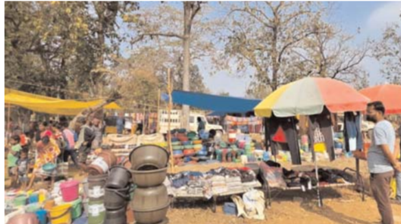
महुआ, टोरा, चिरौजी, तेंदू जैसी बहुमूल्य वनोपज यहाँ के लोगों की आय का प्रमुख स्रोत हैं। ग्रामीण इन उत्पादों का संग्रहण कर साप्ताहिक बाजारों में विक्रय करते हैं तथा बदले में दैनिक जरूरत की वस्तुएँ खरीदते हैं।

कभी माओवाद के आतंक और भय के कारण वीरान पड़े बीजापुर जिले के सुदूर वनांचल अब विकास, विश्वास और नई उम्मीदों की मिसाल बनते जा रहे हैं। नक्सलवाद से मुक्ति के बाद जिले के अंदरूनी क्षेत्रों में सामान्य जनजीवन तेजी से पटरी पर लौट रहा है। इसका सबसे जीवंत उदाहरण उसर ब्लॉक के आवापल्ली क्षेत्र अंतर्गत पुजारी कांकेर और कोण्डापल्ली के साप्ताहिक बाजार हैं, जहाँ लगभग चार दशकों बाद फिर से रौनक लौट आई है। एक समय ऐसा था जब इन क्षेत्रों में भय और असुरक्षा के कारण ग्रामीणों की आवाजाही लगभग बंद हो चुकी थी। माओवाद के प्रभाव के चलते यहाँ के पारंपरिक साप्ताहिक बाजार पूरी तरह टप पड़ गए थे। लेकिन अब नक्सल मुक्त वातावरण बनने के बाद बाजारों में फिर से चहल-पहल दिखाई देने लगी है। ग्रामीण, व्यापारी और आदिवासी बड़ी संख्या में यहाँ पहुँच रहे हैं, जिससे क्षेत्र की आर्थिक गतिविधियों को नई गति मिली है।