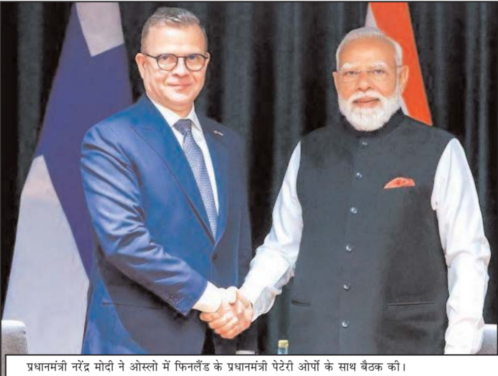
प्रधानमंत्री नरेंद्र मोदी ने ओस्टो में फिनलैंड के प्रधानमंत्री पेतेरी ओपो के साथ बैठक की।

और परिचालन संबंधी चुनौतियों का सामना करना पड़ा है। हालांकि रेलवे ने समय-समय पर क्रियान्वयन और मजबूत बुनियादी ढांचा विकास के माध्यम से इन चुनौतियों पर लगातार काबू पाया है। मौजूदा बुनियादी ढांचे के लिए एफएसएल (FSL) की टीम को भी मौके पर बुला लिया है, जो इस रूढ़ कंपा देने वाले हत्याकांड के हर पहलू की बारीकी से जांच कर रही है।