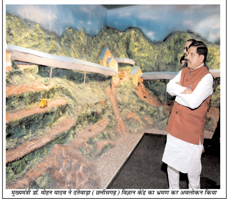
मुख्यमंत्री डॉ. मोहन यादव ने दत्तेवाड़ा (छत्तीसगढ़) विज्ञान केंद्र का भ्रमण कर अवलोकन किया

नक्सलवाद से प्रभावित जिलों में विशेष प्रयासों से सफलता प्राप्त की गई। जहां अनेक इनामी नक्सलवादियों ने समर्पण किया वहीं अनेक नक्सल तत्वों का सफाया भी किया गया। जवानों और सुरक्षा बलों को आवश्यक प्रोत्साहन भी दिया गया। नागरिकों के मन में सरकार के प्रति विश्वास बढ़ा है। बैठक में नक्सल मुक्त भारत के लिए प्रधानमंत्री नरेन्द्र मोदी और गृह मंत्री अमित शाह का संपूर्ण प्रदेशवासियों की ओर से हार्दिक आभार व्यक्त किया। प्रदेश में नक्सलवाद से प्रभावित रहे क्षेत्रों के विकास के लिए नए लक्ष्य तय किए गए हैं। नक्सलवाद से प्रभावित रहे ग्रामों के लिए 330 करोड़ रुपये लागत की माइक्रो डेवलपमेंट योजना लागू की गई है। अलग-अलग योजनाओं के तहत सड़क, पुल, मोबाइल टॉवर, नई सुरक्षा व्यवस्थाएं स्थापित की जा रही हैं।