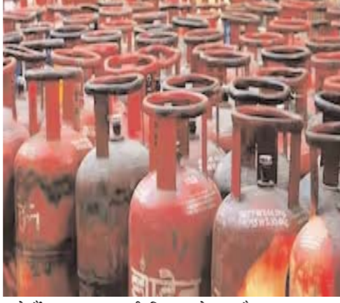
जाते हैं। शहर का काफी विस्तार हो गया है।

जब गोदाम बना था तब बस्ती नहीं थी इक्का दुक्का घर ही थे दो गोदाम तो शहर से दूर थे। गैस गोदाम की सुरक्षा को लेकर शासन की जो गाइड लाइन है उसके अनुसार गोदाम में गोदाम मालिकों को पूरे इंतजाम करना अनिवार्य है। लेकिन विभागीय अधिकारी जांच के नाम पर खानापूर्ति करके चले