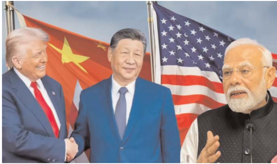
इससे वैश्विक आर्थिक स्थिरता को बल मिल सकता है।

विश्व अर्थव्यवस्था के संदर्भ में देखा जाए तो अमेरिका और चीन के बीच तनाव कम होने से सबसे पहले वैश्विक बाजारों को राहत मिलेगी। निवेशकों का विश्वास बढ़ेगा, आपूर्ति श्रृंखलाओं में सुधार होगा और इलेक्ट्रॉनिक्स, ऊर्जा, तकनीकी तथा विनिर्माण क्षेत्रों में लागत घट सकती है। इससे महंगाई पर भी नियंत्रण संभव है। किंतु यह केवल तस्वीर का एक पक्ष है। दूसरा पक्ष यह है कि यदि दोनों महाशक्तियाँ वैश्विक व्यापारिक नियमों और आर्थिक नीतियों को अपने हितों के अनुसार तय करने लगे तो छोटे देशों की आर्थिक स्वतंत्रता प्रभावित हो सकती है। दुनिया पहले भी उपनिवेशवाद और आर्थिक नियंत्रण की राजनीति देख चुकी है, अब आशंका यह है कि कहीं आर्थिक वैश्वीकरण का नया स्वरूप महाशक्तियों के संयुक्त वर्चस्व में परिवर्तित न हो जाए। इसी संदर्भ में जी-2 यानी अमेरिका और चीन केंद्रित विश्व व्यवस्था की चर्चा तेज हुई है। कुछ राजनीतिक विश्लेषकों का मानना है कि विश्व धीरे-धीरे बहुध्रुवीय व्यवस्था से