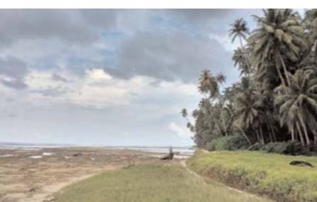
उत्तर प्रदेश, मध्य प्रदेश, छत्तीसगढ़ और दिल्ली तक 15 जुलाई तक फैल जाती है। आईएमडी के मुताबिक, पूर्वोत्तर भारत में 13 से 19 मई तक भारी बारिश होगी, जो मानसून पूर्व बारिश का अनुमान है। ऐसे में यहां भी 25 मई तक मानसून आएगा, जिससे उत्तर प्रदेश और दिल्ली तक 28 जून से 1 जुलाई तक मानसून पहुंच सकता है। भले मानसून के जल्दी आने की संभावना है, लेकिन यह ज्यादा असरदार नहीं होगी। ऐसी संभावना मौसम वैज्ञानिक जता चुके हैं। उनके मुताबिक, प्रशांत महासागर में अल नीनो विकसित हो रहा है, जो देश में जून से सितंबर तक होने वाली बारिश पर असर डालेगा। यह सामान्य से कम 92 प्रतिशत रहने की संभावना है। अल नीनो में समुद्र की सतह का पानी गर्म होता है, जो मानसून की हवाओं को कमजोर करता है, जिससे बारिश कम होती है।