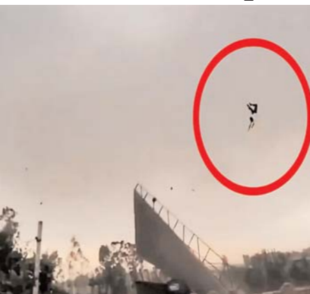
लखनऊ, (आरएनएस)। उत्तर प्रदेश के अलग-अलग जिलों में बुधवार रात को पश्चिमी विक्षोभ का भयानक असर दिखा। यहां तेज आंधी-तूफान, बारिश-ओलावृष्टि और बिजली गिरने से हाहाकार मच गया रिपोर्ट के मुताबिक, प्रयागराज, फतेहपुर, बदायूं, बरेली, कानपुर, उ्नाव और भदोही समेत कई जिलों में पेड़ गिरने, पोल उखड़ने, आसमानी बिजली गिरने और मकान गिरने से 56 लोगों की मौत हुई है,

जबकि 50 से अधिक लोग घायल हैं। भारतीय मौसम विभाग ने करीब 38 जिलों के लिए येलो अलर्ट जारी किया है। रिपोर्ट के मुताबिक, 50 से 80 किलोमीटर प्रतिघंटे की रफतार से चली आंधी की वजह से कई जिलों में बड़ा नुकसान हुआ है। प्रयागराज में 10, उ्नाव में 7, बदायूं में 5, बरेली में 4 फतेहपुर में 5, भदोही में 10 की मौत हुई है। भदोही में एक मकान पर नीम का पेड़ गिरने से 4 की मौत हो गई। सीतापुर में पेड़ गिरने से 2 और रायबरेली में बिजली गिरने से एक किशोरी समेत 3 की मौत हुई है।