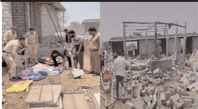
भोपाल, (आरएनएस)। मध्य प्रदेश के देवास जिले के टोंककला में पटारवा फैक्ट्री में हुए भीषण विस्फोट में कई लोगों के हताहत होने की खबर सामने आई है। इस दुखद घटना पर मुख्यमंत्री डॉ. मोहन यादव ने गहरा दुख व्यक्त किया है।

सीएम डॉ मोहन ने दुख जताते हुए दिए घटना की जांच के आदेश, मृतकों के परिजनों को 4-4 लाख मुआवजा