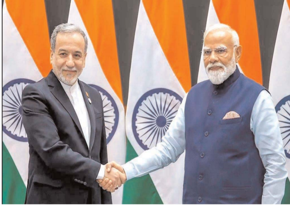
ब्रिक्स विदेश मंत्रियों की बैठक के दौरान, ईरान के विदेश मंत्री अब्बास अराघची के साथ प्रधानमंत्री नरेंद्र मोदी।

से ही काफिला कम कर दिया है। उन्होंने भाजपा पर आरोप लगाते हुए कहा कि भाजपा की पूर्व सरकार में फिजूलखर्ची हुई है। करोड़ों रुपये बिल्डिंग बनाने में फूँके गए। प्रदेश की संपदा को भाजपा ने लूटा है। वे जैसे जैसे प्रदेश की सत्ता में आना चाहते हैं। जनता की सेवा के पैसे रोकोगे तो कैसे हिमाचल की सत्ता में आओगे।