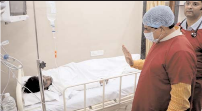
मुख्यमंत्री ने तुरंत घटना की उच्च स्तरीय जांच के आदेश दे दिए हैं। उन्होंने जिले के प्रभारी मंत्री एवं उप मुख्यमंत्री जगदीश देवड़ा, गृह सचिव और वरिष्ठ अधिकारियों को तुरंत मौके पर पहुंचकर स्थिति का जायजा लेने के निर्देश दिए

हैं। राज्य सरकार ने मृतकों के परिजनों को 4 लाख रुपये की तत्काल आर्थिक सहायता देने और घायलों के मुफ्त इलाज कराने के निर्देश जारी कर दिए हैं। मुख्यमंत्री डॉ. मोहन यादव ने बाबा महाकाल से दिवंगतों की आत्मा की शांति, शोक संतप्त परिजनों को दुख सहन करने की शक्ति और घायलों के शीघ्र स्वस्थ होने की प्रार्थना की है। प्रशासन और पुलिस की टीम मौके पर पहुंचकर बचाव एवं राहत कार्य में जुटी हुई है। विस्फोट के कारणों का पता लगाने के लिए जांच शुरू कर दी गई है।