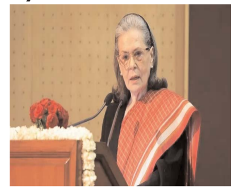
चुका है। सूत्रों के अनुसार, केरल में मुख्यमंत्री पद को लेकर पार्टी के भीतर मंथन जारी है। केंसी वेणुगोपाल, रमेश चेत्रिथला और वीडी सतीशन को प्रमुख दावेदार माना जा रहा है। हाल ही में हुई बैठक में तीनों नेताओं ने अपनी-अपनी दावेदारी रखी, हालांकि अंत में सभी ने शीर्ष नेतृत्व के फैसले को स्वीकार करने की बात कही।