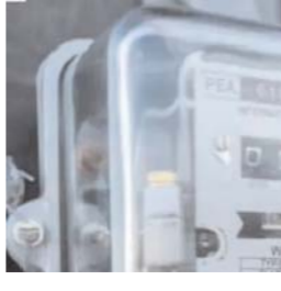
दी गई है। प्राथमिक तौर पर मैनुअल रीडिंग दोष, डिस्टर्बे माइग्रूल की खराबी और वोल्टेज फ्लक्चुएशन को कारण माना जा रहा है। जिन क्षेत्रों से ज्यादा शिकायतें आई हैं, वहां तकनीकी टीमों को भेजा गया है। जरूरत पड़ने पर प्रभावित मीटरों को दोबारा लैब टेस्टिंग के लिए भेजा जाएगा।

नई दिल्ली (ए.।)। प्रदेश के कई शहरों में लगाए गए स्मार्ट मीटरों की गुणवत्ता पर सवाल उठने लगे हैं। उपभोक्ताओं की शिकायत है कि कई मीटर कुछ ही महीनों में खराब हो गए, जबकि इन्हें तकनीकी परीक्षण और लैब टेस्ट के बाद लगाया गया था। कई घरों में मीटर को डिस्टर्बे बंद हो गई है, जिससे उपभोक्ताओं को रोजाना बिजली खपत की जानकारी नहीं मिल पा रही। कुछ मीटरों में रिपल टाइम डेटा अपडेट नहीं होने और गलत रीडिंग दिखने की भी शिकायतें सामने आई हैं। बिजली कंपनियों का कहना है कि खराबी की तकनीकी जांच शुरू कर दी गई है। प्राथमिक तौर पर मैनुअल रीडिंग दोष, डिस्टर्बे माइग्रूल की खराबी और वोल्टेज फ्लक्चुएशन को कारण माना जा रहा है। जिन क्षेत्रों से ज्यादा शिकायतें आई हैं, वहां तकनीकी टीमों को भेजा गया है। जरूरत पड़ने पर प्रभावित मीटरों को दोबारा लैब टेस्टिंग के लिए भेजा जाएगा।