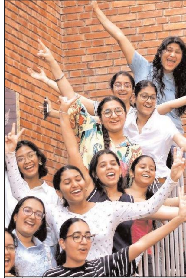
नई दिल्ली के मंदिर मार्ग स्थित सेंट थॉमस स्कूल में घोषित सीबीएसई कक्षा 12वीं के नतीजों का जश्न मनाते छात्र।