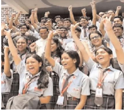
विपरीत प्रयागराज रीजन का प्रदर्शन सबसे कमजोर रहा और यहाँ पास प्रतिशत 72.43 दर्ज किया गया। दिल्ली वेस्ट और दिल्ली ईस्ट रीजन ने भी बेहतर प्रदर्शन करते हुए 91 प्रतिशत से अधिक परिणाम हासिल

इस बार भी छात्राओं ने मारी बाजी, मध्य प्रदेश में 12.14 फीसदी विद्यार्थी सभी विषयों में फेल