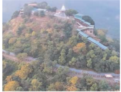
कुछ अधिकारियों और कर्मचारियों द्वारा यह तर्क दिया जाता रहा कि मां शारदा मंदिर प्रबंध

मैहर, (ए.)। मध्यप्रदेश के मैहर स्थित मां शारदा देवी मंदिर की प्रबंध समिति में सूचना का अधिकार अधिनियम 2005 (आरटीआई) लागू न होने को लेकर अब गंभीर सवाल उठने लगे हैं। धार्मिक नगरी में यह चर्चा तेज हो गई है कि आखिर वर्षों से मंदिर प्रबंध समिति को सूचना के अधिकार के दायरे से बाहर क्यों रखा गया। स्थानीय लोगों का मानना है कि इससे समिति के कामकाज में पारदर्शिता प्रभावित हुई है और पुराने आर्थिक अनियमितताओं पर पर्दा पड़ा रहा (जानकारी के अनुसार, पूर्व में समिति से जुड़े