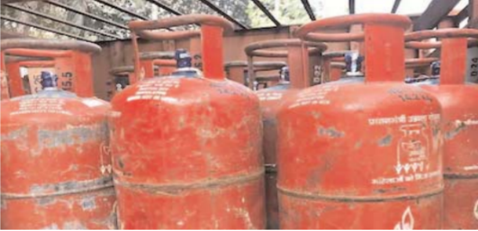
डिलीवरी पूरी मानी जाती है। इस पूरी प्रक्रिया का मुख्य उद्देश्य गैस सिलेंडर की कालाबाजारी और गलत डिलीवरी को रोकना है, ताकि सिलेंडर हमेशा सुरक्षित रूप से असली ग्राहक तक ही पहुंचे।

नई दिल्ली (आरएनएस)। देशभर में रसोई गैस सिलेंडर की डिलीवरी को लेकर एक बड़ा बदलाव किया गया है, जिसके बारे में हर आम आदमी का जानना बेहद जरूरी है। अब एचपी गैस (HP Gas), इंडेन (Indane) और भारत गैस (Bharat Gas) जैसी प्रमुख कंपनियां ग्राहकों को सिलेंडर देने से पहले 'डिलीवरी ऑथेंटिकेशन कोड' (DAC) की मांग कर रही हैं। यह नई व्यवस्था ग्राहकों की सुरक्षा और सही व्यक्ति तक डिलीवरी सुनिश्चित करने के लिए लागू की गई है। लेकिन इस नई सुरक्षा प्रणाली की आड़ में साइबर ठगों ने भी लोगों को लूटने का नया पैंतरा निकाल लिया है, जिसे लेकर गैस कंपनियों ने ग्राहकों के लिए एक बेहद सख्त अलर्ट जारी किया है।