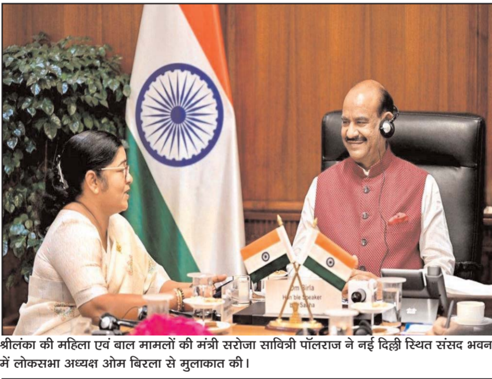
श्रीलंका की महिला एवं बाल मामलों की मंत्री सरोजा सावित्री पॉलराज ने नई दिल्ली स्थित संसद भवन में लोकसभा अध्यक्ष ओम बिरला से मुलाकात की।

इससे पहले, प्रधानमंत्री मोदी का जामनगर से लेकर सोमनाथ तक अभूतपूर्व स्वागत किया गया। सोमनाथ पहुंचने पर उन्होंने एक भव्य रोड शो किया, जिसमें सड़क के दोनों ओर जमा जनसैलाब ने हर-हर महादेव के जयघोष के साथ उनका अभिनंदन किया। गुजरात सरकार और सोमनाथ ट्रस्ट ने इस महोत्सव को ऐतिहासिक बनाने के लिए व्यापक स्तर पर तैयारियां की थीं। मंदिर को विशेष लाइटिंग और विदेशी फूलों से सजाया गया है, जिससे रात्रि के समय इसकी आभा और भी मनोरम हो गई है। यह उत्सव न केवल आस्था का प्रतीक बना, बल्कि आधुनिक भारत की सांस्कृतिक और आध्यात्मिक शक्ति के पुनर्जागरण का भी संदेश दे गया।