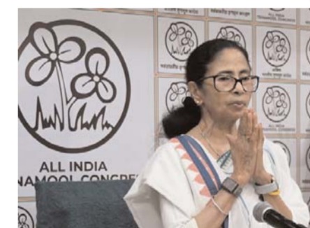
रंगासामी को कार्यकर्ताओं की बेरहमी से हत्या कर दी थी? लेफ्ट का भी साफ इनकार, कहा- अपराधियों और भ्रष्टाचारियों के साथ नहीं जाएंगे

कांग्रेस के बाद वामदलों ने भी ममता बनर्जी के