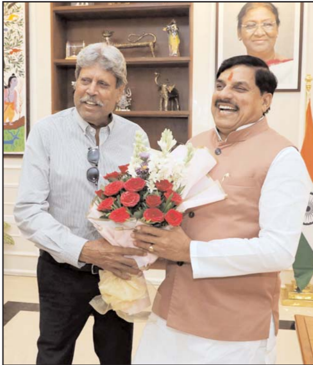
मुख्यमंत्री डॉ. मोहन यादव को 1983 के क्रिकेट विश्व कप विजेता टीम के कप्तान कपिल देव ने मुख्यमंत्री निवास में पुष्प-गुच्छ भेंट किया।