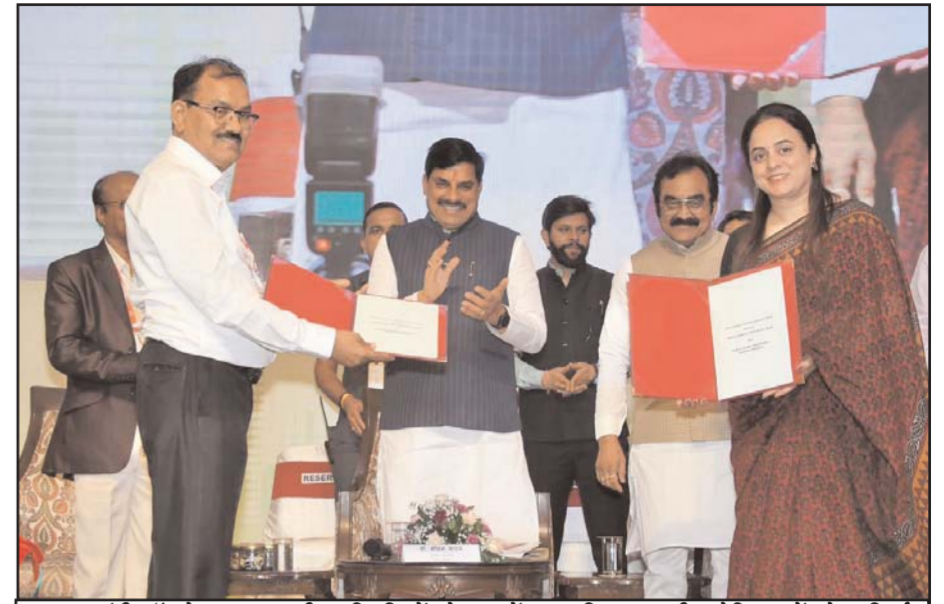
मुख्यमंत्री डॉ. मोहन यादव की उपस्थिति में भोपाल में हुए अखिल भारतीय संमेलन में लोक निर्माण विभाग और आईआईटी इंदौर तथा गुहा संस्था के मध्य एमओयू का आदान-प्रदान हुआ

कार्रवाई के दौरान रहवासियों और पुलिस के बीच धक्का-मुक्की हुई। कुछ लोगों ने पुलिस पर हमला करने की कोशिश की, जिसके जवाब में पुलिस ने बल प्रयोग किया। पूरे क्षेत्र में वाटर कैनन और भारी पुलिस बल तैनात रहा। बस्ती के बाहर रोके गए लोग सड़क पर बैठकर प्रदर्शन करते रहे। महिलाओं और बच्चों ने धूप में बैठकर कार्रवाई का विरोध किया और पुनर्वास की स्पष्ट व्यवस्था की मांग उठाई। प्रशासन का कहना है कि इस क्षेत्र में भविष्य में विकास परियोजनाएं, जैसे राम म्यूजियम, प्रस्तावित हैं। वहीं, रहवासी और विश्वेशी दल इस कार्रवाई को बिना पर्याप्त पुनर्वास और मानवीय दृष्टिकोण के उठाया गया कदम बता रहे हैं।