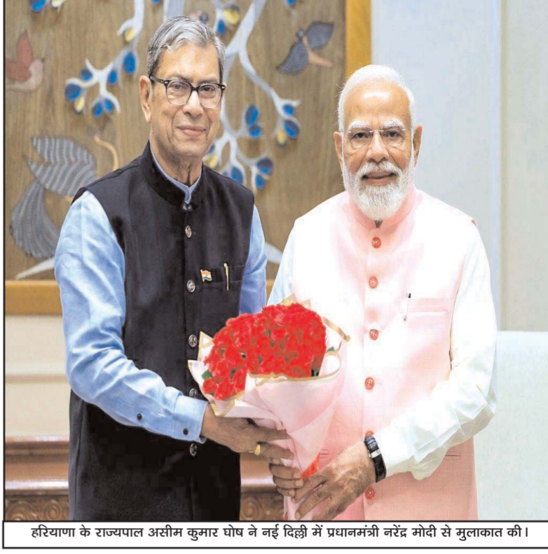
हरियाणा के राज्यपाल असीम कुमार घोष ने नई दिल्ली में प्रधानमंत्री नरेंद्र मोदी से मुलाकात की।

रहने वाला है। बताया जा रहा है कि मई महीने से ही पंजाब में नशे के खिलाफ एक व्यापक अभियान की शुरुआत की जाएगी, जिसकी कमान स्वयं अमित शाह संभालेंगे। इस अभियान के अंतर्गत पूरे राज्य में जागरूकता यात्राएं निकाली जाएंगी, जिनमें समय-समय पर केंद्र और राज्य स्तर के दिग्गज नेता भी शिरकत करेंगे। राजनीतिक विश्लेषकों का मानना है कि उत्तर प्रदेश, उत्तराखंड, गोवा और मणिपुर जैसे राज्यों में सत्ता में होने के कारण भाजपा वहां मजबूत स्थिति में है, लेकिन पंजाब में अपनी पैठ बढ़ाने के लिए उसे एक बड़े और प्रभावी मुद्दे की तलाश थी। ऐसे में ड्रग्स के खिलाफ यह मुहिम चुनावी बिसात पर एक अहम चाल मानी जा रही है। भाजपा नेताओं का दावा है कि यह अभियान केवल राजनीतिक लाभ के लिए नहीं, बल्कि पंजाब के युवाओं को बचाने और सामाजिक बदलाव लाने की दिशा में एक बड़ा कदम है। शाह के नेतृत्व में तैयार होने वाला यह नशामुक्त पंजाब रोडमैप राज्य की सियासत में नई हलचल पैदा करने वाला साबित होगा। आने वाले समय में ड्रग्स, कानून-व्यवस्था और विकास जैसे मुद्दों पर राज्य का राजनीतिक पारा और अधिक चढ़ना तय माना जा रहा है।