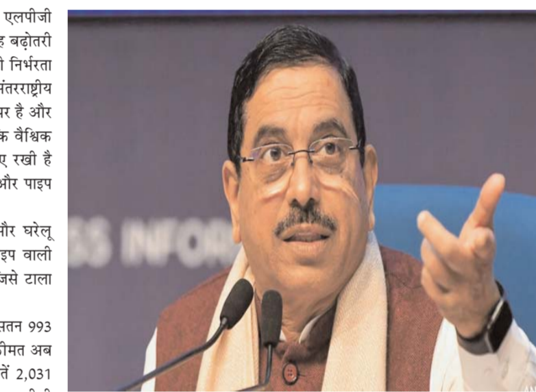
मार्च में की गई थी, जिसमें 144 रुपए बढ़ाए गए थे। इसके बाद 1 अप्रैल को लगभग 200 रुपए की एक और बढ़ोतरी की गई।

नई दिल्ली(आरएनएस)। केंद्रीय मंत्री प्रह्लाद जोशी ने कमर्शियल एलपीजी सिलेंडर की कीमतों में 993 रुपए की बढ़ोतरी पर शनिवार को कहा कि यह बढ़ोतरी वैश्विक कारणों से हुई है और भारत की 50 प्रतिशत से अधिक एलपीजी की निर्भरता आयात पर है। पत्रकारों से बात करते हुए प्रह्लाद जोशी ने कहा, यह एक अंतरराष्ट्रीय समस्या है और हमारी 50 प्रतिशत से अधिक एलपीजी की निर्भरता आयात पर है और इसी वजह से फिलहाल हम मुश्किलों का सामना कर रहे हैं। उन्होंने कहा कि वैश्विक अस्थिरता के बावजूद सरकार ने मुख्य ईंधनों की कीमतों में स्थिरता बनाए रखी है और बताया कि केंद्र सरकार ने अब तक घरेलू एलपीजी, पेट्रोल, डीजल और पाइप वाली प्राकृतिक गैस की दरें अपरिवर्तित रखी हैं। केंद्रीय मंत्री प्रह्लाद जोशी ने कहा, केंद्र सरकार ने पेट्रोल, डीजल और घरेलू एलपीजी की कीमतें वैसी ही रखी हैं, और यहां तक कि एलएनजी (पाइप वाली प्राकृतिक गैस) की कीमतें भी वैसी ही हैं लेकिन यह एक ऐसी चीज है जिसे टाला नहीं जा सकता था, इसलिए ऐसा हुआ। कमर्शियल एलपीजी (19 किलोग्राम का सिलेंडर) की कीमत में औसतन 993 रुपए की बढ़ोतरी की गई है। दिल्ली में, कमर्शियल एलपीजी सिलेंडर की कीमत अब 3,071.50 रुपए हो गई है, जो पहले 2,078.50 रुपए थी। मुंबई में, कीमतें 2,031 रुपए से बढ़कर 3,024 रुपए हो गई हैं। 28 फरवरी के बाद से कमर्शियल एलपीजी की कीमतों में यह तीसरी बढ़ोतरी है, जब ईरान संघर्ष बढ़ गया था। पहली बढ़ोतरी