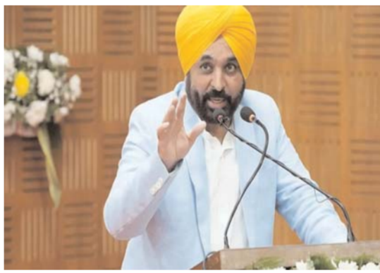
राजनीति खत्म होगी।

चंडीगढ़, (आरएनएस)। पंजाब के मुख्यमंत्री भगवंत सिंह मान ने राज्य विधानसभा में अपनी राजनीतिक ताकत का प्रदर्शन करते हुए विश्वास प्रस्ताव सर्वसम्मति पारित हो गया। इसके साथ ही श्री मान ने स्पष्ट संदेश दिया कि सरकार को अस्थिर करने की कोशिशें विफल हो चुकी हैं। मुख्यमंत्री ने कहा कि यह जनादेश जनता के अटूट विश्वास का प्रतीक है और आम आदमी पार्टी को वर्ष 2027 में इससे भी बड़ा समर्थन मिलेगा। उन्होंने कहा कि पार्टी खून-पसीने से खड़ी की गई है और आप के संयोजक अरविंद केजरीवाल के साथ मजबूती से खड़ी है। विधानसभा कार्यवाही के दौरान कुल 88 आप विधायक सदन में उपस्थित रहे, जबकि दो विधायक विदेश में, दो जेल में और दो अस्पताल में भर्ती बताए गए। विश्वास प्रस्ताव सदन में सर्वसम्मति से पारित हो गया। विश्वास प्रस्ताव पेश करते हुए मुख्यमंत्री ने कहा कि सरकार को अस्थिर करने के लिए झूठा प्रचार किया जा रहा है लेकिन पंजाब की जनता मजबूती से सरकार के साथ खड़ी है। उन्होंने कहा कि विपक्ष की नकारात्मक राजनीति को जनता कोई महत्व नहीं दे रही। उन्होंने कहा कि विपक्ष पूरी तरह बिखरा हुआ है और उसके नेता आपस में सत्ता के लिए लड़ रहे हैं। उन्होंने किसी का नाम न लेते हुए तंज कसते हुए कहा कि विपक्ष के नेता और उनके भाई एक ही घर में रहते हैं लेकिन अलग-अलग दलों के झंडे लगे हैं, जबकि आम आदमी पार्टी पूरी तरह एकजुट है। उन्होंने कहा कि विपक्ष इस बात को पचा नहीं पा रहा कि जागत जोत श्री गुरु ग्रंथ साहिब सक्तरा अधिनियम 2026 पारित हो चुका है, जिससे उनकी विभाजनकारी