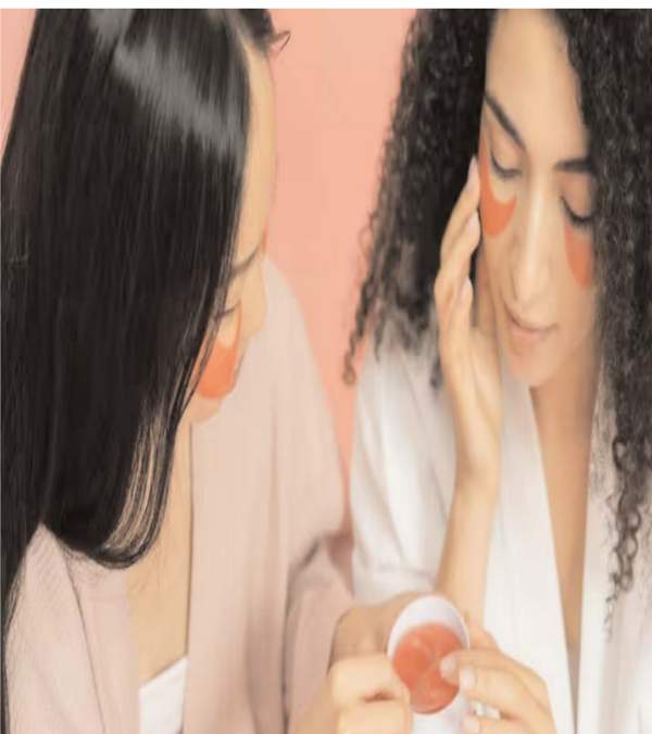
आंखों के नीचे काले घेरे होना