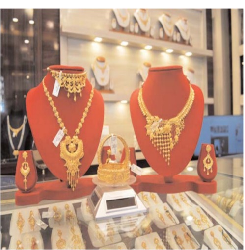
भी देखी गई है, लेकिन ऊंचे स्तरों पर बिकवाली के दबाव ने कीमतों को नीचे खींच लिया है।

मल्टी कमोडिटी एक्सचेंज (सूझ) पर आज सोने की वायदा कीमतों में तगड़ी गिरावट देखी गई। 24 कैरेट गोल्ड का वायदा भाव 580 रुपये यानी 0.388 टूटकर 1,51,944 रुपये प्रति 10 ग्राम के निचले स्तर पर पहुंच गया। गौरतलब है कि पिछले कारोबारी सत्र में सोना 1,52,530 रुपये प्रति 10 ग्राम के भाव पर बंद हुआ था। हालांकि, फ्यूचर मार्केट में कुछ ट्रेडर्स की ताजा खरीदारी के चलते मांग में मजबूती