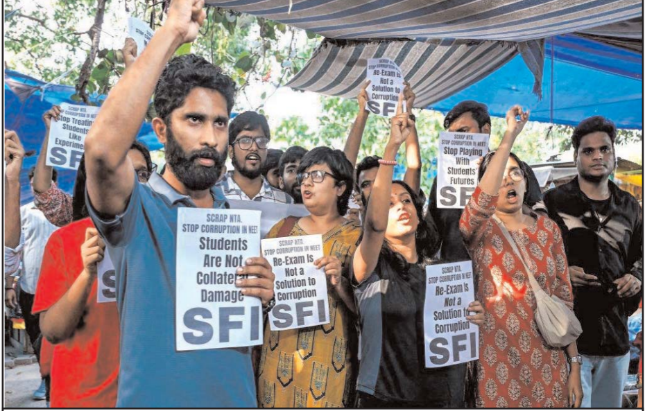
स्टूडेंट्स फेडरेशन ऑफ इंडिया के सदस्यों और समर्थकों ने नई दिल्ली में कथित नीट-यूजी 2026 पेपर लीक के खिलाफ विरोध प्रदर्शन किया।

चेन्नई, (आरएनएस)। तमिलनाडु के चेन्नई से अबू धाबी के लिए उड़ान की तैयारी कर रही एतिहाद एयरवेज के एक विमान में मंगलवार को आग लग गई। घटना के समय विमान चेन्नई हवाई अड्डे पर उड़ान भरने की तैयारी कर रहा था, तभी उसके बाएं पंख में आग लगी और हड़कंप मच गया। घटना की सूचना पर मौके पर मौजूद अग्निशमन दल के कर्मियों ने आग को बुझाया और उड़ान रद्द कर दी। रिपोर्ट्स के मुताबिक, घटना के समय विमान में चालक दल के सदस्यों के साथ 280 यात्री सवार थे। पंख में आग लगते ही सभी यात्रियों को सुरक्षित उतार लिया गया। किसी भी यात्री के चोट लगने या घायल होने की खबर नहीं है।