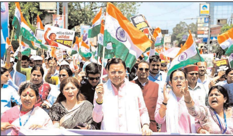
उत्तराखंड के मुख्यमंत्री पुष्कर सिंह धामी ने देहरादून में नारी शक्ति वंदन अधिनियम के समर्थन में भाजपा महिला कार्यकर्ताओं के साथ एक विरोध मार्च में भाग लिया

प्रधानमंत्री मोदी ने कई योजनाओं का जिक्र करते हुए वादा किया कि राज्य में भाजपा सरकार बनने पर आयुष्मान भारत योजना लागू की जाएगी, जिसके तहत लोगों को 5 लाख रुपये तक का मुफ्त इलाज मिलेगा। साथ ही प्रधानमंत्री आवास योजना के तहत गरीबों को घर और महिलाओं के नाम पर संपत्ति का अधिकार देने की बात कही। उर्जा क्षेत्र में प्रधानमंत्री सूर्य घर योजना का जिक्र करते हुए उन्होंने कहा कि इससे लोगों का बिजली बिल शून्य हो सकता है और सोलर पैनल लगाने के लिए आर्थिक सहायता दी जाएगी। मध्यम वर्ग को संबोधित करते हुए पीएम मोदी ने कर, राहत, शिक्षा और आवास सुविधाओं में सुधार का उल्लेख किया। उन्होंने कहा कि आज 12 लाख रुपये तक की आय पर टैक्स नहीं है और मेडिकल सौदों में वृद्धि से छात्रों को फायदा मिला है। अपने संबोधन के अंत में प्रधानमंत्री ने श्याम प्रसाद मुखर्जी को याद करते हुए उनके विजन को आगे बढ़ाने की बात कही। उन्होंने दावा किया कि भाजपा की विचारधारा में बंगाल की सोच और परंपरा की गहरी झलक है।