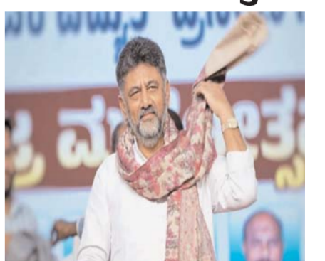
सवालों का जवाब देते हुए उन्होंने कहा, जिम्मेदारी भरे पद पर रहते हुए क्या मैं मीडिया के सामने ऐसे मामलों पर चर्चा कर सकता हूँ? मैं इस बारे में बात नहीं करूंगा। कृपया मुझसे ऐसी जानकारी निकालने की कोशिश न करें। मुस्लिम समुदाय में असंतोष को लेकर विधायकों और मंत्रियों द्वारा मुख्यमंत्री से मुलाकात की खबरों पर उन्होंने कहा, हमें पार्टी स्तर पर कुछ जानकारी मिली है। हम सभी को मिलकर काम करना होगा।

नई दिल्ली/बंगलुरु, (आरएनएस)। कर्नाटक में सत्तारूढ़ पार्टी में जारी असंतोष के बीच, उपमुख्यमंत्री डी. के. शिवकुमार ने राजधानी में कांग्रेस नेताओं से मुलाकात की। उन्होंने बैठकों का विवरण साझा करने से इनकार कर दिया और कहा कि वे इसका खुलासा नहीं करेंगे। उपमुख्यमंत्री शिवकुमार ने कहा, मैंने पार्टी नेताओं से मुलाकात की है। मैं अपना काम जारी रखूंगा, लेकिन मैं यह खुलासा नहीं करूंगा कि मैं किन लोगों से मिला हूँ। मैं दिल्ली सिर्फ यहाँ की हवा का आनंद लेने नहीं आया हूँ। गुरुवार रात नई दिल्ली में बोलते हुए, शिवकुमार ने जब पूछा गया कि क्या वह पार्टी नेताओं को चुनाव रिपोर्ट सौंपेंगे, तो उन्होंने कहा, मैंने चुनाव प्रचार के लिए तमिलनाडु, केरल और असम का दौरा किया। मुझे इन राज्यों में हुए घटनाक्रमों के बारे में अपने नेताओं को जानकारी देनी होगी। पार्टी ने मुझे वहाँ चुनाव प्रचार को जिम्मेदारी सौंपी थी। कर्नाटक में चुनाव कराना केपीसीसी अध्यक्ष और उपमुख्यमंत्री के रूप में मेरा कर्तव्य है, और मैं इसे पूरा करूंगा राज्य में संभावित बदलावों के बारे में पूछे गए