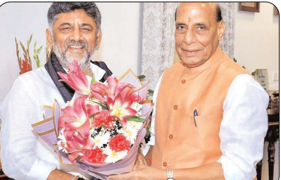
कर्नाटक के उपमुख्यमंत्री डी. के. शिवकुमार ने नई दिल्ली में रक्षा मंत्री राजनाथ सिंह से मुलाकात की, ताकि बंगलुरु में रक्षा हवाई अड्डे के आसपास ऊंचाई संबंधी उन प्रतिबंधों पर चर्चा की जा सके, जिनसे निर्माण और विकास कार्य प्रभावित हो रहे हैं।

अधिकारियों का कहना है कि सभी पहलुओं को ध्यान में रखते हुए जांच की जा रही है और जल्द ही मामले का पूरा खुलासा किया जाएगा। फिलहाल बैधांशुगो पुलिस ने आरोपी के खिलाफ मामला दर्ज कर लिया है। पुलिस सूत्रों का कहना है कि परिवार में किसी भी तरह के घरेलू झगड़े की बात सामने नहीं आई है। अब पुलिस इस एंगल पर जांच कर रही है कि क्या युवती किसी तांत्रिक क्रिया में शामिल थी या मानसिक रूप से बीमार थी।