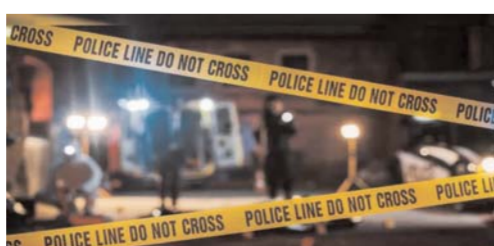
उसे तलाश कर गिरफ्तार कर लिया। पुलिस का कहना है कि वारदात के बाद उसका व्यवहार असाधारण था, जिससे मामले ने और भी गंभीर रूप ले लिया है।

नई दिल्ली (आरएनएस)। असम के पश्चिमी कार्बी आंगलॉग जिले से एक सनसनीखेज और झकझोर देने वाली घटना सामने आई है, जहां एक 19 वर्षीय युवती पर अपनी ही मां की हत्या का आरोप है। घटना डेरामुख लालुंग गांव की बताई जा रही है, जिसने पूरे इलाके में दहशत और हैरानी का माहौल पैदा कर दिया है।