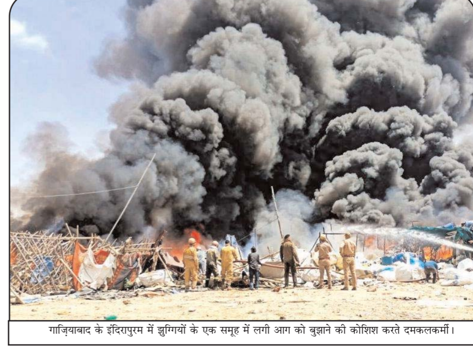
गाँज्याबाद के इंदिरापुरम में झुगियों के एक समूह में लगी आग को बुझाने की कोशिश करते दमकलकर्मी।

जमकर तारीफ की। महिला आरक्षण बिल का जिक्र करते हुए कंगना ने कहा कि पीएम मोदी का व्यक्तित्व और उनकी नीतियां पूरी तरह समानता पर आधारित हैं। उन्होंने कहा कि चुनाव जीतने के लिए कोई भी नेता महिला वोटर्स को खुश क्यों नहीं करना चाहेगा। गौरतलब है कि कंगना रनौत और चिराग पासवान ने साल 2011 में आई बॉलीवुड फिल्म 'मिले ना मिले हम' में एक साथ स्क्रीन शेयर की थी। यह फिल्म चिराग की पहली और आखिरी फिल्म साबित हुई थी, जिसके फ्लॉप होने के बाद उन्होंने राजनीति का रुख कर लिया था। 2024 के लोकसभा चुनावों में दोनों नेताओं की शानदार जीत के बाद जब वे संसद में मिले, तो उनकी हंसी-मजाक की तस्वीरें जमकर वायरल हुई थीं। इससे पहले अपनी फिल्म 'इमरजेंसी' के प्रमोशन के दौरान भी कंगना ने हंसते हुए मीडिया से कहा था, प्लीज कम से कम संसद में तो हमें बख्खा दीजिए। कंगना ने चुटकी लेते हुए बताया था कि लोग सिर्फ इसलिए उनके पीछे पड़े हैं क्योंकि चिराग ने उन्हें कुछ बार हंसा दिया था और अब हालत यह है कि अफवाहों के उर से चिराग उन्हें देखते ही अपना रास्ता बदल लेते हैं।