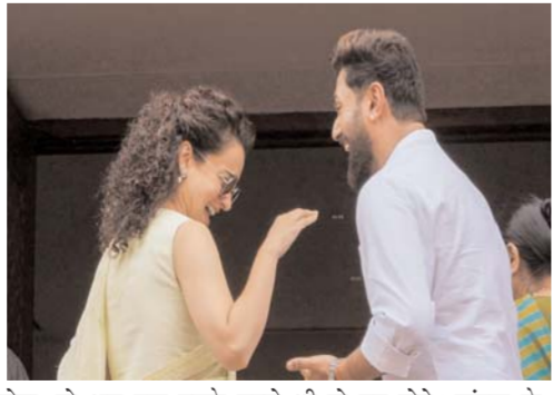
होता, तो अब तक उनके बच्चे भी हो गए होते। कंगना के इस बेबाक जवाब ने सोशल मीडिया पर चल रही सभी गॉसिप की हवा निकाल दी है। इस इंटरव्यू के दौरान जब राहुल गांधी को लेकर सवाल पूछा गया, तो कंगना ने अपने चिर-परिचित अंदाज में चुटकी ली। उन्होंने तीखा तंज कसते हुए कहा कि वह राहुल गांधी के सिर पर बेवजह ऐसा कोई 'ताज' नहीं पहना सकतीं, जिसके वह असल में हकदार ही नहीं हैं। वहीं, दूसरी ओर उन्होंने प्रधानमंत्री नरेंद्र मोदी की

नई दिल्ली (आरएनएस)। बॉलीवुड की 'क्वैन' और भारतीय जनता पार्टी (BJP) की तेजतर्रार सांसद कंगना रनौत हमेशा अपने बेबाक बयानों के लिए सुर्खियों में रहती हैं। अब उन्होंने केंद्रीय मंत्री और लोजपा (रामविलास) के सुप्रसिद्ध चिराग पासवान के साथ अपने रिश्तों को लेकर चल रही तमाम अटकलों और अफवाहों पर खुलकर विराम लगा दिया है। न्यूज एजेंसी एनआई को दिए गए एक पॉडकास्ट इंटरव्यू में कंगना ने चिराग के साथ अफेयर की खबरों को सिर से खारिज करते हुए ऐसा मजेदार जवाब दिया, जिसकी हर तरफ भारी चर्चा हो रही है। इसी दौरान उन्होंने कांग्रेस नेता राहुल गांधी पर भी तीखा तंज कसा।