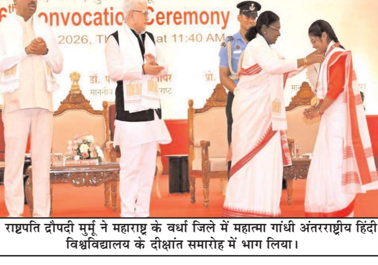
राष्ट्रपति द्रौपदी मुर्मू ने महाराष्ट्र के वर्धा जिले में महात्मा गांधी अंतरराष्ट्रीय हिंदी विश्वविद्यालय के दीक्षांत समारोह में भाग लिया।