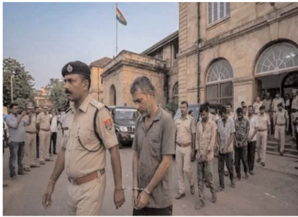
भारतीय सिम कार्ड के दुरुपयोग से विदेशी संचालकों को दी गई पहुंच यह पूरा मामला डिजिटल संचार और भारतीय सिम कार्ड के गंभीर दुरुपयोग से जुड़ा हुआ है। जांच में सामने आया कि इन शान्ति दोषियों ने कई सिम कार्ड जुटाए और उनके ओटीपी विदेशी संचालकों के साथ साझा कर दिए। इसका फायदा उठाकर विदेशी एजेंटों और संचालकों ने अवैध गतिविधियों के लिए संचार स्थापित किया और भारतीय नेटवर्क तक

साक्ष्यों और गवाहों ने खोली पोल, लगा भारी जुर्माना एसडीजेएम अदालत ने इस बेहद गंभीर मामले में 56 दस्तावेजी साक्ष्यों और 11 गवाहों की गवाही को आधार बनाकर अपना कड़ा फैसला सुनाया। इन ठोस सबूतों ने अदालत में आरोपियों की अवैध और राष्ट्र-विरोधी गतिविधियों में संलिप्तता को पूरी तरह साबित कर दिया। जारी किए गए प्रेस नोट के मुताबिक, सभी सात दोषियों को तीन-तीन साल के कठोर कारावास के साथ-साथ प्रत्येक पर 32,000 रुपये का भारी जुर्माना भी लगाया गया है। अदालत ने स्पष्ट किया है कि जुर्माना राशि का भुगतान न करने की सूरत में दोषियों को तीन महीने का अतिरिक्त कठोर कारावास भुगतान पड़ेगा।