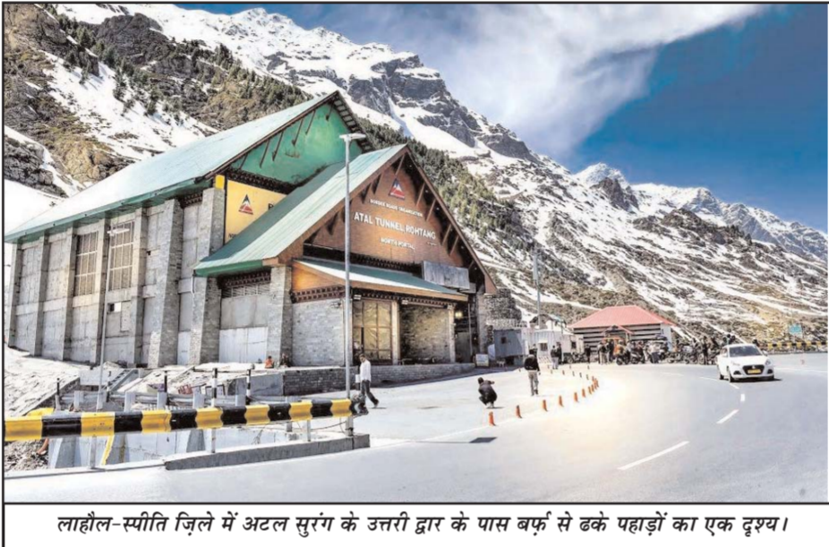
लाहौल-स्पीति ज़िले में अटल सुरंग के उत्तरी द्वार के पास बर्फ से ढके पहाड़ों का एक दृश्य।