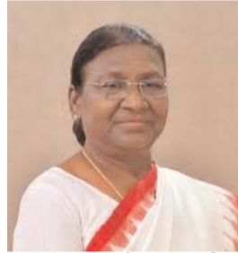
श्रीमती द्रौपदी मुर्मू