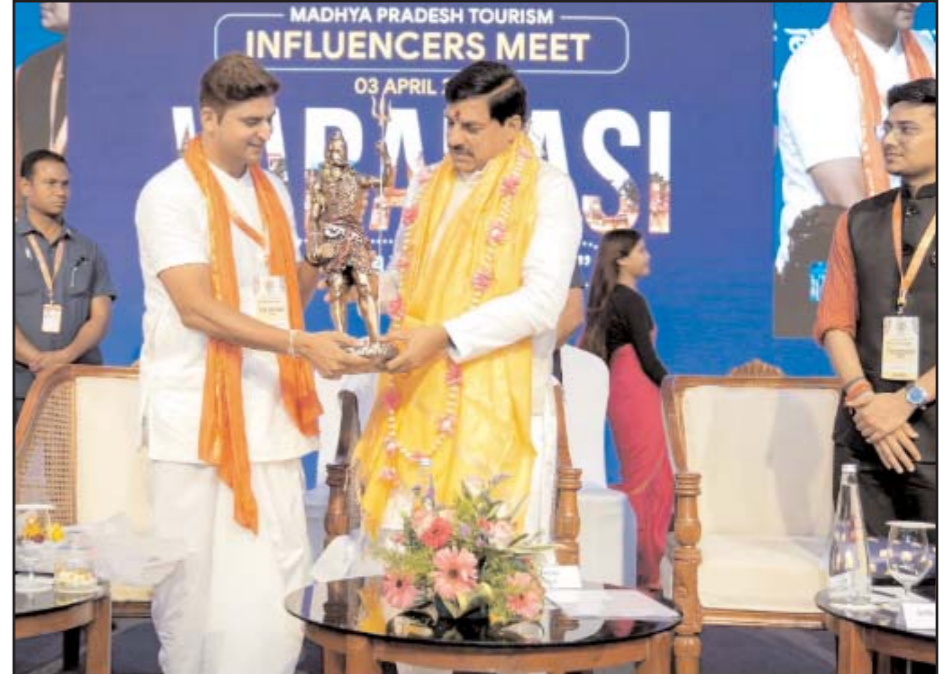
मुख्यमंत्री डॉ.मोहन यादव को वाराणसी में मध्यप्रदेश टूरिज्म इंप्लुएंसर्स मीट में इंप्लुएंसर्स ने प्रतीक चिन्ह भेंट किए।

नई दिल्ली, (आरएनएस)। जन विश्वास (प्रावधान संशोधन) विधेयक, 2026 गुरुवार को संसद से पारित हो गया है। इस कानून का उद्देश्य छोटे अपराधों को अपराध की श्रेणी से बाहर कर व्यापारिक माहौल को बेहतर बनाना और कई क्षेत्रों में अनुपालन को व्यवस्थित करना है। यह विधेयक 1 अप्रैल को लोकसभा और 2 अप्रैल को राज्यसभा से पारित हो गया। प्रधानमंत्री नरेंद्र मोदी ने कहा कि विधेयक विश्वास पर आधारित ढाँचे को मजबूत करता है। आइए विधेयक की बड़ी बातें जानते हैं। विधेयक में 23 मंत्रालयों के 79 केंद्रीय कानूनों के 784 प्रावधानों में संशोधन का प्रस्ताव है। इनमें से 717 प्रावधानों को व्यापार में सुगमता को बढ़ावा देने के लिए अपराध की श्रेणी से बाहर किया जा रहा है। बाकी 67 ऐसे संशोधन किए गए हैं, जिनका लक्ष्य जीवन सुगमता को बेहतर बनाना है। इसमें कोयला, वाणिज्य एवं उद्योग, शिपिंग, शहरी विकास और परिवहन सहित 23 मंत्रालयों से जुड़े कानून शामिल हैं।