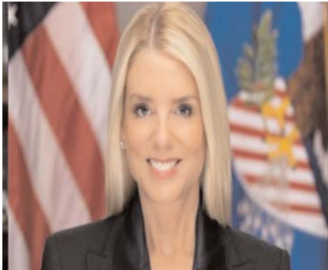
रिपोर्ट के मुताबिक, बोडी के कार्यकाल में सबसे बड़ी चुनौती यौन अपराधी जेफरी एपस्टीन से जुड़ी फाइलों को लेकर था, जिसे संभालने के तरीके से ट्रंप नाराज थे। रिपोर्ट के मुताबिक, ट्रंप मामले में उनके राजनीतिक विरोधियों के खिलाफ पर्याप्त जांच या मुकदमा न चलाने के कारण बोडी

ट्रंप ने ट्विटर पर बोडी को वफादार दोस्त बताते हुए लिखा कि उन्होंने पिछले एक साल से निष्ठा से सेवा की और अपराधों पर नकेल कसी, जिससे हत्याओं की दर 1990 के बाद अब तक के निचले स्तर पर है। ट्रंप ने लिखा कि बोडी अब निजी क्षेत्र में एक बेहद जरूरी और अहम नई जिम्मेदारी संभालने जा रही हैं, जिसकी घोषणा जल्द ही किसी तारीख को की जाएगी। इसी पोस्ट में ट्रंप ने ब्लैंच की नियुक्ति की घोषणा की।