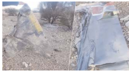
तक कोई आधिकारिक बयान जारी नहीं किया गया है।

तेहरान(आरएनएस)। ईरान और अमेरिका के बीच भड़की जंग से एक बेहद चौंकाने वाली खबर सामने आई है। ईरान की सेना ने दावा किया है कि उसने सेंट्रल ईरान के मरकजी प्रांत में अमेरिकी वायुसेना के सबसे घातक माने जाने वाले F-35 लड़ाकू विमान को मार गिराया है। यह बड़ा दावा ईरान के खातिम अल-अंबिया मुख्यालय की ओर से किया गया है। मीडिया रिपोर्ट के मुताबिक, विमान के मलबे की शुरुआती जांच में उस पर ब्रिटेन के लेकनहीथ एयर बेस (Lakenheath Air Base) के निशान मिले हैं, जो यूरोप में अमेरिकी वायुसेना का एक बेहद महत्वपूर्ण मिलिट्री अड्डा है। हालांकि, इस खुफिया मिशन का असल मकसद क्या था और विमान का पायलट किस हाल में है, इसे लेकर अभी तक कोई आधिकारिक बयान जारी नहीं किया गया है।