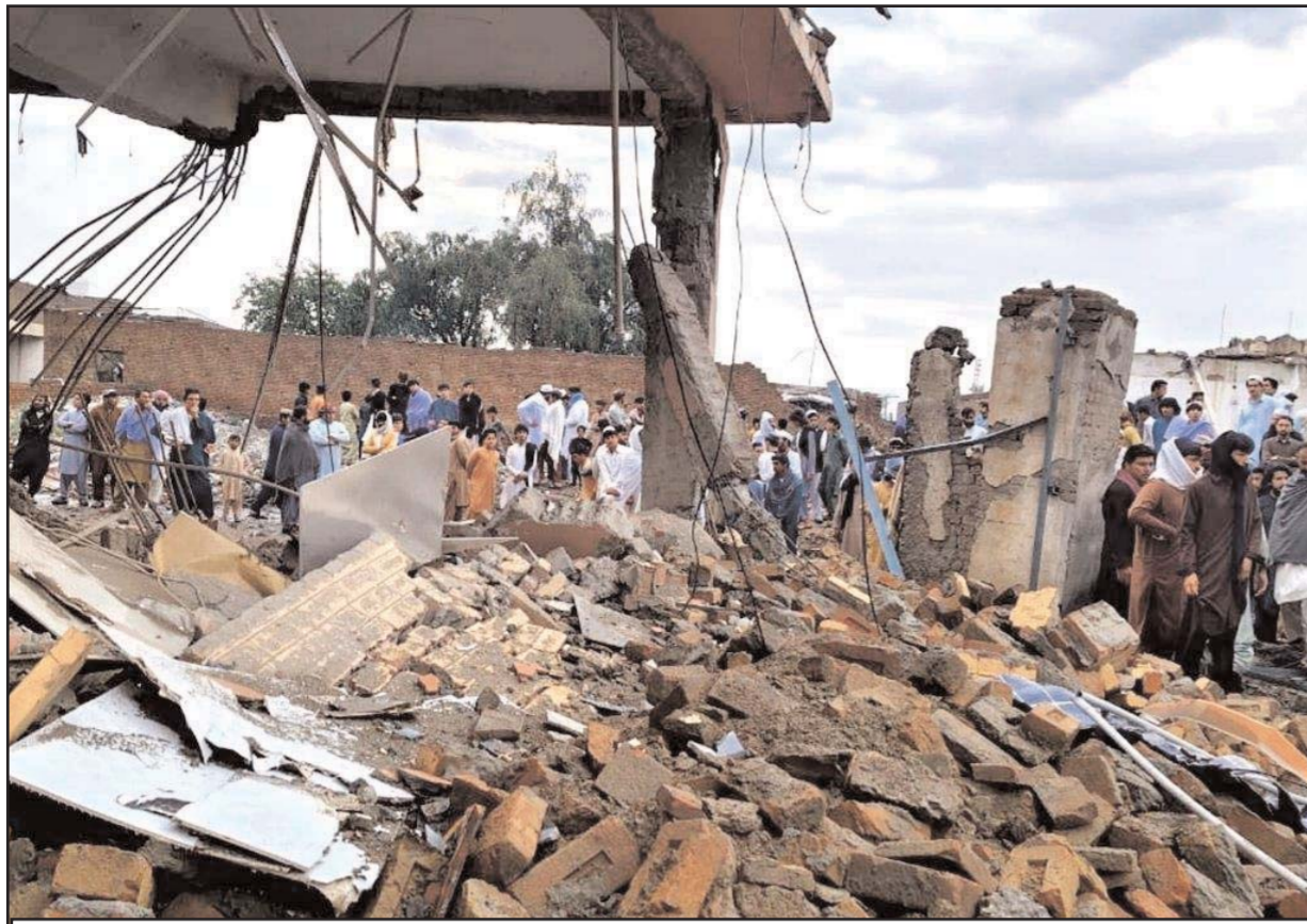
पाकिस्तान के उत्तर-पश्चिमी खैबर पख्तूनख्वा प्रांत के बन्नी जिले में, एक धमाके में क्षतिग्रस्त हुई इमारत के पास लोग जमा हुए। पुलिस ने बताया कि गुरुवार रात पाकिस्तान के उत्तर-पश्चिमी खैबर पख्तूनख्वा प्रांत में एक पुलिस थाने के पास हुए धमाके में कम से कम पांच आम नागरिक मारे गए और दो पुलिसकर्मियों सहित कई अन्य घायल हो गए।