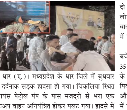
धार (ए.)। मध्यप्रदेश के धार जिले में बुधवार रात दर्दनाक सड़क हादसा हो गया। चिकित्सा स्थित रिलायंस पेट्रोल पंप के पास मजदूरों से भरा एक पिकअप वाहन अनियंत्रित होकर पलटा गया। हादसे में

दो बच्चों समेत 12 लोगों की मौत हो गई, जबकि 13 लोग गंभीर रूप से घायल बताए जा रहे हैं। घटना के बाद इलाके में अफरा-तफरी मच गई और अस्पताल में परिजनों की भीड़ उमड़ पड़ी। जानकारी के अनुसार हादसा रात करीब साढ़े 8 बजे हुआ। पिकअप वाहन में क्षमता से अधिक 30 से 35 मजदूर सवार थे। तेज रफतार और ओवरलोडिंग के कारण वाहन चालक नियंत्रण खो बैठा। इसी दौरान पिकअप ने एक स्कॉर्पियो वाहन को भी टक्कर मार दी और सड़क पर पलट गया। वाहन पलटते ही यात्रियों में चीख-पुकार मच गई।