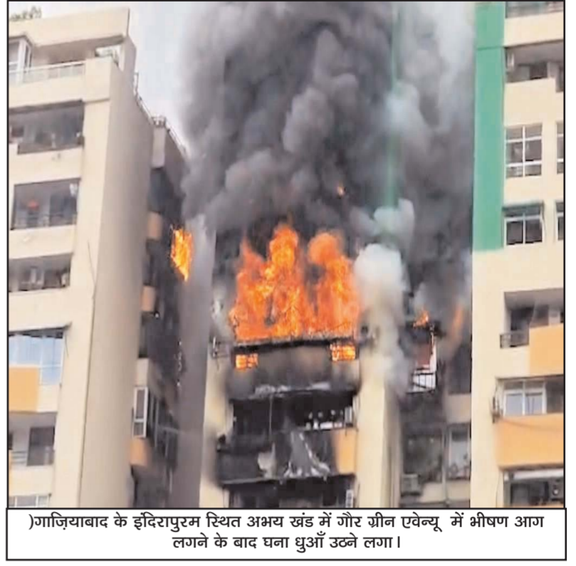
गजियाबाद के हदिरापुरम स्थित अभय खंड में गौर ग्रीन एवेन्सू में भीषण आग लगने के बाद घना धुआं उठने लगा।

यहां वे 594 किलोमीटर लंबे गंगा एक्सप्रेस-वे का उद्घाटन करेंगे, जो मेरठ को प्रयागराज से जोड़ने वाला देश के सबसे लंबे एक्सप्रेस-वे में से एक होगा।