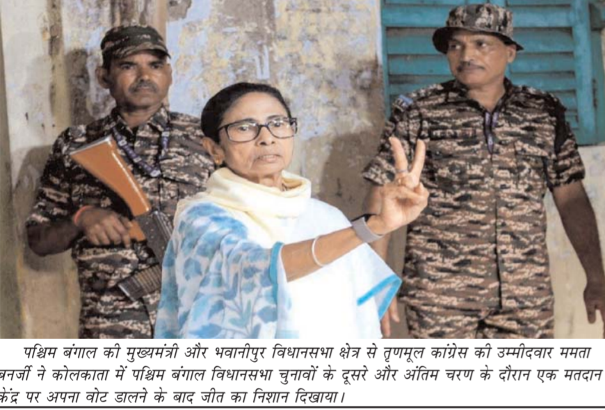
पश्चिम बंगाल की मुख्यमंत्री और भवानीपुर विधानसभा क्षेत्र से तृणमूल कांग्रेस की उम्मीदवार ममता बनर्जी ने कोलकाता में पश्चिम बंगाल विधानसभा चुनावों के दूसरे और अंतिम चरण के दौरान एक मतदान केंद्र पर अपना वोट डालने के बाद जीत का निशान दिखाया।

है। आंकड़ों के मुताबिक, मुबाराज जहाज फिलहाल चीन की ओर बढ़ रहा है और मई के पहले सप्ताह में इसके भारत पहुंचने की पूरी संभावना है। आखिर एलएनजी क्या है और होर्मुज पर क्यों मचा है कोहराम? एलएनजी यानी द्रवीकृत प्राकृतिक गैस (Liquefied Natural Gas) भारत की ऊर्जा आपूर्ति श्रृंखला की रीढ़ मानी जाती है। प्राकृतिक गैस को -162 डिग्री सेल्सियस तक ठंडा करके तरल रूप में बदला जाता है, जिससे इसका आयतन काफी कम हो जाता है और जहाजों के जरिए इसे लंबी दूरी तक सुरक्षित ले जाना आसान हो जाता है। हालांकि इसका सीधा इस्तेमाल घरों में नहीं होता, लेकिन यह देश की पूरी गैस आपूर्ति प्रणाली को ऊर्जा प्रदान करने का काम करती है। हाल ही में ईरान ने होर्मुज जलडमरूमध्य से सभी व्यापारिक जहाजों की आवाजाही पर रोक लगाकर वैश्विक ऊर्जा बाजार में भारी हड़कंप मचा दिया था। इसके जवाब में अमेरिका ने भी इस अहम मार्ग पर कड़ी नाकाबंदी कर दी थी।