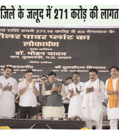
खरगोन जिले के जलूद में 271 करोड़ की लागत से बने 60 मेगावाट के सौलर पॉवर प्लांट का हुआ लोकार्पण

भोपाल (आरएनएस)। मुख्यमंत्री डॉ. मोहन यादव ने कहा है कि जलूद सौलर पॉवर प्लांट का लोकार्पण मध्यप्रदेश के साथ देशभर के लिए महत्वपूर्ण है। यहां सूर्य के प्रकाश को बिजली के रूप में बदलकर इंदौर नगर निगम लाभान्वित हो रहा है। लगभग 60 मेगावाट क्षमता की इस परियोजना में भारत सरकार की ओर से पूर्ण सहयोग मिला है। ग्रीन बॉन्ड स्कीम के माध्यम से इस परियोजना में देश की जनता को भागीदार (पार्टनर) बनाया है। पीपीपी मोड में कार्य करने वाला यह अपनी तरह का देश का प्रथम संयंत्र है। इस तरह से इस राष्ट्रीय उपलब्धि का श्रेय मध्यप्रदेश को जाता है। मुख्यमंत्री डॉ. यादव खरगोन जिले में महेश्वर के