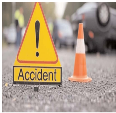
लागभग ढाई घंटे की कड़ी मशकत के बाद सभी पांचों लोगों को बाहर निकाला गया, लेकिन तब तक उनकी मृत्यु हो चुकी थी। जानकारी के मुताबिक, गोरखपुर जिले के निवासी अपनी बेटी की शादी के मिलसिले में झारखंड के रांची गए थे। शादी संपन्न होने के बाद वह अपने