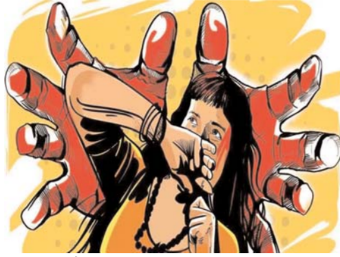
– रात के समय किया था रुम बुक

भोपाल (ए.)। नये शहर के कोलाह थाना इलाके में एक होटल में रिसेप्शनिस्ट की नौकरी करने वाली युवती के साथ आरोपी महिला द्वारा अपने बेटे और बेटे के दोस्त से उसी होटल में रेप कराया जाने का सनसनीखेज मामला सामने आया है। आरोपी महिला इसी होटल की पूर्व रिसेप्शनिस्ट है। उसने अपने बेटे और बेटे के दोस्त के साथ योजना बनाते हुए पहले दोनों को होटल भेजा और रुम बुक कराया। रुम में जाने के बाद आरोपी बेटे और उसके दोस्त ने रुम में पानी न आने की समस्या बताई। जब पीड़िता युवती कमरे में पानी चेक करने पहुंची तब आरोपियों ने उसे होटल के कमरे में ही बंधक बनाकर बारी-बारी से उसके साथ ज्यादती कर डाली। इसके बाद आरोपी पूर्व रिसेप्शनिस्ट महिला होटल के कमरे में पहुंची और पीड़िता को घटना के संबंध में किसी को भी बताने पर जान से मारने की धमकी दी। इतना ही नहीं महिला ने दोनों युवकों को मदद से पीड़िता को होटल से जबरदस्ती अगवा किया तीनों उसे स्टेशन बजरिया इलाके में ले गये और यहाँ पीड़िता के साथ मारपीट की गई। आरोपी महिला ने पीड़िता से कहा कि मेरे बाँयफ्रेंड से दूर रहो। बताया गया है कि आरोपी और पीड़ित महिलाओं का एक होटल मालिक से अफेयर है, जो इन दिनों शहर से बाहर है। पीड़िता और होटल मालिक को फोन पर बातचीत होती है।