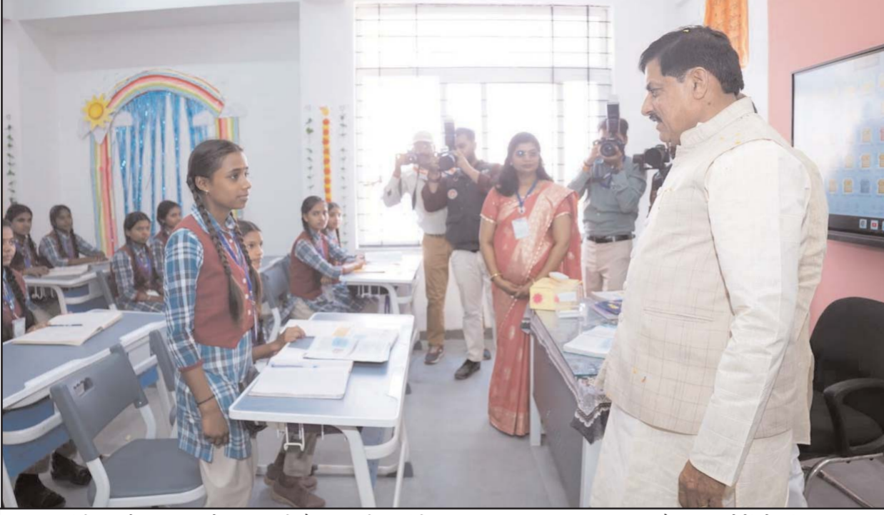
मुख्यमंत्री डॉ. मोहन यादव ने नरयावली के शासकीय सांदीपनि उच्चतर माध्यमिक विद्यालय के विद्यार्थियों से संवाद किया