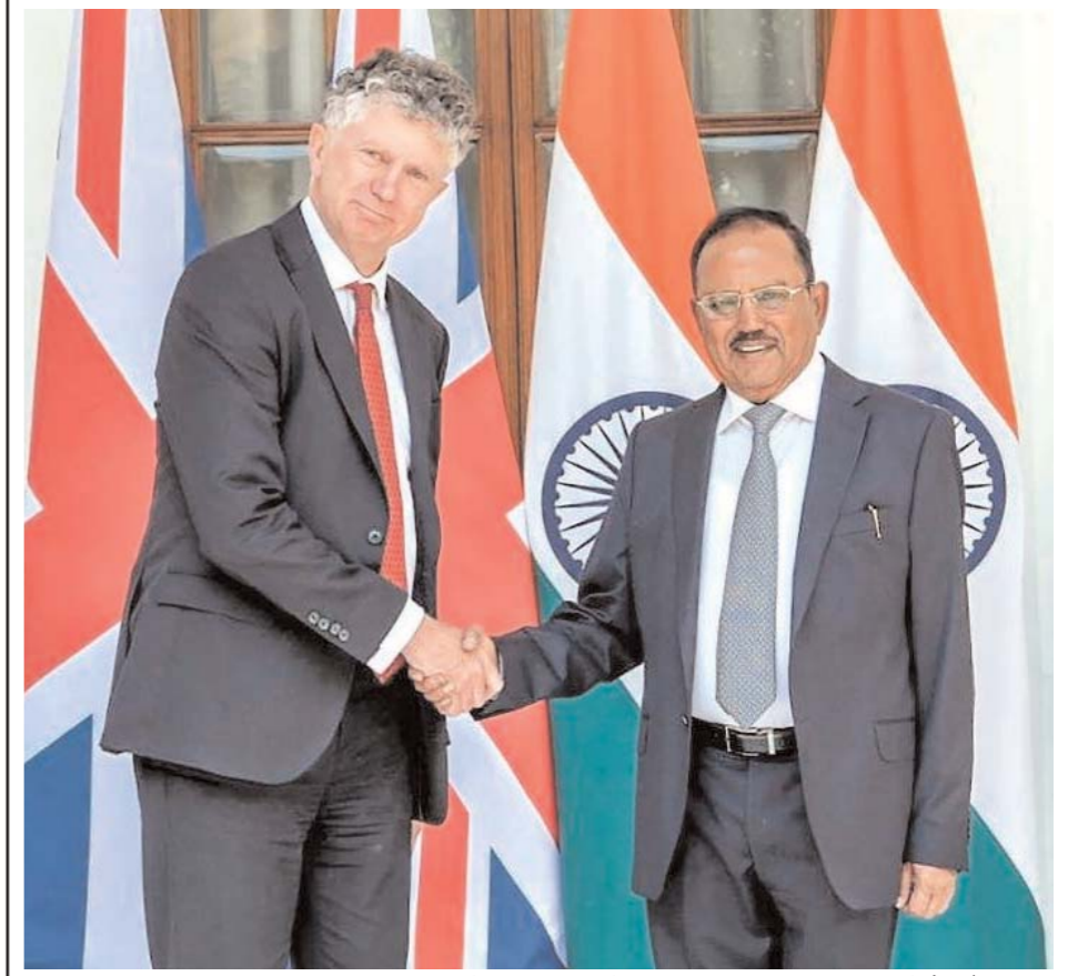
राष्ट्रीय सुरक्षा सलाहकार अजीत डोभाल ने नई दिल्ली में वार्षिक भारत-ब्रिटेन रणनीतिक वार्ता के दौरान अपने ब्रिटिश समकक्ष जोनाथन पॉवेल से मुलाकात की।