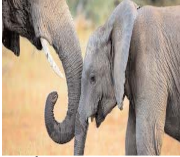
(16 अप्रैल हाथी बचाओ दिवस पर विशेष आलेख)

बहरहाल, यदि हम यहां पर हाथियों से संबंधित आंकड़ों की बात करें तो मानव-हाथी संघर्ष की उपस्थिति मुख्य रूप से कर्नाटक, असम, केरल, तमिलनाडु और ओडिशा में पाई जाती है। प्रोजेक्ट एलिफेंट