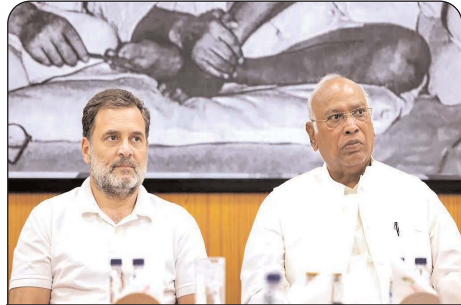
नई दिल्ली में खड़गो के आवास पर इंडिया ब्लॉक की बैठक के दौरान कांग्रेस अध्यक्ष और राज्यसभा में विपक्ष के नेता मल्लिकार्जुन खड़गो और लोकसभा में विपक्ष के नेता राहुल गांधी।