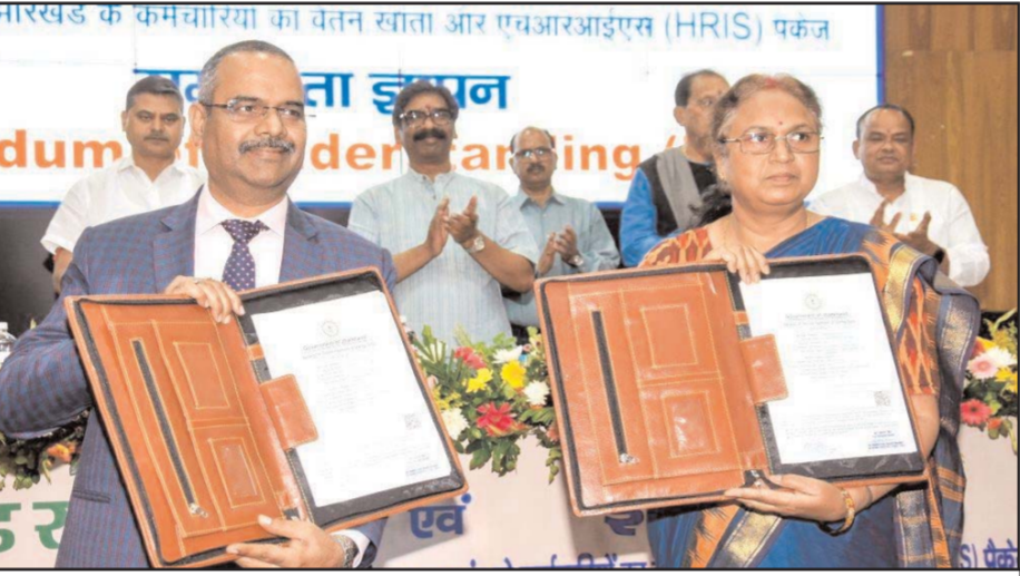
रांची के प्रोजेक्ट बिल्डिंग में आयोजित समझौता ज्ञापन हस्ताक्षर समारोह के दौरान, झारखंड के मुख्यमंत्री हेमंत सोरेन और वित्त मंत्री राधा कृष्ण किशोर की उपस्थिति में, झारखंड सरकार और इंडियन बैंक के अधिकारियों ने समझौता ज्ञापन का आदान-प्रदान किया।