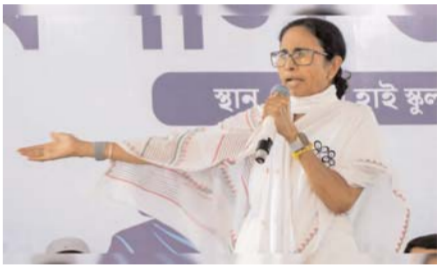
को तोड़ने में कभी कामयाब न हो। ममता बनर्जी ने अंत में कहा, आप सब ठीक रहें और सेहतमंद रहें। आने वाले विधानसभा चुनावों में अपने डेमोक्रेटिक अधिकारों को बनाए रखने के लिए दिव्य फलावर्स निशान के लिए अपना वोट दें और तुणमूल कांग्रेस के सभी नॉमिनेटेड उम्मीदवारों की शानदार जीत पक्की करें।

कोलकाता, (आरएनएस)। पश्चिम बंगाल की मुख्यमंत्री ममता बनर्जी ने बुधवार को सोशल मीडिया प्लेटफॉर्म फेसबुक पर एक वीडियो पोस्ट करते हुए राज्य के लोगों को बंगाली नववर्ष की शुभकामनाएं दीं। यह पर्व बंगाली कैलेंडर के पहले महीने (बैसाख) के पहले दिन मनाया जाता है, जिसे पोइला बैसाख के नाम से जाना जाता है। मुख्यमंत्री ममता बनर्जी ने अपने पोस्ट में एक भावनात्मक कविता भी साझा की, जिसमें नए साल के आगमन और पुराने साल को कड़वाहट को पीछे छोड़ने की बात कही गई। उन्होंने लिखा, आओ, आओ, आओ हे वैशाख तपती धासों की हवा से हताशाएं उड़ जाए, वर्ष भर की वर्जनाएं दूर हो जाए। ममता बनर्जी ने कहा, मैं अपने दिल की गहराइयों से राज्य के कोने-कोने में रहने वाले लोगों को बंगाली नए साल की हार्दिक शुभकामनाएं देती हूँ। एक नए युग की इस नई सुबह में आप सभी का जीवन सभी गंदगी और दुखों से आजाद हो। नए वर्ष के इस आह्वान में हर आत्मा पवित्रता से भर जाए। उन्होंने कहा, जैसे हमारा बंगाल कला और संस्कृति का एक पवित्र स्थान है, वैसे ही यह धार्मिक सद्भाव का भी एक पवित्र घर है। कुछ बुरी ताकतों ने इस बंगाल को गंदा करने की कोशिश की है। दिल्ली की कुछ शक्तियां लोगों का वोट छीनने की कोशिश कर रही हैं। हमें उन्हें लोकतांत्रिक तरीकों से जवाब देना होगा। उन्होंने लोगों से अपील करते हुए कहा, नव वर्ष के इस पवित्र दिन पर हम सब मिलकर एक वादा करें कि हम छोटी सोच की सभी दीवारें तोड़ देंगे और खुलकर सामने आएं। कोई भी बांटने वाली या तानाशाही ताकत हमारी हमेशा रहने वाली शांति, हमारे पारंपरिक मेलजोल या भाईचारे के हमारे बंधन