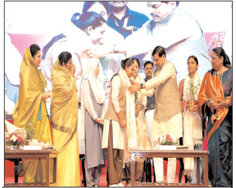
मुख्यमंत्री डॉ. मोहन यादव ने रविंद्र भवन में नारी शक्ति वंदन कार्यक्रम - प्रबुद्ध जन सम्मेलन में 10वीं और 12वीं बोर्ड की टॉपर बालिकाओं को श्रीफल और अंगवस्त्र से सम्मानित किया