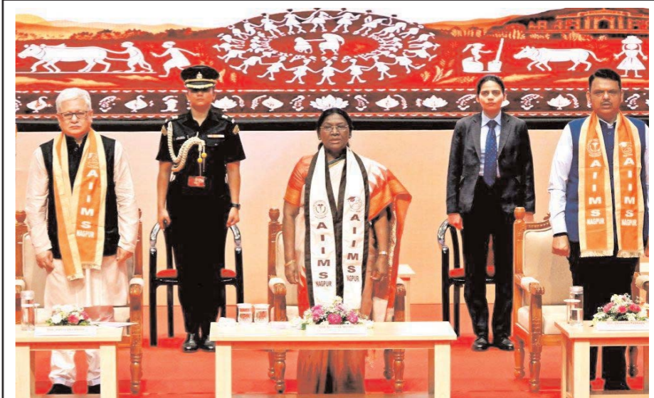
नागपुर में अखिल भारतीय आयुर्विज्ञान संस्थान के दीक्षांत समारोह के दौरान राष्ट्रपति द्रौपदी मुर्मू, महाराष्ट्र के राज्यपाल जिष्णु देव वर्मा और मुख्यमंत्री देवेंद्र फडणवीस।

नई दिल्ली (आरएनएस)। राष्ट्रीय राजधानी क्षेत्र में मजदूरों की बढ़ती नाराजगी के बीच, सेंटर ऑफ इंडियन ट्रेड यूनियंस ने गुरुवार को देश भर में विरोध प्रदर्शन का ऐलान किया है। इसमें मजदूरों से अपील की गई है कि वे इंडस्ट्रियल एरिया और फैक्ट्री इकाइयों में चल रही हड़तालों के साथ एकजुटता दिखाएं। ट्रेड यूनियन का यह आह्वान ऐसे समय में आया है जब मजदूरों की हालत, मजदूरी और नौकरी की सुरक्षा को लेकर नाराजगी बढ़ रही है, और कई मजदूर रूढ़िवादी पक्षों से ही प्रदर्शन कर रहे हैं।