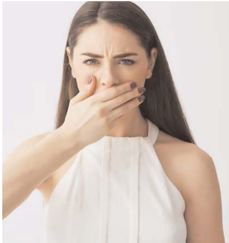
आपका मुंह ताजा बना रहता है।

धूप में बिना लिप बाम लगाए बाहर निकलना भी एक बड़ी गलती हो सकती है क्योंकि सूरज की किरणों आपके होंठों को नुकसान पहुंचा सकती हैं। इसलिए जब भी आप घर से बाहर जाएं तो अपने होंठों पर सूरज से बचाने वाला लिप बाम जरूर लगाएं ताकि वे सूरज की किरणों से सुरक्षित रहें। इन छोटी-छोटी बातों का ध्यान रखकर आप अपने होंठों को हमेशा सुंदर और स्वस्थ रख सकते हैं।