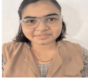
द्वितीय श्रेणी में उत्तीर्ण 2 टॉपर्स

कुल विद्यार्थी 26 प्रथम श्रेणी में उत्तीर्ण 24