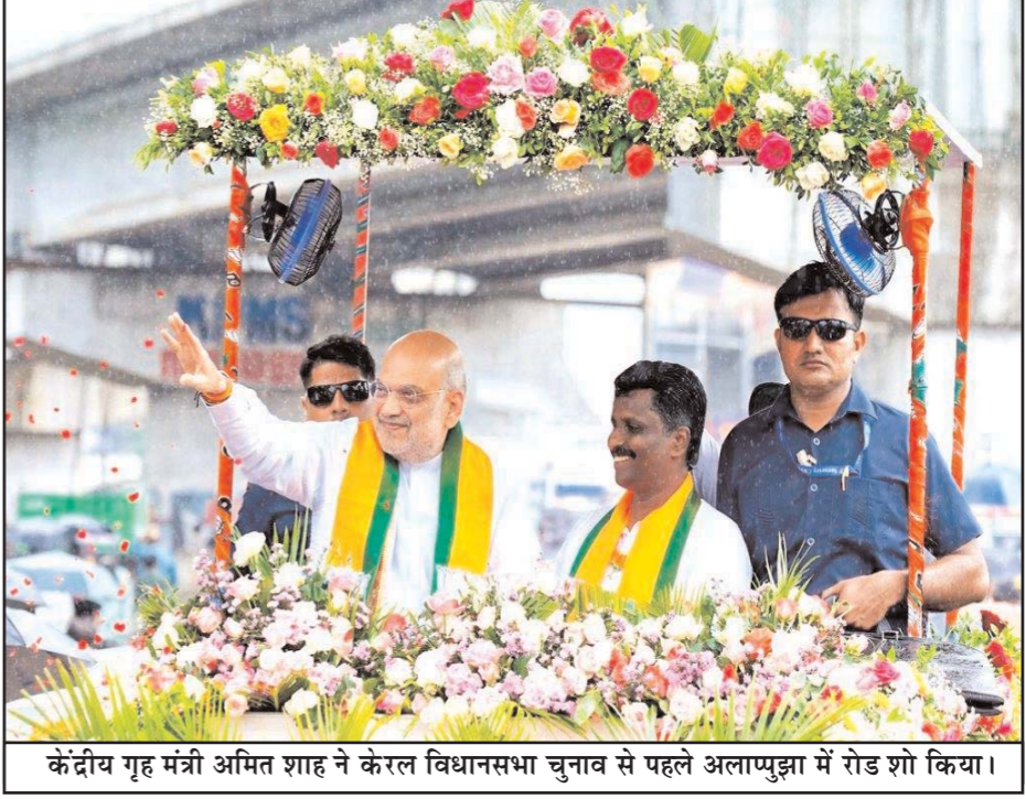
केंद्रीय गृह मंत्री अमित शाह ने केरल विधानसभा चुनाव से पहले अलाप्पुझा में रोड़ शो किया।

नई दिल्ली (आरएनएस)। ईरान पर 28 फरवरी को हुए हमले के बाद से स्ट्रेट ऑफ होर्मुज से तेल और गैस लेकर आने-जाने वाले कई जहाज फंस गए। कई जहाजों पर ईरान की ओर हमले भी किए गए और होर्मुज को बंद कर दिया गया। इस बीच लाने की मांग की थी। विपक्ष ने उन पर पक्षपातपूर्ण व्यवहार का आरोप लगाया। उनके खिलाफ सात गंभीर आरोप लगाए गए थे। इनमें दफ्तर में पक्षपातपूर्ण और भेदभावपूर्ण रवैया, दुर्व्यवहार, चुनावी धोखाधड़ी और वोट देने का अधिकार छीनना जैसे आरोप थे। विपक्षी दलों ने विशेष रूप से बिहार और पश्चिम बंगाल में वोटर लिस्ट के स्पेशल इंटेंसिव रिवीज्ण अभियान को लेकर सवाल उठाए थे। उनका दावा था कि इस प्रक्रिया के कारण कई वोटों का वोट देने का अधिकार छिन गया। इन आरोपों के समर्थन में सुप्रीम कोर्ट के कई फैसलों का हवाला भी दिया गया था।