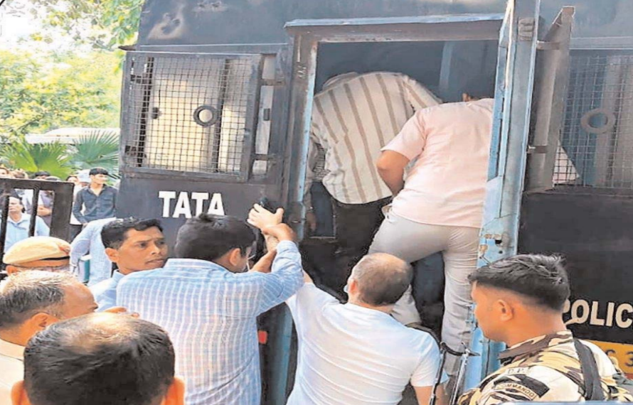
नई दिल्ली में पटियाला हाउस कोर्ट स्थित राष्ट्रीय जांच एजेंसी की एक विशेष अदालत ने मिर्ज़ोरम में कथित अवैध प्रवेश, म्यांमार के विद्रोही समूहों से संबंधों और ड्रोन छरीदने के संदेह से जुड़े एक मामले में सात आरोपियों-जिनमें छह यूक्रेनी नागरिक और एक अमेरिकी नागरिक शामिल हैं-को 3 दिनों की न्यायिक हिरासत में भेज दिया है।

ले जाने वाली मालगाड़ियों का नियमित रूप से संचालन अभी भी नहीं किया जाता है। हालांकि फ्लाईओवर, पुलों और सुरंगों के निर्माण के कारण श्रीनगर और जम्मू के बीच यात्रा का समय पहले के 10 घंटे से घटकर पांच घंटे हो गया है, फिर भी रामगढ़ और रामबन शहर के बीच का राजमार्ग का हिस्सा इस राजमार्ग का सबसे संवेदनशील भाग बना हुआ है। इस क्षेत्र में बारिश के कारण भूस्खलन, कीचड़ का भूस्खलन और पत्थर गिरने जैसी घटनाएं होती हैं, जिससे यातायात अवरुद्ध हो जाता है। 2025 में, घाटी में फल उत्पादकों को राजमार्ग की लगातार नाकाबंदी के कारण भारी नुकसान उठाना पड़ा, क्योंकि राष्ट्रीय बाजारों में फल ले जाने वाले ट्रक फंसे रहे। उत्तरी रेलवे अधिकारियों ने हाल ही में हितधारकों के साथ बैठक की है ताकि इस वर्ष घाटी से फलों के परिवहन के लिए मालगाड़ी शुरू की जा सके। पार्सल सेवा शुरू होने के बाद कश्मीर के बागवानी उद्योग को बहुत जरूरी सहायता मिलेगी।