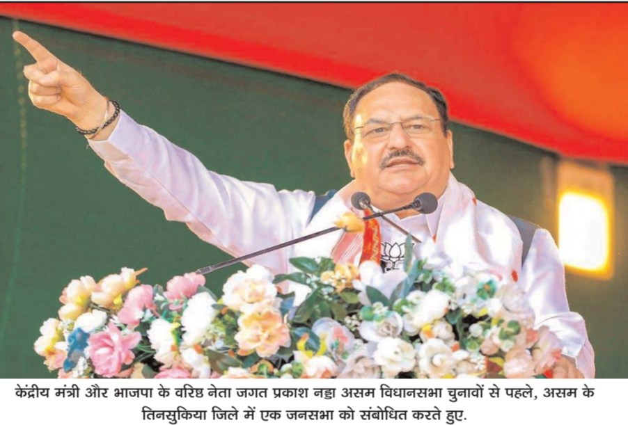
केंद्रीय मंत्री और भाजपा के वरिष्ठ नेता जगत प्रकाश नहा असम विधानसभा चुनावों से पहले, असम के तिनसुकिया जिले में एक जनसभा को संबोधित करते हुए।

अपनी मां मानते हैं। पीएम मोदी ने कहा कि हमारा मिशन अभी भी जारी है और हमारा लक्ष्य विकसित भारत का निर्माण करना है। इसकी प्राप्ति के लिए हम निस्वार्थ भाव से लगे रहने वाले हैं। भाजपा के स्थापना दिवस के अवसर पर कार्यकर्ताओं को बधाई देकर पीएम मोदी ने कहा कि भारतीय जनता पार्टी नेशन फ्रंट (राष्ट्र प्रथम) के मंत्र के साथ काम करती है। उन्होंने कांग्रेस के शीर्ष नेतृत्व पर निशाना साधकर कहा कि दिल्ली में बैठे शाही परिवार के नामदारों की हार की संचुरी का रिकॉर्ड इस बार असम के लोग ही बनवाएंगे। कांग्रेस कभी अपना रिपोर्ट कार्ड लेकर जनता के बीच नहीं जाती, जबकि हम साफ नीयत के साथ पाई-पाई का हिसाब देते हैं।