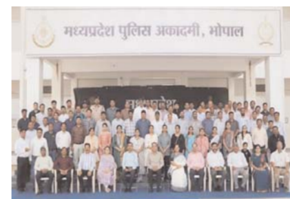
आधार बताते हुए अधिकारियों को नियमों की स्पष्ट समझ विकसित करने पर बल दिया। सेमिनार में प्रदेश की विभिन्न पुलिस इकाइयों से आए प्रतिभागियों के साथ-साथ प्रशिक्षणरत 44वें उप पुलिस अधीक्षक बैच के अधिकारियों ने सक्रिय