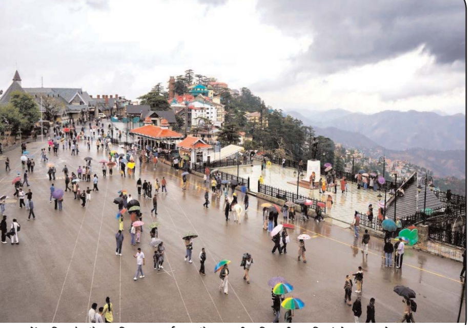
शिमला में बाशिंश के दौरान रिज पर पर्यटक और स्थानीय निवासी छतरियां लेकर चलते हुए।