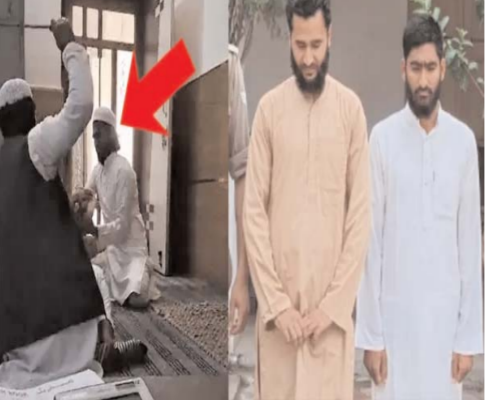
शिक्षा के नाम पर दी जाने वाली अमानवीय सजा की खौफनाक हकीकत को उजागर कर दिया है। इस शर्मनाक घटना में क्रूरता की हदें तब और पार हो गईं जब वहां मौजूद एक तीसरे व्यक्ति ने बच्चे को बचाने के

सहारनपुर, (आरएनएस)। उत्तर प्रदेश के सहारनपुर जिले से इसानियत को शर्मसार कर देने वाली एक बेहद खौफनाक घटना सामने आई है। यहां के एक मदरसे में पढ़ाई करने वाले एक मासूम बच्चे के साथ तालिबानी क्रूरता की गई है। इस हैवानियत का एक वीडियो सोशल मीडिया पर तेजी से वायरल हो रहा है, जिसे देखकर किसी का भी दिल दहल जाए। वायरल वीडियो में साफ दिखाई दे रहा है कि मदरसे के शिक्षक एक मासूम बच्चे के पैर पकड़कर उसे उल्टा लेटा देते हैं और फिर उस पर बेरहमी से छड़ियों की बारिश कर देते हैं।