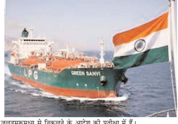
जलडमरूमध्य से निकलने के आदेश की प्रतीक्षा में हैं। इस बीच एक विदेशी जहाज, जो कथित तौर पर ईरान से भारत के लिए तेल ले जा रहा था, उसने अपनी यात्रा के दौरान ही अपना डेस्टिनेशन प्वाइंट अचानक बदल दिया। अब वह चीन की ओर बढ़ रहा है। वैश्विक विश्लेषण फर्म के बंपलर के प्रमुख विश्लेषक ने कहा कि ईरानी कच्चे तेल

विशेषज्ञों के मुताबिक एलपीजी से लदे ये दोनों जहाज ग्रीन आशा और जग विक्रम भी जल्द ही होर्मुज से निकलकर भारत की ओर रवाना हो सकते हैं। जानकारों ने बताया कि तीन एलपीजी ले जाने वाले भारतीय जहाज वर्तमान में फारस की खाड़ी स्थित अबू मूसा द्वीप के उत्तर-पूर्व में भटक रहे हैं। वे भारतीय नौसेना के निर्देशों का पालन करते हुए होर्मुज