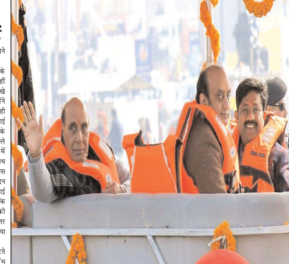
रक्षा मंत्री राजनाथ सिंह और भाजपा के राज्यसभा सांसद सुभांशु त्रिवेदी ने प्रयागराज में 45 दिवसीय महाकुंभ मेला 2025 के छठे दिन गंगा, यमुना और पौराणिक सरस्वती नदियों के संगम त्रिवेणी संगम पर नाव की सवारी की।

रायपुर, (आरएनएस)। सरकार बही जिसे जनता की फिक्र हो, परख को हर कसौटी पर खरा उतरने वाली छत्तीसगढ़ की विष्णु देव साय सरकार ने राज्य की जनता का दर्द और उनकी ज़रूरतों को समझा है। सरकार का प्रमुख उद्देश्य समाज के हर वर्ग को समान अवसर प्रदान करना और रोजगार के क्षेत्र में आने वाली बाधाओं को कम करना ही होता है। मुख्यमंत्री विष्णुदेव साय की सरकार ने पुलिस विभाग सहित अन्य शासकीय भवित्यों में अधिकतम आयु सीमा में 05 वर्ष की छूट प्रदान कर इस दिशा में एक सकारात्मक और दूरगामी कदम उठाया है। यह निर्णय समाज के उन वर्गों को राहत पहुंचा रहा है जो उम्र सीमा के कारण रोजगार के अवसरों से वंचित रह गए थे। प्रदेश में बेरोजगारी लंबे समय से एक बड़ी समस्या रही है। ऐसी दशा में जो उम्मीदवार केवल आयु सीमा के कारण सरकारी भवित्यों से वंचित रह जाते हैं उनके दुःख को राज्य के मुखिया ने बहुत नज़दीक से समझा है। यह छूट विशेष रूप से उन युवाओं के लिए राहत प्रदान करती है, जो थोड़े अधिक उम्र के हो गए हैं मगर उनके पास नौकरी के लिए आवश्यक कौशल और योग्यता है।