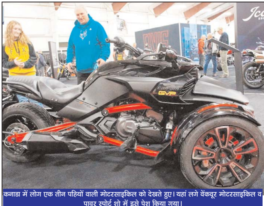
कनाडा में लोग एक तीन पहियों वाली मोटरसाइकिल को देखते हुए। यहां लगे वेंकटूर मोटरसाइकिल व पावर्ट स्पोर्ट शो में इसे पेश किया गया।

नई दिल्ली (ए)। सेबी ने एक बड़ा कदम उठाते हुए सात कंपनियों को बाजार से प्रतिबंधित कर दिया है। इन कंपनियों में पांचली इंडस्ट्रियल फाइनेंस, अभिजीत ट्रेडिंग, कैलिक्स सिक्स्योरिटीज, हिबिक्स हॉल्डिंग्स, अबल फाइनेंशियल सर्विसेज, एडॉप्टिका रिटेल इंडिया और सल्फर सिक्स्योरिटीज शामिल हैं। सेबी ने कहा की पांचली इंडस्ट्रियल ने गैर-प्रवर्तकों के रूप में वार्गुत्कृत छह संस्थाओं से 1,000 करोड़ कर्ज लिया, जिसे तरजीही आवंटन के जरिये इकट्टी में बदल दिया। लेकिन कर्ज और पैसा सिर्फ कागजों में घुमाया गया। जिनके दिखावे कर्ज देने के थे, उन्हें कंपनी के 99.28 फीसदी शेयर मिल गए।