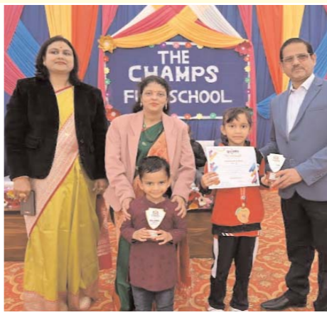
कार्यक्रम में उपस्थित होकर कार्यक्रम की गरिमा बढ़ाने का आह्वान किया है।