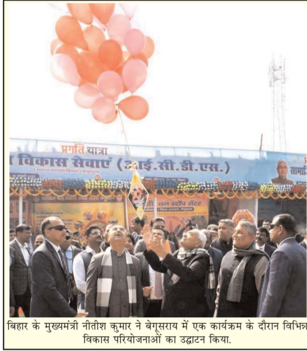
बिहार के मुख्यमंत्री नीतीश कुमार ने बेगूसराय में एक कार्यक्रम के दौरान विभिन्न विकास परियोजनाओं का उद्घाटन किया।