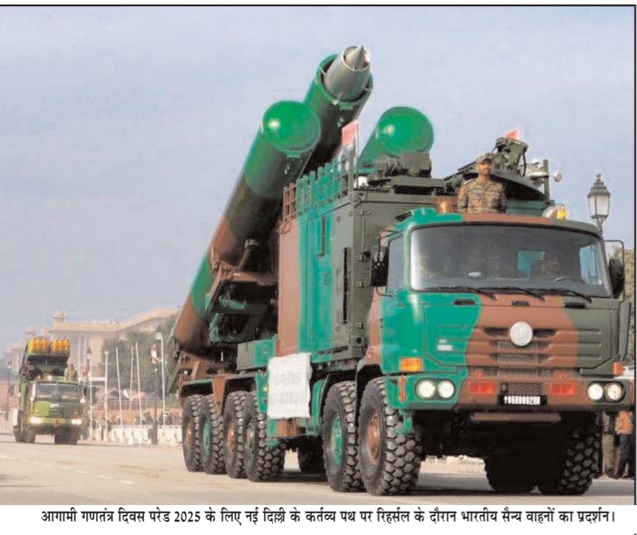
आगामी गणतंत्र दिवस परेड 2025 के लिए नई दिल्ली के कर्तव्य पथ पर रिहसल के दौरान भारतीय सैन्य वाहनों का प्रदर्शन।

नुकसान पहुंचाना चाहते हैं। हाल ही में जर्मनी में इस तरह का अटैक हुआ था जिसमें कुछ लोगों की मौत हो गई थी, वहीं 300 से ज्यादा लोग घायल हो गए थे। यही नहीं पिछले महीने में कई देशों में वीकल रेमिंग अटैक के जरिये भारी वाहनों से भीड़ पर आत्मघाती हमले किए गए हैं इस व्हीकल रेमिंग अटैक के अलर्ट के मद्देनजर दिल्ली पुलिस की तमाम यूनिट्स को सख्त निर्देश दिए गए हैं। खासकर जहां सड़कों पर ज्यादा भीड़ होती है जिन सड़कों पर वाहनों की स्पीड काफी तेज होती है और बड़े वाहनों के मूवमेंट उनकी गतिविधियों पर भी खासी नजर रखी जाएगी। इस बार 26 जनवरी को लेकर ड्रोन हमले का अलर्ट जारी किया गया है इस बार 26 जनवरी के मद्देनजर एंटी ड्रोन टेक्नोलॉजी का और व्यापक तरीके से इस्तेमाल भी किया जा रहा है। दरअसल वीकल रेमिंग अटैक को एक ऐसा हमला भी कहा जाता है जिसमें कोई शख्स जानबूझकर वाहन का इस्तेमाल कर लोगों को भीड़ को चोट पहुंचाने या मारने की कोशिश करता है। ऐसे हमले आमतौर पर भीड़-भाड़ वाले इलाकों, बाजारों या सार्वजनिक आयोजनों में किए जाते हैं।