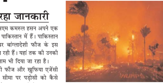
इलाकों से निकाली आदेशों हटाए भी गए हैं। समाचार एजेंसी सिन्हुआ की रिपोर्ट के मुताबिक, स्थानीय अधिकारियों ने बताया कि एक हफ्ते से ज्यादा समय बाद दक्षिणी कैलिफोर्निया में जंगल की आग की वजह से कम से कम 27 लोगों की जान चली गई है और 12,300 से ज्यादा इमारतें जलकर नष्ट हो गई हैं लॉस एंजिल्स क्षेत्र में सबसे बड़ी सक्रिय जंगल की आग, पैलिसेड्स फायर ने 23,713 एकड़ (95.96 वर्ग किमी) को जला दिया है। 7 जनवरी को लगी आग पर 31 प्रतिशत काबू पा लिया गया है। कैलिफोर्निया के वानिकी और अग्नि सुरक्षा विभाग (केल फायर) ने शुक्रवार सुबह एक अपडेट में कहा, रात भर और आज सुबह ठंडा मौसम, हल्की हवाएं और अच्छी नमी रही। आग अब उन क्षेत्रों के आसपास फैल रही है, जो नियंत्रित हैं, ताकि लोगों और आपातकालीन कर्मियों को सुरक्षा सुनिश्चित की जा सके कैलिफोर्निया के वानिकी और अग्नि सुरक्षा विभाग (केल फायर) ने शुक्रवार सुबह एक अपडेट में कहा, रात भर और आज सुबह, ठंडा तापमान, हल्की हवाएं और अच्छी आर्द्रता देखी गई। उन्होंने आगे कहा कि कर्मचारी नियंत्रित क्षेत्रों के भीतर इमारतों के आसपास आग के प्रसार को कम करने के लिए नियंत्रण रेखाएं स्थापित करने और उनमें सुधार करने के साथ-साथ जनता को सुरक्षा सुनिश्चित करने का काम जारी रखे हुए हैं।

बांग्लादेशी सेना के अफसरों को यह गुर सीखाने का मतलब है कि आने वाले दिनों में भारत बांग्लादेश सीमा पर कोई बड़ी घटना हो सकती है। इसके पीछे पूरी तरह से दिमाग पाकिस्तानी खुफिया एजेंसी का होगा। बताया जा रहा है कि इस उच्च सैन्य दल को वापसी के समय पाकिस्तान कुछ इलेक्ट्रॉनिक उपकरण भी उपलब्ध कराएगी इसके जरिए वे भारत बांग्लादेश सीमा पर अभ्यास करेंगे।