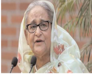
चली आई। नोबेल पुरस्कार विजेता मुहम्मद युनुस के नेतृत्व में बांग्लादेश में अंतरिम सरकार का गठन हुआ। शेख हसीना ने बीते दिनों को याद करते हुए कहा कि उन्हें मारने की साजिशें कई बार रची गईं। उन्होंने कहा, 'मुझे लगता है कि 21 अगस्त की हत्याओं से बचना या कोटलीपारा में बम से बच जाना और 5 अगस्त,