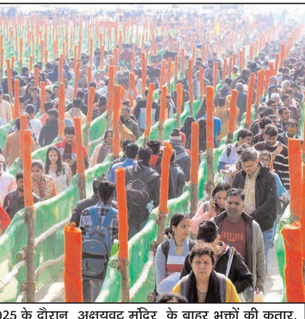
प्रयागराज में महाकुंभ मेला 2025 के दौरान अक्षयवट मंदिर के बाहर भक्तों की कतार.

मुंबई, (आरएनएस)। अभिनेता कार्तिक आर्यन ने सोशल मीडिया पर एक वीडियो साझा किया, जिसमें वह देश के पहले पैरालिंपिक स्वर्ण पदक विजेता मुर्लीकांत पेटकर को शानदार कहानी से फेंस और फॉलोअर्स को रूबरू करा रहे हैं। सोशल मीडिया पर सक्रिय अभिनेता ने इंस्टाग्राम पर फिल्म और अर्जुन अवॉर्ड से जुड़े वीडियो साझा करते हुए कैप्शन में लिखा, बड़े पद पर अपनी अविश्वसनीय जिंदगी जीने से लेकर आज राष्ट्रपति भवन में आपको 'अर्जुन लाइफटाइम अचीवमेंट अवॉर्ड' प्राप्त करते हुए देखना, अविश्वसनीय था। हर पल एक सपने जैसा था। अब हमारी फिल्म 'चंदू चैपियन' को अपना आदर्श अंत मिल चुका है (इसकी शुरुआत अर्जुन पुरस्कार के लिए आपकी लड़ाई से हुई थी)। अभिनेता ने आगे लिखा, आपको मैं जिता जानता हूँ सर उस आश्रय पर कह सकता हूँ कि यह क्लाइमैक्स नहीं हो सकता। आप प्रेरणा देते रहिए सर। इस ऐतिहासिक पल में कैद होकर गौरवान्वित हूँ। इसमें आप और देश की राष्ट्रपति भी हैं। आपको सलाम और सभी अर्जुन पुरस्कार विजेताओं को बधाई। मुर्लीकांत पेटकर को उनके शानदार योगदान के लिए शुक्रवार को प्रतिष्ठित अर्जुन अवॉर्ड (लाइफटाइम अचीवमेंट) से सम्मानित किया गया। अभिनेता का एक और वीडियो सोशल मीडिया पर वायरल हो रहा है, जिसमें कार्तिक भाला फेंक खिलाड़ी नवदीप सिंह के साथ मुलाकात करते नजर आए। वीडियो में उनके साथ निर्देशक कबीर खान भी दिखाई दिए।