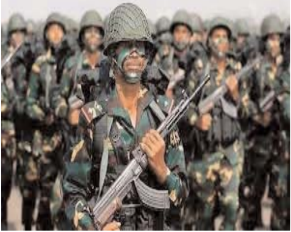
ढाका, (ए)। बांग्लादेश में सरकार बदलने के बाद पाकिस्तान उस पर ज्यादा ही मेहरबान हो रहा है। इसका ताजा उदाहरण हाल ही में देखने को मिला। पाकिस्तान की फौज पिछले तीन दिन से बांग्लादेशी सैनिकों को इनाम पर इनाम दे रही है। सूत्रों के मुताबिक बांग्लादेशी सैनिकों को इलेक्ट्रॉनिक वॉरफेयर और ड्रोन सिस्टम की जानकारी दी जा रही है, जिनके जरिए भारत-बांग्लादेश सीमा पर तबाही मचाई जा सकती है।