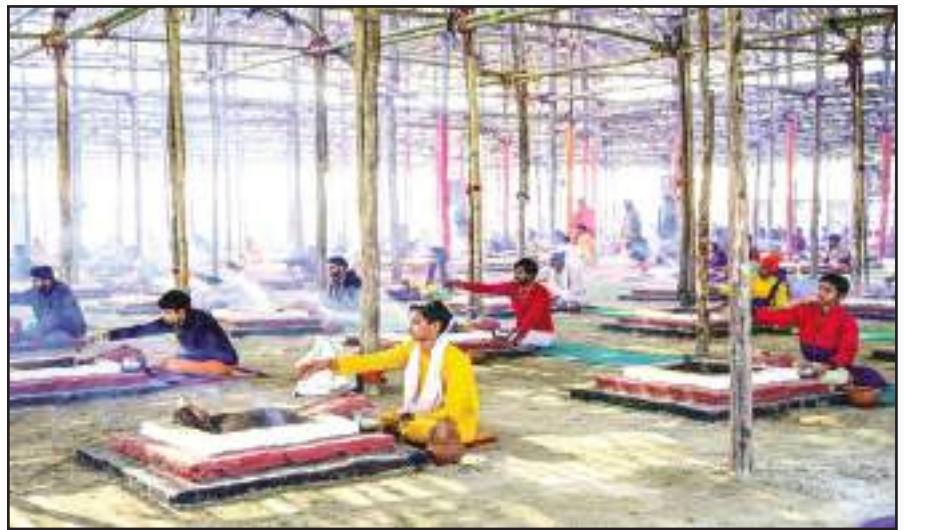
युवा साधु प्रयागराज में संगम पर महाकुंभ मेला 2025 के दौरान यज्ञ करते हुए।

ठाणे (आरएनएस)। पति-पत्नी का रिश्ता एक पवित्र बंधन माना जाता है, लेकिन महाराष्ट्र के ठाणे से एक बेहद शर्मनाक मामला सामने आया है। यहां एक व्यक्ति पर अपनी ही पत्नी का अश्लील वीडियो बनाकर उसे अपने दोस्त को भेजने का आरोप है। ठाणे जिले में अपनी पत्नी का शोषण करने, उसे परेशान करने और उस पर हमला करने के आरोप में 40 वर्षीय एक व्यक्ति को गिरफ्तार किया गया है। पुलिस ने रविवार को उल्हासनगर शहर से आरोपी को गिरफ्तार किया और सोमवार को इस घटना की जानकारी दी। पुलिस के अनुसार, आरोपी ने कथित तौर पर अपनी पत्नी को नशीला पदार्थ दिया और फिर उसकी आपत्तिजनक तस्वीरें लीं। इतना ही नहीं, उसने उन तस्वीरों को सोशल मीडिया पर अपने एक दोस्त को भी भेज दिया। अधिकारी ने बताया कि जब महिला ने इस बात का विरोध किया, तो आरोपी ने उसकी पिटाई भी की। महिला के अनुसार, इस घटना के बाद 17 जनवरी को उनके पति के उस दोस्त ने उन्हें फोन किया और उनसे अश्लील बातें कीं।