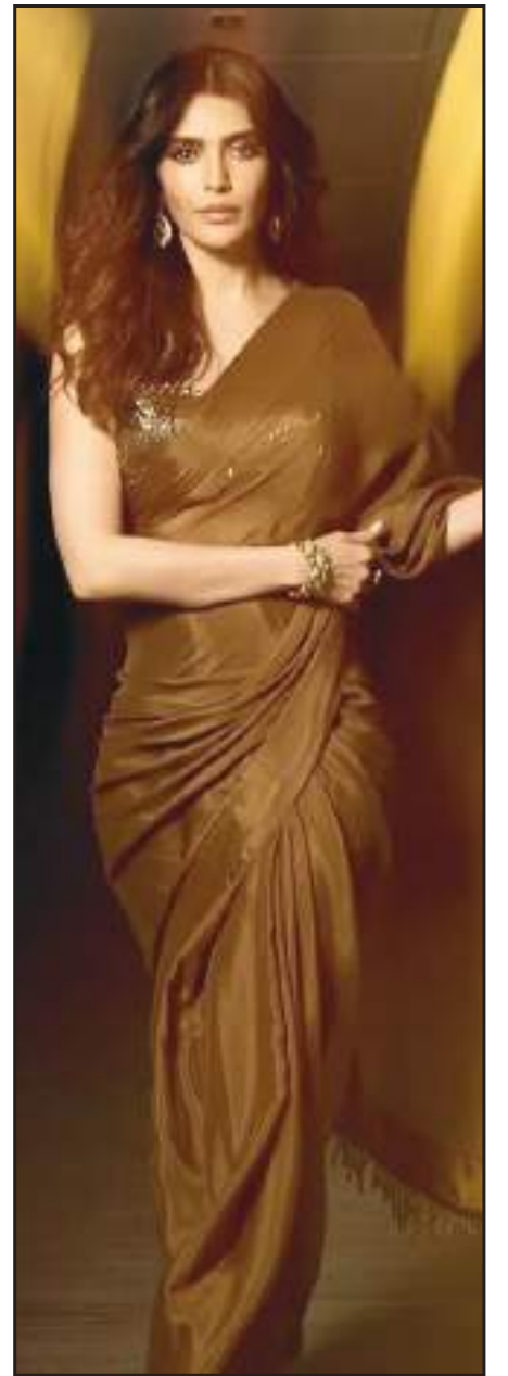
सकते हैं उन्होंने ब्राउन कलर की सिंपल साड़ी पहनी हुई है, जिसमें वो एक से बढ़कर एक पोज देती हुई नजर आ रही हैं।