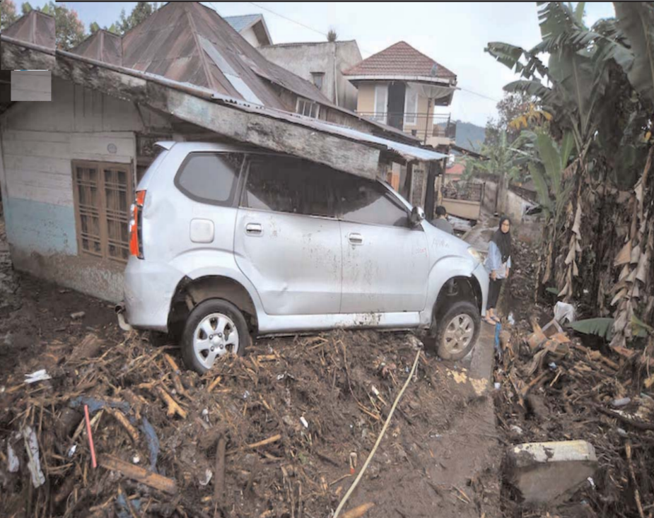
इंडोनेशिया में एक महिला भारी बारिश में क्षतिग्रस्त एक कार को देखती हुई।

पर जब हम खबरें देखते हैं कि भारत चांद पर पहुंच गया और उसके दो सेकेंड बाद ही खबर आती है कि कराची में खुले गटर में गिरकर बच्चे की मौत हो गई। एमक्यूएम नेता ने कराची में ताजा पानी की कमी का जिक्र करते हुए कहा कराची पाकिस्तान में राजस्व का इंजन है। देश में दो बंदरगाह हैं और दोनों कराची में हैं। एक तरह से यह देश का गेटवे है। 15 वर्षों से कराची को ताजा पानी नहीं मिला है, जब भी पानी आता है तो तो उसे टैंकर माफिया कब्जा लेते हैं।' सैयद मुस्ताफा कमाल ने एक रिपोर्ट का हवाला देते हुए कहा 'सिंध प्रांत में करीब 70 लाख बच्चे स्कूल नहीं जा रहे हैं और राष्ट्रीय स्तर पर यह आंकड़ा करीब 2.6 करोड़ है। कराची, सिंध प्रांत की ही राजधानी है।' मुस्ताफा कमाल ने कहा 'हमारे यहां कुल 48 हजार स्कूल हैं, लेकिन एक रिपोर्ट बताती है कि इनमें से 11 हजार स्कूल खाली पड़े हैं। देश में 2.62 करोड़ बच्चे स्कूल नहीं जा पा रहे। सैयद मुस्ताफा कमाल का यह बयान पाकिस्तान के ही एक अन्य वरिष्ठ नेता मौलाना फजलुर रहमान के उस बयान के बाद सामने आई है, जिसमें मौलाना फजलुर रहमान ने कहा था कि 'भारत पाकिस्तान साथ आजाद हुए थे, लेकिन आज वे (भारत) महाशक्ति बनने का खाब देख रहे हैं और हम दिवालियापन से बचने के लिए भीख मांग रहे हैं।'