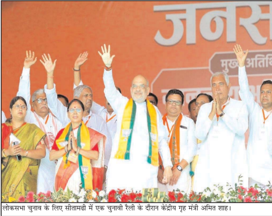
लोकसभा चुनाव के लिए सीतामढी में एक चुनावी रैली के दौरान केंद्रीय गृह मंत्री अमित शाह।

मुंबई (ए)। अपराध शाखा से जुड़े होने का दावा करने वाले छह लोग मुंबई के सायन इलाके में एक कैफे मालिक के घर में घुस गए और कथित तौर पर 25 लाख रुपये ले गए। एक अधिकारी ने बृहस्पतिवार को यह जानकारी दी। पुलिस ने इनमें से चार लोगों को गिरफ्तार कर लिया है। शहर के मादंगा इलाके में एक मशहूर कैफे के संचालक ने पुलिस को की गई शिकायत में बताया कि मंगलवार को छह लोग सायन अस्पताल के पास स्थित उनके घर आए और कहा कि वे मुंबई अपराध शाखा से हैं। अधिकारी ने शिकायत का हवाला देते हुए कहा कि उन लोगों ने दावा किया कि वे चुनाव ड्यूटी पर हैं और उन्हें जानकारी मिली है कि घर में धन रखा है जिसका इस्तेमाल लोकसभा चुनाव में किया जाएगा। मुंबई में लोकसभा चुनाव के पांचवें चरण में 20 मई को मतदान होगा। अधिकारी के अनुसार, कैफे व्यवसायी ने उन्हें बताया कि उसके पास अपने व्यवसाय से कमाए 25 लाख रुपये नकद हैं और इस पैसे का चुनाव से कोई लेना-देना नहीं है। हालांकि, छह आरोपियों ने उनसे पैसे ले लिए और उन्हें किसी अपराध में फंसाने की धमकी देकर वहां से चले गए। इसके बाद कैफे मालिक ने सायन पुलिस थाने में संपर्क किया। जांच के दौरान पुलिस ने चार आरोपियों को गिरफ्तार कर लिया। अधिकारी ने बताया कि पुलिस को इस अपराध में एक सेवानिवृत्त पुलिस कॉन्स्टेबल और पुलिस मोटर परिवहन विभाग के कर्मियों के शामिल होने का संदेह है।