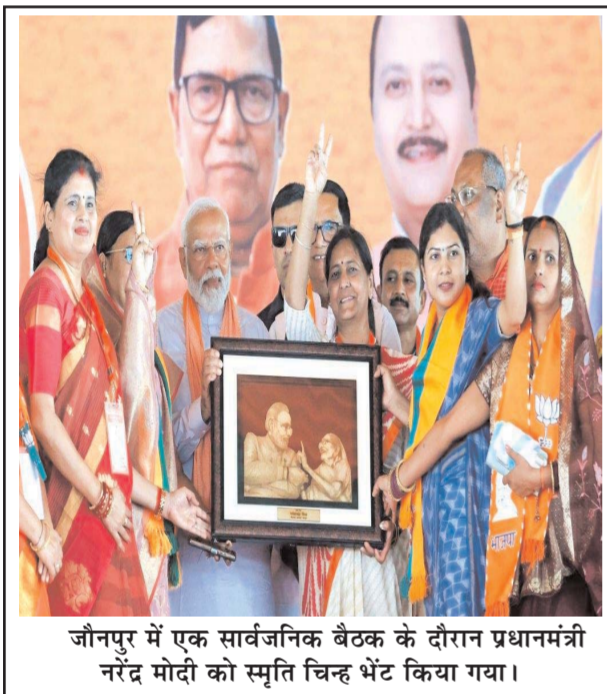
जौनपुर में एक सार्वजनिक बैठक के दौरान प्रधानमंत्री नरेंद्र मोदी को स्मृति चिन्ह भेंट किया गया।

संयुक्त राष्ट्र के महासचिव एंटीनियो गुटेरेश ने चेतावनी दी है कि राफा में जमीनी कार्रवाई बर्दाश्त नहीं की जाएगी लेकिन इस्त्राएली प्रधानमंत्री नेतन्याहू और उनके मंत्रिमंडल के सहयोगियों ने अपने कान बंद कर रखे हैं। इस्त्राएल के सैनिक अभियान से जाहिर होता है कि वह इसके जरिए अपने बंधकों को रिहा कराना और हमस के नेटवर्क को पूरी तरह ध्वस्त करना चाहता है। हालांकि सैन्य कार्रवाई के जरिए बंधकों को रिहाई आसान नहीं है। हकीकत यह है कि इससे बंधकों की जान को खतरा पहुंच सकता है। वास्तव में युद्ध-विराम और शांति समझौते के रास्तों पर आगे बढ़कर ही बंधकों की सुरक्षित रिहाई संभव है। यह ऐतिहासिक तथ्य है कि हर समस्या का हल सैनिक अभियान नहीं हो सकता। आक्रामक सैनिक अभियान से गाजा के मासूम नागरिक ही मारे जाएंगे। अब तक करीब 35 हजार नागरिक मारे गए हैं। इस्त्राएल को अपने गॉड फादर अमेरिका से सबक लेना चाहिए कि उसे आखिरकार, अफगानिस्तान से अपने सैनिकों की वापसी क्यों करनी पड़ी। वियतनाम के साथ लड़ाई में उसे क्या हासिल हुआ। बंदूक की गोली से नहीं शांति वार्ता की मेज से ही समस्या का हल निकलेगा। यह सार्वभौमिक सत्य है, जिसे समझा जाना चाहिए।